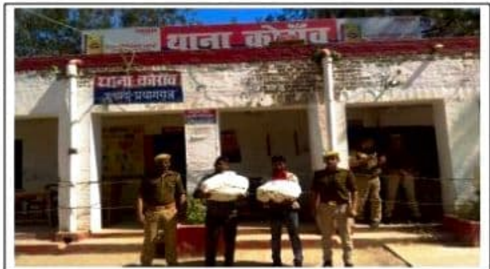
प्रभारी निरीक्षक थाना कोरांव प्रयागराज