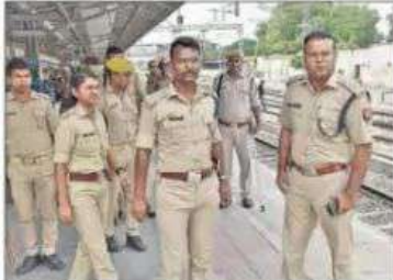
फतेहगढ़ स्टेशन पर नजर रखते सीआरपीएफ सदस्य।

फतेहगढ़, संवाददाता। अग्निपथ नहीं योजना का विरोध करने के लिए मुकुन्दपुर की फतेहगढ़ स्टेशन के चारों तरफ एकत्र हो रहे थे। पुलिस जब वहाँ भी ले चुका भाग गये। इस पर स्टेशन पर चौकसी बढ़ायी गयी। स्टेडियम के चारों तरफ प्रमुख सड़कों पर पुलिस नजर रखे हुये हैं।