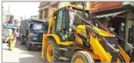
शहर के टाउन हाल तिराहे पर खड़ा बुलडोजर। संवाद

नमाज अदा कराई। प्रशासन ने शहर में जगह-जगह बुलडोजर खड़े करवाकर कड़ा संदेश दिया। उधर,