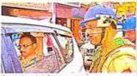
जिलाधिकारी व एसपी शहर का जायजा लिए।

शहर के इलाके का संचालन भी सुरक्षादाता बंदी कर दिया। शहर के इलाके का संचालन भी सुरक्षादाता बंदी कर दिया। शहर के इलाके का संचालन भी सुरक्षादाता बंदी कर दिया। शहर के इलाके का संचालन भी सुरक्षादाता बंदी कर दिया। शहर के इलाके का संचालन भी सुरक्षादाता बंदी कर दिया।