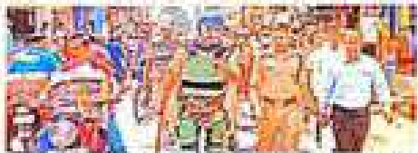
जुमे की नमाज का संपन्न होना।

शहर के इलाके का संचालन भी सुरक्षादाता बंदी कर दिया। शहर के इलाके का संचालन भी सुरक्षादाता बंदी कर दिया। शहर के इलाके का संचालन भी सुरक्षादाता बंदी कर दिया। शहर के इलाके का संचालन भी सुरक्षादाता बंदी कर दिया। शहर के इलाके का संचालन भी सुरक्षादाता बंदी कर दिया।