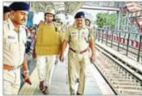
फर्रुखाबाद जिले के स्टेशन पर सुरक्षा का जवाब देने वाले आरपीएफ जवानों की मदद से ट्रेन को चलाने में मदद की।