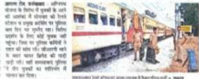
रेलवे स्टेशन व क्रासिंग पर दिनभर रही चौकसी