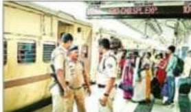
फर्रुखाबाद जिले के स्टेशन पर बांटा जिला के एलएफ व आरपीएफ जवानों की मदद से ट्रेन को चलाने में मदद की।

आरपीएफ जवानों को सुरक्षा प्रदान की। जवानों को सुरक्षा प्रदान की। जवानों को सुरक्षा प्रदान की।