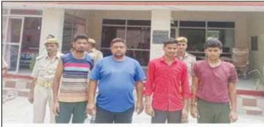
पुलिस को गिरफ्तार में खड़े आरोपी

आज समाचार सेवा फर्रुखाबाद 20 जून। सविद्य पर सेना में भर्ती करने का विरोध कर रहे युवाओं ने ट्रेन पर पथराव कर दिया था। इस मामले में आठ नामजद सहित 23 के खिलाफ एफआईआर दर्ज की है। जिससे पुलिस ने पथराव के साथ से तोड़फोड़ का भी चार्ज लगाया है। इहल कोलवाली में तैनात दरोणा मो.सरताज ने एफआईआर दर्ज कराया। जिसमें कहा कि पुलिस को सूचना मिली की रेलवे स्टेशन के किनारे युवाओं के ड्रग लाठी-डंडा, गड व ईट-पत्थर लेकर खड़े होने की सूचना पुलिस को मिली। आरोपियों ने पहले फर्रुखाबाद-कानपुर एक्सप्रेस