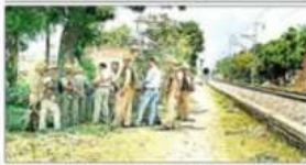
आरपीएफ जवानों की मदद से ट्रेन को चलाने में मदद की।

चार जोन व 13 सेक्टर में बांटा जिला जवानों को सुरक्षा प्रदान की। जवानों को सुरक्षा प्रदान की। जवानों को सुरक्षा प्रदान की।