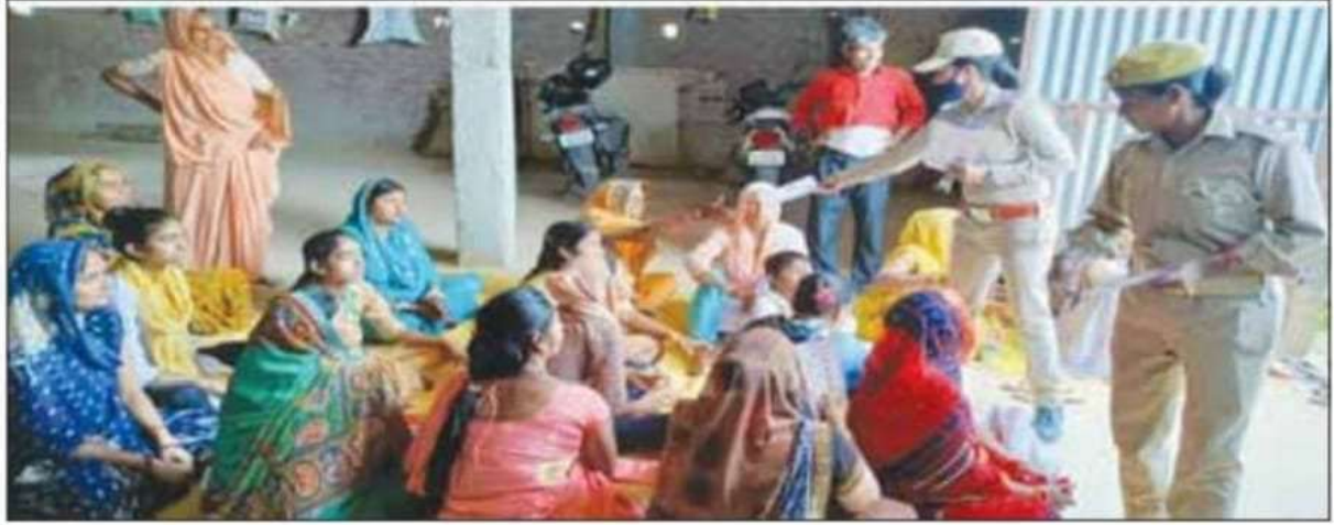
महिलाओं को पत्रक वितरित करती महिला कांस्टेबल