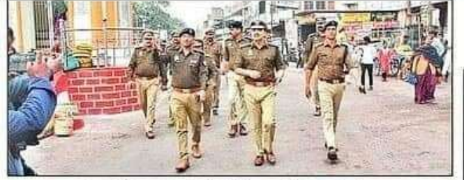
शहर में भ्रमण करते डीआईजी, एसपी व अन्य। संगठ