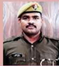
कोर्ट मोहरीर का० बन्टी