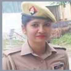
कोर्ट मोहरीर म०का० स्वाती