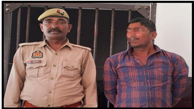
थाना को० शहर