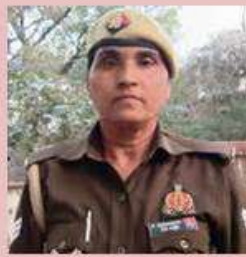
कोर्ट मोहरीर म०हे०का० जीवन बेटी