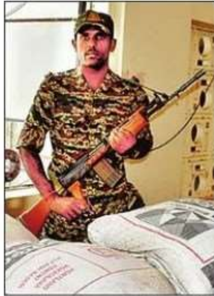
ईवीएम की सुरक्षा में तैनात अर्द्ध सैनिक बल के जवान। संवाद

स्ट्रांग रूम में रखे ईवीएम की सीसीटीवी कैमरे की मदद से कंट्रोल रूम से 24 घंटे निगरानी की जा रही है। इसके बाद अर्द्ध सैनिक बल व सशस्त्र पुलिस के जवानों को तैनात किया गया है। एक एसीपी, एक सीओ, तीन इंस्पेक्टर, 16 दरोगा, 20 हेड कांस्टेबल, 44 कांस्टेबल, एक प्लाटून सीएपीएस की तैनाती की गई है। स्ट्रांग रूम के बाहर भी जगह-