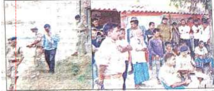
घटनास्थल पर लोगों के अंजामकारी जेरे शीर्षे शव उतार कर पोस्टमॉर्टम निरीक्षण के बाद शव उतार दिया।