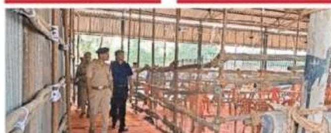
मंडी समिति में मतगणना के लिए टेबल के चारों तरफ बैरिकेडिंग • जगदर

• पांच पंढालों में 14-14 टेबलों पर होगी मतगणना