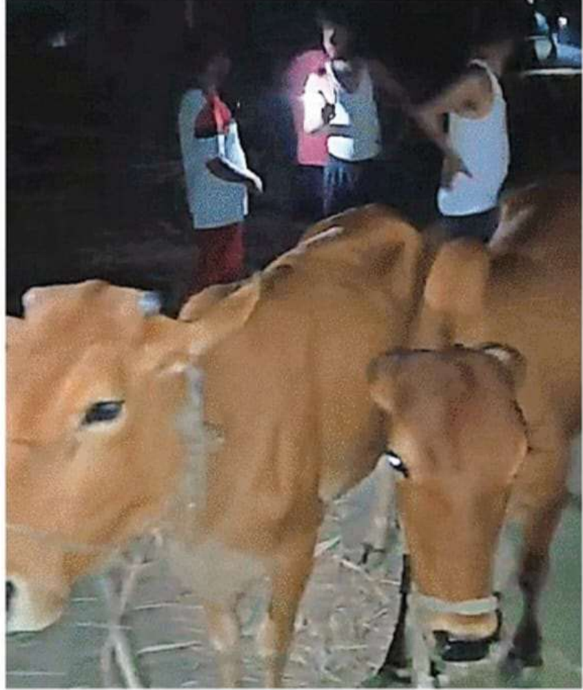
गोबराइ में ग्रामीणों द्वारा पकड़े गए गोवंश

● फायरिंग की सूचना पर पुलिस ने एक को लिया हिरासत में