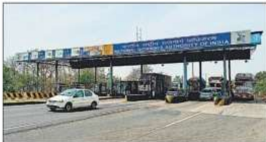
अयोध्या फोरलेन का चौकड़ी टोल प्लाजा।

बस्ती, हिन्दुस्तान टीएम। अयोध्या-गोरखपुर व अंबेडकरनगर के रास्ते फोर हवीलर पर सफर करना रविवार की आधी रात से महंगा हो गया है। नई दरें लागू होते ही वाहन चालकों की जब पर इसका असर पड़ना शुरू हो गया है। जैसे तो टोल की नई दरें पहली अप्रैल से ही लागू की जानी थी मगर लोकसभा चुनाव की वजह से दो महीने के लिए टोल दिया गया था। जैसे ही एक जून को आखिरी चरण का मतदान शनिवार को पूरा हुआ तो दो जून रविवार की आधी रात से नई दरें लागू कर दी गईं।