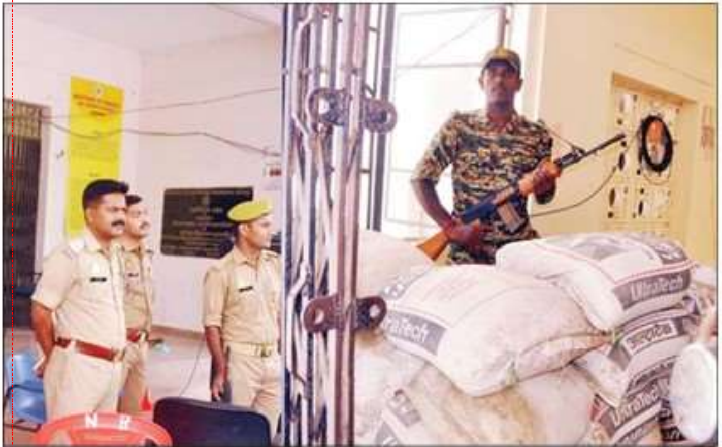
लोकसभा चुनाव के मतदान के बाद विश्वविद्यालय में बने स्ट्रोग रूम पर तैनात अर्द्धसैनिक व पुलिस के जवान।