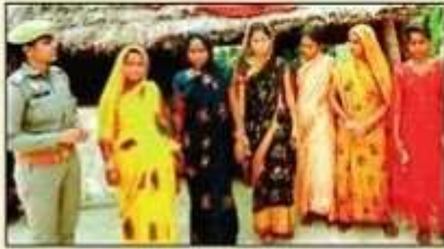
सोनबरसा में महिलाओं को जागरूक करती पुलिसकर्मी।

श्रावस्ती। महिलाओं के प्रति होने वाली हिंसा से उन्हें जागरूक करने के लिए रविवार महिला पुलिसकर्मियों ने सोनबरसा व दिकौली सहित कई अन्य स्थानों पर चौपाल का आयोजन किया। इस दौरान पुलिस ने महिलाओं व युवतियों को कई अन्य महत्वपूर्ण