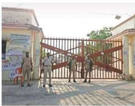
सुरक्षा के धरे में मंडी परिसर में बना स्ट्रांग रूम का प्रवेश

मतगणना स्थल पर सभी अतिकारी हाईलेवल आफ अलर्टनेस में होंगे। मतगणना स्थल पर पाने के लिए टंडा पानी, कूलर, पंखे, मेडिकल किट, एंजुलेंस, अग्निशमन बंत्र, फायर ब्रिगेड भी मौजूद रहेंगे। मतगणना स्थल पर बिजली को सतत आपूर्ति के लिए पावर बैक-अप प्लान और जनरेटर आदि की व्यवस्था भी चालू हालत में तैयार रखी जाएगी। मतगणना पंडाल, पोस्टल बैलेट व पंडाल में लगे कूलर में निबमित अंतराल पर पानी भरने के लिए अलग से कर्मचारियों की तैनाती की गई है। वया है प्रमुख तैयारी: बिजली का कंट्रोल रूम स्थापित हो जाएगा, 24 घंटे लिखित में कर्मियों की इव्यूटी लगाई जाएगी, दूरसंचार विभाग मंडी परिसर में इंटरनेट, टेलीफोन का कनेक्शन उपलब्ध कराएगा, कलेक्ट्रेट में