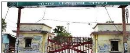
स्ट्रांग रूम मतगणना स्थल नवीन मंडी।