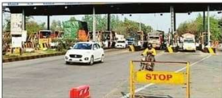
मड़वानगर स्थित टोल प्लाजा। संवाद

वस्ती। कार-जीप को तो राहत मिल गई है लेकिन, अन्य वाहनों के लिए तीन जून से 5 से 10 रुपये तक अधिक टोल टैक्स देना पड़ेगा। ऐसे में फोरलेन पर सफर अब मंहगा हो गया है। जिले में संचालित टोल प्लाजा पर टैक्स की संशोधित दरें दो जून की मध्यरात्रि 12 बजे से लागू हो गई हैं। बड़ा हुआ टोल वाहनों के श्रेणी के आधार पर लागू होगा।