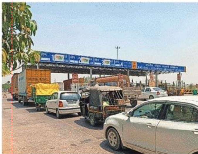
मड़वानगर टोलप्लाजा • जागरण