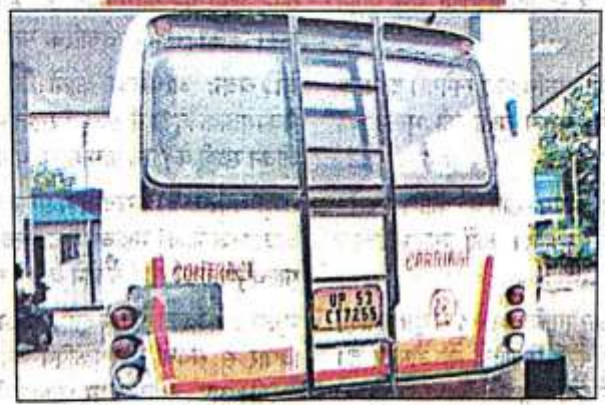
धर्मसिंहवा से सोनौली बार्डर पर चलने वाला प्राइवेट बस।

विरोध करने पर वाहन चालक बीच रास्ते में ही यात्री को उतारने की देता हैं धमकी