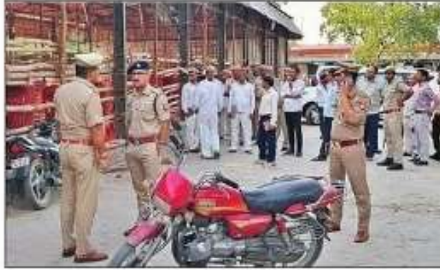
मतगणना स्थल पर तैयारियों का जायजा लेते एसपी। संवाद

मंडी समिति के खाडों में पांच विधानसभा क्षेत्र के वोटों की अलग-अलग गणना कराई जाएगी। प्रत्येक विधानसभा में 14 टेबल लगाए जाएंगे। प्रत्येक टेबल पर मतों की गणना के लिए पांच कार्मिक नियुक्त होंगे।