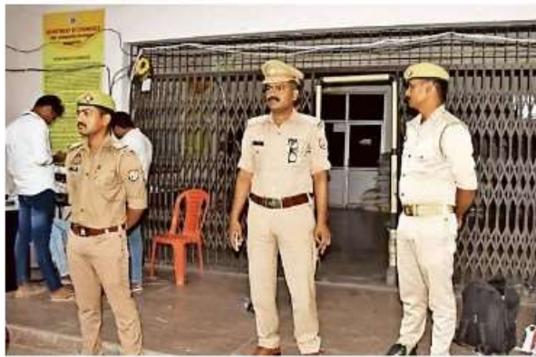
शिवि में बने स्ट्रांग रूम के बाहर कड़ी सुरक्षा व्यवस्था ● जागरण

जासं., गोरखपुर : विश्वविद्यालय परिसर में बनाए गए स्ट्रांग रूम में विधानसभावार रखे गए ईवीएम की त्रिस्तरीय सुरक्षा-व्यवस्था का इंतजाम किया गया है। अर्द्धसैनिक बलों के साथ ही पुलिसकर्मियों की 24 घंटे अलग-अलग शिफ्ट में ड्यूटी लगाई गई है। इसके अलावा कंट्रोल रूम बनाकर सीसी कैमरे से भी निगरानी की जा रही है। प्रेक्षक के साथ ही जिले के पुलिस व प्रशासनिक अधिकारियों की भी व्यवस्था पर नजर है। इसके अलावा इंडी गठबंधन के नेता व कार्यकर्ता भी रखवाली कर रहे हैं।