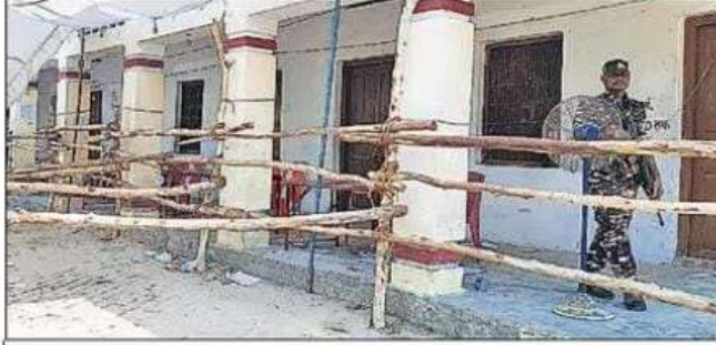
महाराजा अग्रसेन इंका में मतगणना के लिए की गई बैरिकेडिंग और स्ट्रांग रूम के पास मुस्तेद सीआरपीएफ का जवान।

देवरिया सदर, बांसगांव व सलेमपुर संसदीय क्षेत्र से संबंधित विधानसभा क्षेत्रों में हुए मतदान के बाद पोल्ड ईवीएम को शहर में देवरिया सीनियर सेकेंडरी स्कूल व महाराजा अग्रसेन इंटर कॉलेज में बने स्ट्रांग रूम में रखा गया है। महाराजा अग्रसेन इंटर कॉलेज में रुद्रपुर, भटपाररानी, सलेमपुर व बरहज विधानसभा क्षेत्र की पोल्ड ईवीएम रखा गया है। इसी प्रकार देवरिया, पथरदेवा व रामपुर कारखाना विधानसभा क्षेत्र का पोल्ड ईवीएम देवरिया सीनियर सेकेंडरी स्कूल में कड़ी सुरक्षा के बीच रखा गया है। वहीं सातों विधानसभा क्षेत्र की मतगणना के लिए कुल 14-14 टेबल बनाए गए हैं। इस प्रकार कुल