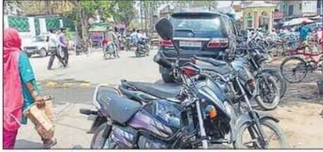
वीर विनय चौराहा के गोंडा मार्ग पर सड़क पर खड़े वाहन।

नगर के वीर विनय चौराहा गोंडा रोड पर रोडवेज बसों व ई-रिक्शा चालकों की मनमानी से आए दिन जाम लगा रहता है। रोडवेज बस चालक सड़क पर दो-तीन बसें एक साथ खड़ा कर देते हैं जिससे लंबा जाम लग जाता है। इसी तरह झारखंडी मंदिर से रोडवेज जाने वाले मार्ग पर कई बसों को एक साथ खड़ा कर दिए जाने से लोगों को आवागमन में काफी दिक्कतों का सामना