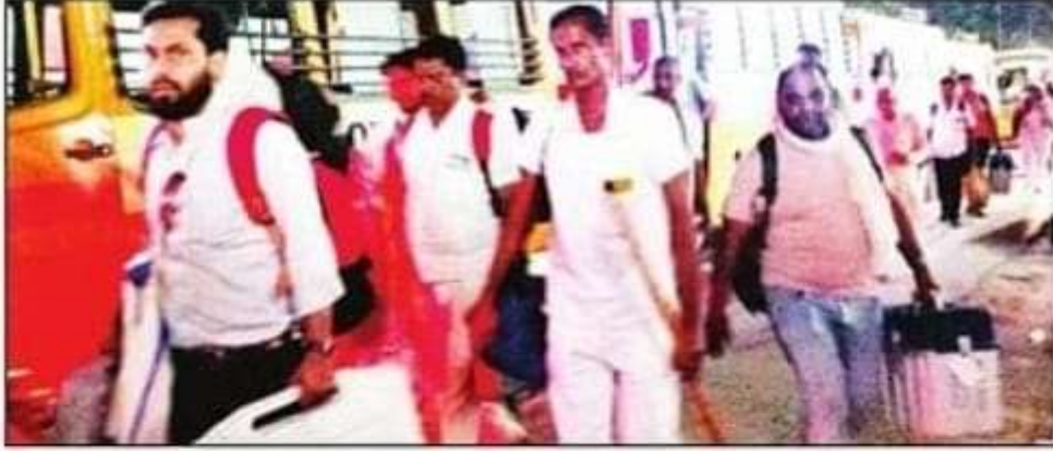
ईवीएम जमा करने के लिए पैदल जाते कर्मचारी। संवाद