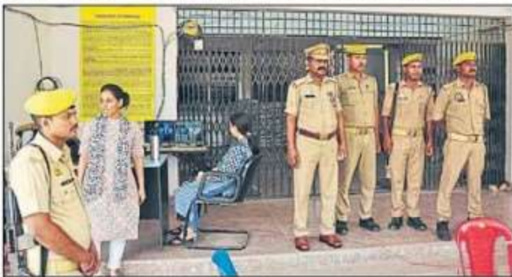
गोरखपुर विश्वविद्यालय में ईवीएम की सुरक्षा में तैनात पुलिस के जवान। • हिन्दुस्तान

पांच कंपनी अर्द्ध सैनिक बल रहेगी मुस्तैद : लोकसभा चुनाव के लिए जिले में 28 कंपनी अर्द्ध सैनिक सैनिक बल को बुलाया गया था। चुनाव के बाद इसमें से पांच कंपनी अर्द्ध सैनिक बल को चार जून को मतगणना कराने के लिए रोका गया है।