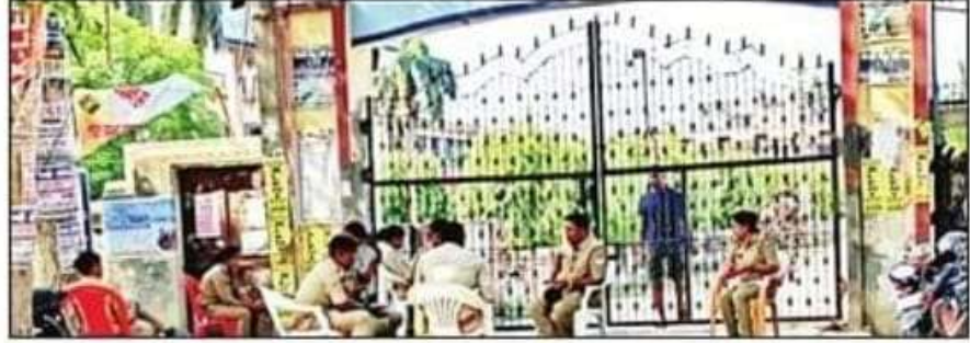
यूएन डिग्री कॉलेज के गेट पर ईवीएम की सुरक्षा में लगे पुलिसकर्मी। संवाद

जिला निर्वाचन अधिकारी उमेश मिश्रा ने बताया कि मतगणना को लेकर पारदर्शिता बरती जा रही है। इसके लिए स्ट्रांग रूम से मुख्य गेट तक सीसी टीवी कैमरा लगाया गया है। मतदान के दिन भी टीवी स्क्रीन लगाई जाएगी, ताकि मतगणना की जानकारी होती रहे। मतगणना के दिन सुबह सात बजे तक मतगणना एजेंटों को पहुंचना है। कुशीनगर लोकसभा सीट के अलावा देवरिया लोकसभा क्षेत्र के तमकुहीराज और फाजिलनगर विधानसभा क्षेत्र की मतगणना भी होगी। मतगणना स्थल पर प्रत्याशी दो