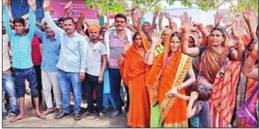
देसी शराब की दुकान हटाने को लेकर प्रदर्शन करती महिलाएं।