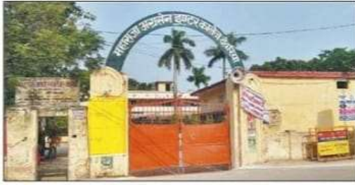
महाराजा अग्रसेन इंटर कॉलेज स्थित स्ट्रांग रूम। संवाद

जिले के दो स्ट्रांग रूम डीएसएस व महाराजा अग्रसेन इंटर कॉलेज में मतगणना होगी। यहां कड़ी सुरक्षा के बीच ईवीएम को रखा गया है। यहीं पर चार जून को सुबह साढ़े छह बजे मतगणना केंद्र खुल