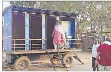
मोबाइल टयबलेट की जंच करती ईजा।