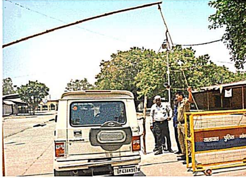
मतगणना स्थल के पास बोलेरो सवार से पूछताछ करती एलआइयू की टीम

• प्रत्येक चक्र के मतगणना के आंकड़े किए जाएंगे प्रदर्शित