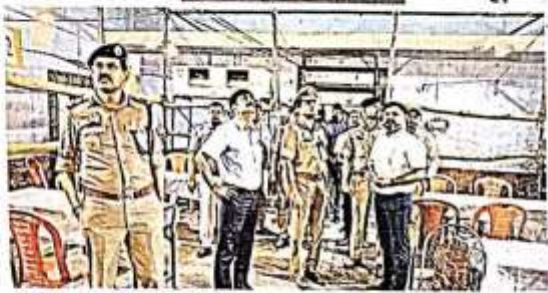
मतगणना स्थल की जांच करते अधिकारी • जहलरा