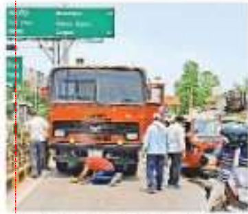
दमकल की गाड़ी के नीचे फंसे गाई को बाहर निकालते पुलिसकर्मी व सहगीर • खजुरा

जामरुण संवाददाता गोरखपुर : यातायात तिराहे पर सोमवार को दोपहर उलटी दिशा में बाइक लेकर जा रहे रेलवे के गाई दमकल की गाड़ी से टकरा गए। हादसे में वह बाइक लेकर गाड़ी के चारों पहिया के बीच में घुस गए। मजदूरों के चिल्लाने पर चालक ने काल ब्रेक लगा दिया जिससे गाई को जून बच गई लेकिन बाइक के परछाये उड़ गए।