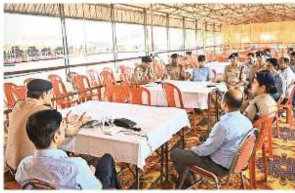
मतगणना स्थल बैठक करते अधिकारियों व मतगणना को लेकर जारुमिंड बैठक में तद्विना पुलिसकर्मी को पीछरओसे

जैसे, सिद्धार्थनगर - लोकसभा चुनाव के मतों की गणना आज होगी। इसकी सुरक्षा को लेकर जिला प्रशासन ने दृष्टांत व्यवस्था की है। वी सी सीट की परिधि में स्थित मतगणना के लिए जारी पोलिसारमेंट के आवागमन को ही अनुमति होगी। मंडी समिति के निरूद्ध घंटों में रहने वाले लोग भी अपने बहनों का प्रयोग नहीं कर पाएंगे। उन्हें मुख्य मार्ग तक सिर्फ पैदल आवागमन की सुविधा दी गई है। गर्मियों को देखते हुए कार्टिंग स्थल पर कर्मचारियों एवं प्रत्याशियों एंटी और सुरक्षा कर्मियों के लिए पेयजल के अलावा डिब्बे में ओआरएस के पाउडर वाले पोल का पानी भी मौजूद होगा। तबकी गर्मियों की समस्या होने पर तत्काल इन्हें सहित पहुंचाई जा सके। मतगणना से जुड़े किसी व्यक्ति को स्थल से जुड़ी समस्या होने पर तत्काल उसे निकित्ताकीय व्यवस्था उपलब्ध कराने जाएगी। गर्मियों से रहित पहुंचने के लिए कुल और पंखे की पर्याप्त व्यवस्था की गई है। स्थल की निगरानी सीसी कैमरे से की जाएगी। वोटों की गिनती को देखते हुए नेपाल सीमा पर भी गश्त बढ़ा दी गई है। खेपवार को एक्सट्रामे व पुलिस की संयुक्त टीम ने चाउडिगों पर लगातार गश्त किया।