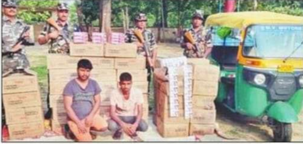
भारत-नेपाल सीमा से कॉस्मेटिक सामान के साथ पकड़े गए आरोपी। संवाद