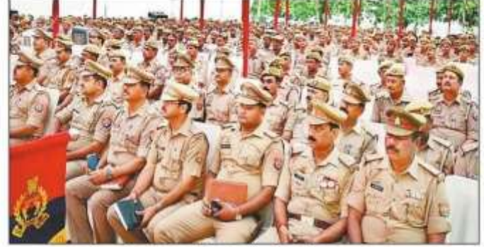
पुलिस लाइंस परिसर में आयोजित बैठक में उपस्थित पुलिस के जवान।

लोकसभा चुनाव की मतगणना को सुकुरात और बिबाद मुक्त करने की नीयत में प्रशासन ने सुरक्षा के पुख्त इंतजाम किए हैं। सुरक्षा में सैफ्टी ने न हो और जबरदस्त निगरानी को ज रखेंगे। इसके लिए शहर को दो जेन और आठ सेक्टर में बांटा गया है। दो लिफ्ट में 700 से अधिक जवान आठ सेक्टर में ड्यूटी पर मुस्तैद रहेंगे, जबकि अंतर पूरा बर्जित अर्द्धदैनिक बल के जखन के