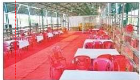
मंडी समिति में मतों की गिनती के लिए तैयार किया गया पंडाल। सचिव

मंडी समिति के पांच यार्डों में विधानसभा वार बनाई गई व्यवस्था, प्रत्येक यार्ड में रहेंगे 14 टेबल, गिने जाएंगे ईवीएम में पड़े 1078578 वोट