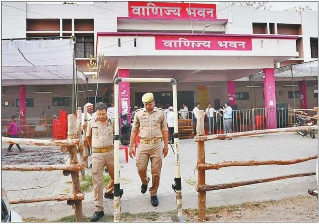
गोरखपुर विश्वविद्यालय के वाणिज्य भवन में मतगणना के लिए की गई तैयारी।

बजे ही गणनास्थल पर स्वास्थ्य शिविर हो जाएगा शुरू