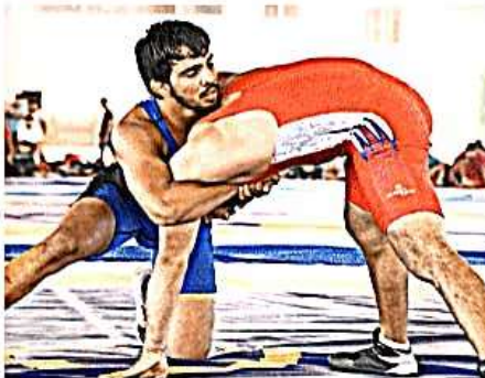
नंदिनी नगर स्पोर्ट्स स्टेडियम में एक दूसरे को घटखनी देने पहलवान • जागरण

ससू, जागरण • नवागंज (गोंडा) : राज स्पोर्ट्स अंडर-17 व अंडर-23 आयु वर्ग की तीन दिवसीय राज स्पोर्ट्स कुश्ती प्रतियोगिता में प्रथम स्थान हासिल करने वाले पहलवानों ने एशियन चैंपियनशिप के ट्रायल को लेकर क्वालीफाई किया है। अलग-अलग आयु वर्ग की प्रतियोगिता में 60 पहलवान ट्रायल के लिए चयनित किए गए हैं। प्रलोक आयु वर्ग में प्रोबेरोमन, प्री स्टैंडल व महिला कुश्ती के दस दस पहलवान शामिल हैं। अंडर-17 आयु वर्ग के पहलवानों का ट्रायल भारतीय कुश्ती संघ सात जून को नई दिल्ली के केडी जागव इंडोर स्टेडियम में कराया।