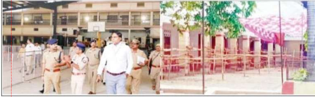
मतगणना स्थल का निरीक्षण करते गोरखपुर रेंज के डीआईजी आनन्द कुलकर्णी व मतगणना स्थल पर की गयी बैरिकेटिंग।

सीसीटीवी कैमरों की निगहबानी में दो केन्द्रों पर होगी मतगणना