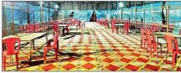
बलरामपुर के मंडी समिति में मतगणना के लिए तैयार की गई देखल। संवाद

420 कर्मियों के कर्तव्यों पर मतगणना कराने का जिम्मा : ज्यों कक्ष में 420 कर्मियों के कर्तव्यों पर मतगणना कराने का जिम्मा है 1105 माइक्रो आन्वर्कर, 105