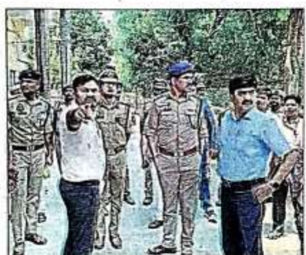
एचआरपीजी कॉलेज में एडीजी, कमिश्नर व आईजी की एचआरपीजी कॉलेज में व्यवस्था की जानकारी देते जिला निबंधन अधिकारी।