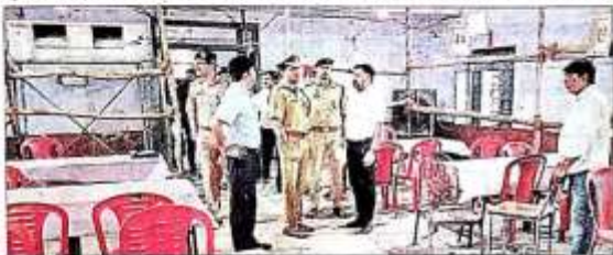
एचआरपीजी कॉलेज में मतगणना के लिए लगाए गए टेबल देखते अफसरों।

संतकबीरनगर। लोक सभा चुनाव में 28 अंकों के मतदान के बाद मत गणना की तैयारी शुरू हो गई। मतगणना के लिए मतदान केंद्रों में सुरक्षा के लिए पुलिस बल तैयार है। मतगणना के लिए मतदान केंद्रों में सुरक्षा के लिए पुलिस बल तैयार है। मतगणना के लिए मतदान केंद्रों में सुरक्षा के लिए पुलिस बल तैयार है।