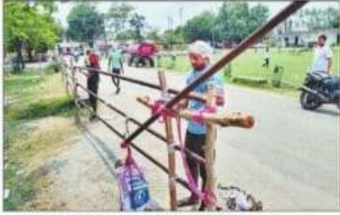
कलक्ट्रेट परिसर में मतगणना को लेकर बैरिकेडिंग करता मजदूर। संवाद

महाराजगंज। मतगणना को लेकर तैयारी पूरी कर ली गई है। शहर में मतगणना को डायवर्सन कर दिया गया है। मुख्य रोड के अलग कलक्ट्रेट की ओर भारी वाहन नहीं जा सकेंगे। कलक्ट्रेट रोड से लेकर शहर में प्रमुख स्थानों पर यातायात पुलिस तैनात रहेगी। पार्किंग के लिए भी अलग व्यवस्था की गई है। सुबह पांच से शाम पांच बजे तक डायवर्सन रहेगा। शहर में वाहन से जाने वाले सचेत रहें। चुनाव परिणाम जानने के लिए जिले में दूर दराब से अलग-अलग पेट्रोलिंग के कार्यक्रमों और समर्थक आएंगे। इनके वाहनों को पार्किंग के लिए महिला अस्पताल के सामने व्यवस्था रहेगी। वहीं मतगणना कार्मियों