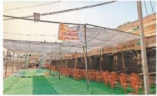
पड़रौना नगर के उदित नारायण इंटर कालेज में मतगणना स्थल पर लगाया गया पेंडाल व की गई बैरिकेडिंग • जायगण

बाहरी व्यवस्था के लिए तैनात रहेंगे तीन मजिस्ट्रेट : उप जिला निर्वाचन अधिकारी एडीएम वैभव मिश्र ने बताया कि इंटर कालेज व डिग्री कालेज के प्रवेश गेट पर एक-एक