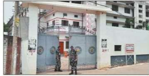
डीएसएस स्थित स्ट्रांग रूम पर मुस्तैद जवान।