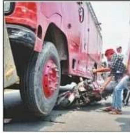
दमकल की गाड़ी में फंसी बाइक।

बाइक के परखच्चे उड़ गए थे। लेकिन रेलवे का गार्ड सुरक्षित बाहर निकला। हल्की चोट लगने के कारण दमकलकर्मी और यातायात पुलिस कर्मियों ने उसे जिला अस्पताल पहुंचाया। प्राथमिक इलाज के बाद डॉक्टरों ने गार्ड को घर भेज दिया।