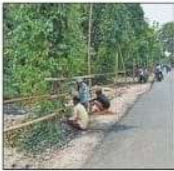
उदित नारायण इंटर कॉलेज में मतगणना की तैयारी में सड़क किनारे बैरिकेडिंग करते मजदूर। संवाद

में कुल 57.57 प्रतिशत मतदान हुआ है। प्रत्येक विधानसभा क्षेत्र की मतगणना के लिए 14 टेबल लगाए गए हैं। कुल 392 कार्मिक मतगणना करेंगे। दस प्रतिशत कार्मिक रिजर्व में रहेंगे। मतगणना में पोस्टल बैलेट की गिनती के लिए पांच टेबल लगाए जाएंगे, जबकि तमकुहीराज और फाजिलनगर विधानसभा क्षेत्र के पोस्टल बैलेट गणना के लिए देवरिया भेज दिए जाएंगे।