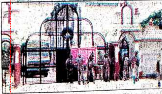
मतगणना स्थल के मुख्य गेट पर तैनात पुलिस बल।

मतगणना संपन्न होने के बाद विजयी एवं उनके निकटतम प्रतिद्वंदी (पराजित प्रत्याशी) की सुरक्षा व्यवस्था का जिम्मा भी अधिकारियों को देते