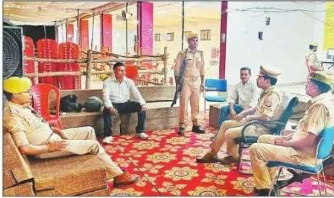
गोरखपुर विश्वविद्यालय के वाणिज्य भवन पर मतगणना के लिए की गई तैयारी। मतगणना के लिए तैयारी करते मजदूर।

मतगणना के लिए टी गई ट्रेनिंग : मतगणना को लेकर बाबा गंधीरनाथ प्रशासक में प्रेक्षकों के सामने 842 मतगणना कर्मचारियों को ट्रेनिंग दी गई। इंडोवैम मतगणना के लिए 171 गणना सुपरवाइजर, 171 माइक्रो ऑब्जर्वर लगाए गए हैं। कोई भी मतगणना एजेंट या कर्मचारी मोबाइल फोन लेकर नहीं जाएगा।