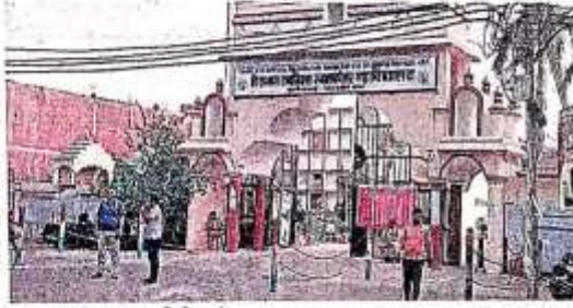
मतगणना स्थल एचआरपीजी कॉलेज • जवाहर