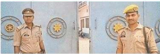
देवरिया सीनियर सेकेंडरी स्कूल के बाहर तैनात पुलिसकर्मी

● हर काउंटर पर लगाए गए हैं सीसी कैमरे, जो हर गतिविधि करेंगे कैद