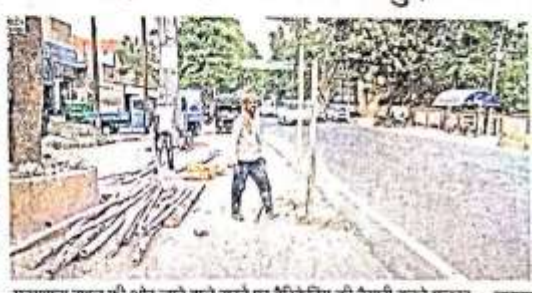
मतगणना स्थल की ओर जाने वाले रास्ते पर बैरिकेडिंग की तैयारी करते मजदूर