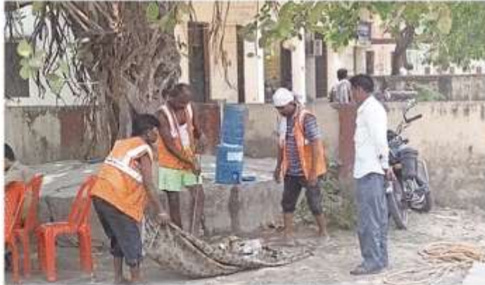
मंडी समिति भगवतीगंज में सफाई करते नपाप के कर्मचारी • जागरण

क्षेत्र की उतरौला के साथ गैंसड़ी विधानसभा उप चुनाव के मतों की गणना होगी। जिला निर्वाचन अधिकारी अरविंद सिंह ने बताया कि तैयारी पूरी कर ली गई है। सभी विधानसभा में 14-14 टेबलों पर मतों की गणना होगी। पोस्टल वॉलेट पेपर व ईटीपीवीएस की गणना के लिए अलग टेबल लगेगी। गर्मियों को देखते हुए मतगणना हाल में दो-दो