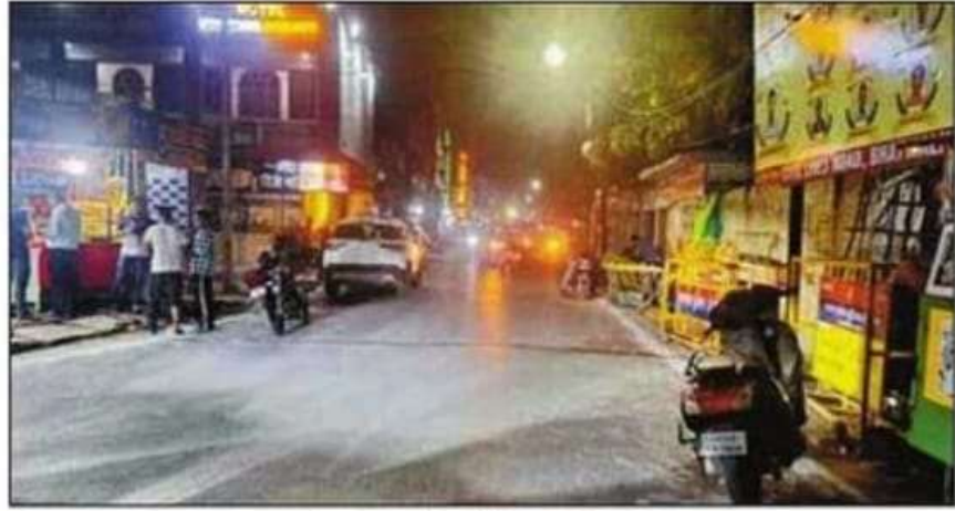
जलकल रोड पर की गई बैरिकेडिंग। संवाद संवाद

इसी तरह मतगणना स्थल महाराजा अग्रसेन इंटर कॉलेज देवरिया में विधानसभा 340-भटपाररानी, 341- सलेमपुर के मतगणना अभिकर्ता (एजेंट) गेट नंबर एक से प्रवेश करेंगे। विधान सभा 336-रुद्रपुर, 342- बरहज