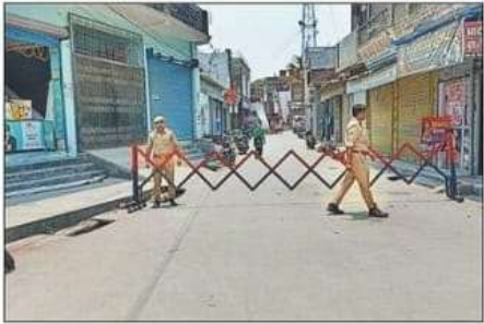
मतगणना स्थल की ओर जाने वाली सड़क पर बेलवा चुंगी स्थित मंदिर के पास और कॉलेज रोड पर मतगणना की तैयारी को लेकर सड़क पर लगाव गया अवरुध। संवाद

कुशीनगर संसदीय निर्वाचन क्षेत्र के लिए अंतिम चरण में हुए लोकसभा चुनाव के बाद से ही लोग अब परिणाम जानने को उत्सुक हैं। लोगों को अब चुनाव के नतीजे का