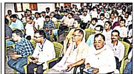
सोमवार को एनवीएस में प्रशिक्षण लेते मतगणना कार्मिक।