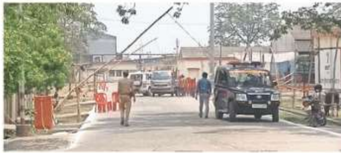
मंडी समिति भगवतीगंज में गेट नंबर एक पर लगा बैरियर • जागरण