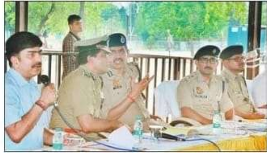
मतगणना स्थल पर हुई बैठक में मौजूद अधिकारी।