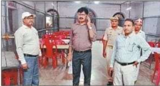
मतगणना की तैयारी कराते उपजिलाधिकारी व अधिशासी अधिकारी पडरौना। संवाद

कुशीनगर संसदीय क्षेत्र के खड़ुडा विधानसभा क्षेत्र में 56.44 फीसदी, कुशीनगर विधानसभा क्षेत्र में 56.90 फीसदी, पडरौना विधानसभा क्षेत्र में 58.03 फीसदी, रामकोला विधानसभा क्षेत्र में 56.16 फीसदी और हाटा विधानसभा क्षेत्र में 56.54 फीसदी समेत कुशीनगर संसदीय क्षेत्र