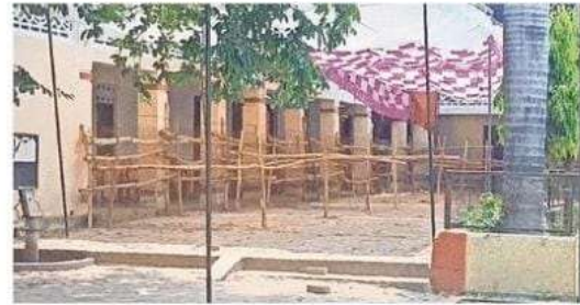
महाराजा अग्रसेन इंटर कालेज स्थित मतगणना स्थल पर की गई बैरिकेडिंग • जागरण