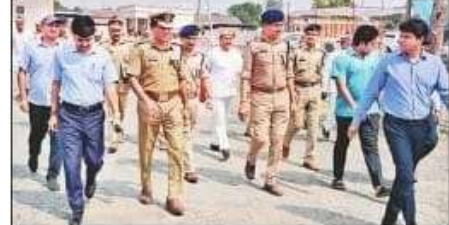
मतगणना स्थल का निरीक्षण करते अधिकारी। सचिव