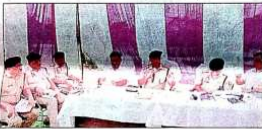
पुलिस लाइंस में बैठक करते डीएम और एसपी। संवाद

संतकबीरनगर। लोक सभा चुनाव की मतगणना को लेकर पुलिस-प्रशासन ने मतगणना स्थल पर त्रिस्तरीय सुरक्षा घेरा बनाया है।