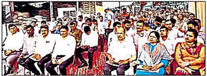
सोमवार को गल्ला मंडी में वीफिंग में मौजूद अफसर।