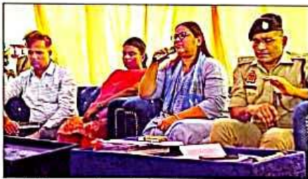
गौडा में मतगणना में होने अस्पष्टता व पुनरावलोकन का डीक करती है।

गोंडा लोकसभा के सदर, मनकापुर, गौदा व फेडरल विधानसभा क्षेत्र के वोटों की गिनती करने का पता चला चंडी में होगी। उत्तरीय विधानसभा क्षेत्र के वोटों की गिनती बलरामपुर में होगी। इसी तरह से कैसरगंज लोकसभा क्षेत्र के कटरा बाजार, कटौलगांव और सारनगंज के वोटों की गिनती मोटा मुजफ्फरपुर विधान सभा क्षेत्र में होगी। वहीं, कैसरगंज और पयागपुर के वोटों की गिनती बहराइच में होगी। महानगर जिला निर्वाचन अधिकारी जननील वर्मा ने बताया कि मतगणना सुबह आठ बजे से शुरू होगी। परिणाम के लिए कोई समय निर्धारित नहीं है।