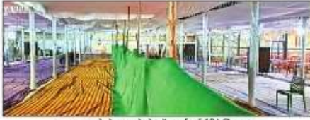
मतगणना को लेकर कलेक्टरों में कई गई वीवीपैटिंग। संवाद

श्रावस्ती: 18वीं लोकसभा के लिए हुए मतगणना के मतों की गणना मंगलवार को सुबह आठ बजे से होगी। सुबह साढ़े सात बजे स्टेशन रुक छोड़ा जाएगा। मतगणना के बाद सभी ईवीएम व वीवीपैट खोल कर स्टेशन रुक में रखे जाएंगे। जो 45 दिन तक सुरक्षित रहेंगे। इस दौरान किसी प्रावधानों में संशोधन में सुझाव को लेकर कोई राय न मिला तो 45 दिन बाद ईवीएम को खोल भेजा जाएगा।