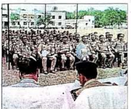
लोकसभा चुनाव की मतगणना को सुगमता कल्पना करने के लिए पुलिस लाइन में आयोजित हुई ब्रीफिंग में शामिल पुलिस कर्मी।