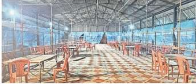
मंडी समिति भगवतीगंज में मतगणना के लिए लगी कुर्सियां व टेबल • लो. सुवर्णा खिाव

एक साथ 14 टेबल पर होगी गणना: नवीन मंडी समिति भगवतीगंज में जिले की चारों विधानसभा श्रावस्ती संसदीय क्षेत्र की तीन तुलसीपुर, गैंसड़ी, बलरामपुर व गोंडा संसदीय