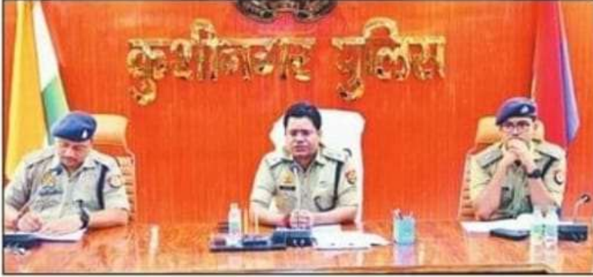
पुलिस लाइन में पुलिसकर्मियों को एसपी ने समझाई ड्यूटी।