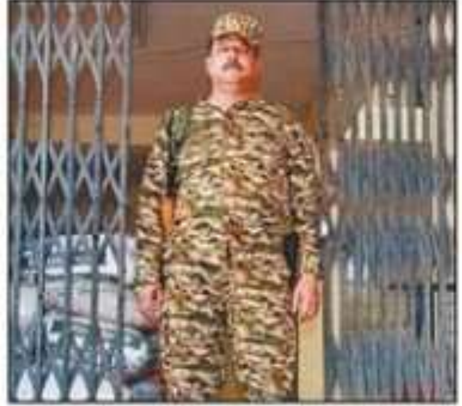
सुरक्षा में तैनात जवान।