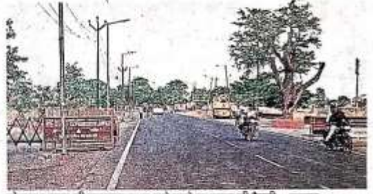
लोकसभा चुनाव की मतगणना स्थल वाले रास्ते पर सुरक्षा की तैयारी • जवाहर

चतुर्थ श्रेणी कुल चार मतगणना कर्मी लगे रहेंगे। रिजर्व में तीन पार्टी यानी 12 मतगणना कर्मी रिजर्व में रहेंगे। असिस्टेंट रिटर्निंग ऑफिसर (एआरओ) टेबल के लिए दो पार्टी यानी आठ मतगणना कर्मी रहेंगे। इस तरह एक विधानसभा के लिए कुल 76 मतगणना कर्मी की दृष्टी लगेगी। वहीं, डॉक मत पत्र की गिनती के लिए आठ टेबल लगेगे, रिटर्निंग ऑफिसर (आरओ) के पास 32 मतगणना कर्मी वहीं रिजर्व में तीन पार्टी रहेंगे। इस प्रकार जिले के तीन विधानसभा के ईवीएम के लिए 228 व डॉक मत