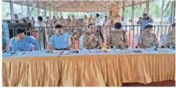
मतगणना स्थल की व्यवस्था करने के लिए सीओ, उपनिरीक्षक, आरक्षी, एसएसबी और पीएसी के जवानों की मौजूदगी में मतगणना स्थल पर व्रीफिंग की जा रही है।