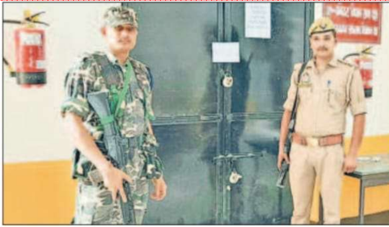
स्ट्रांग रूम की सुरक्षा में तैनात सीपीएमएफ।