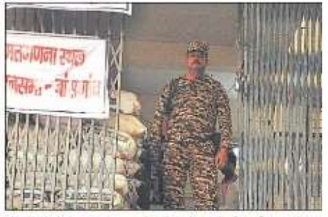
सोगवार को गोरखपुर विश्वविद्यालय के वाणिज्य विभाग में एवीएम की सुरक्षा में तैनात अर्द्ध सैनिक बल का जवान।