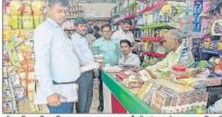
पीपल तिराहा स्थित किचन दुकान पर खाद्य पदार्थों की जांच करने खाद्य सुरक्षाधिकारी

खाद्य पदार्थों में मिलावट का कारोबार जिले में तेजी से फैल चुका है। बाजारों में इस्वी, मिर्च, धनिया व मसाले नकली बिक रहे हैं। जिले के कई स्थाई एवं साप्ताहिक बाजारों नकली खाद्य पदार्थों की बिक्री घटने से की जा रही है।