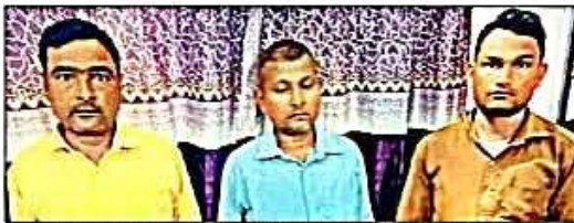
खरगपुर में एंटी करप्शन टीम की गिरफ्तार में आए जेई और लाइनमैन। (संवाद)

खरगपुर/गोंडा। अज्ञात निवास संरक्षण की देखरेख में डंडा इकाई ने रिश्वतखोरी पर शिकायत करने हुए अवर अभियंता और दो लाइनमैन को रंगे हाथ दबोचा। बुधवार देर रात बिजलिस टीम ने तीनों को शिकारकर्ता से 16000 रुपये घुस लेते गिरफ्तार कर लिया। खरगपुर पावर हाउस पर तैनात जेई ने चोरी के दौरान बिजली चोरी का मुहताब न दर्ज करने के एवज में रकम मंगी थी। देर रात इटियाथोक थाने में एंटी करप्शन विंग में तीनों के खिलाफ केस दर्ज कराया है।