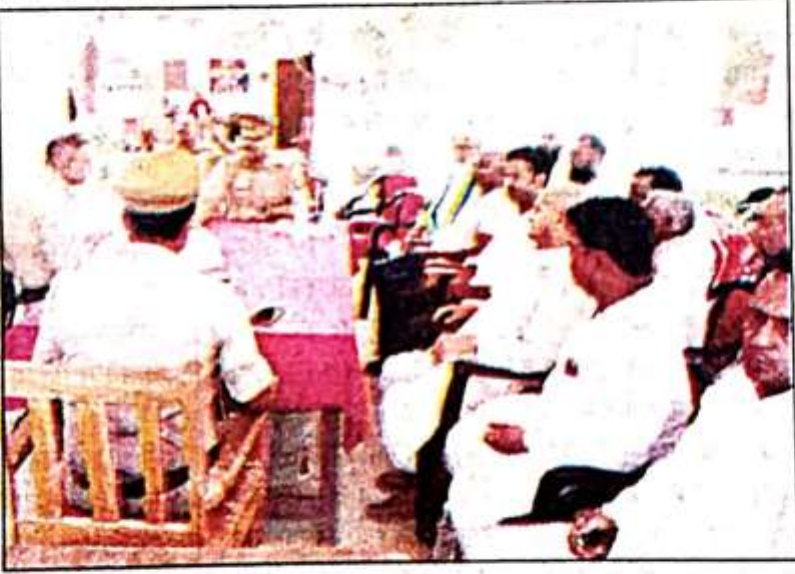
पीस कमेटी की बैठक को संबोधित करते सीओ धनघटा।

में जुटी हुई है। सीओ ने कहा कि त्योहार के मौके पर सभी संवेदनशील स्थानों पर सुरक्षा के व्यापक प्रबंध किए जाएंगे साथ ही चप्पे-चप्पे पर पुलिसबल की तैनाती भी की जाएगी। प्रभारी