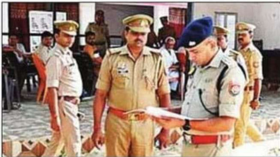
पुरंदरपुर थाने का निरीक्षण करते एसपी।