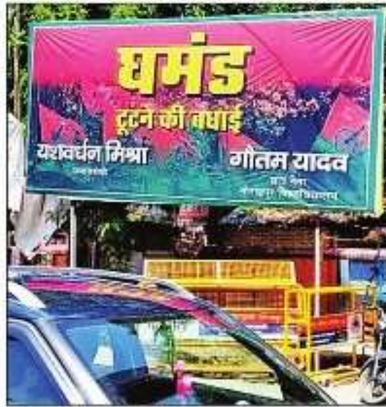
यूनिवर्सिटी चौराहे के पास लगाया गया पोस्टर। अमर