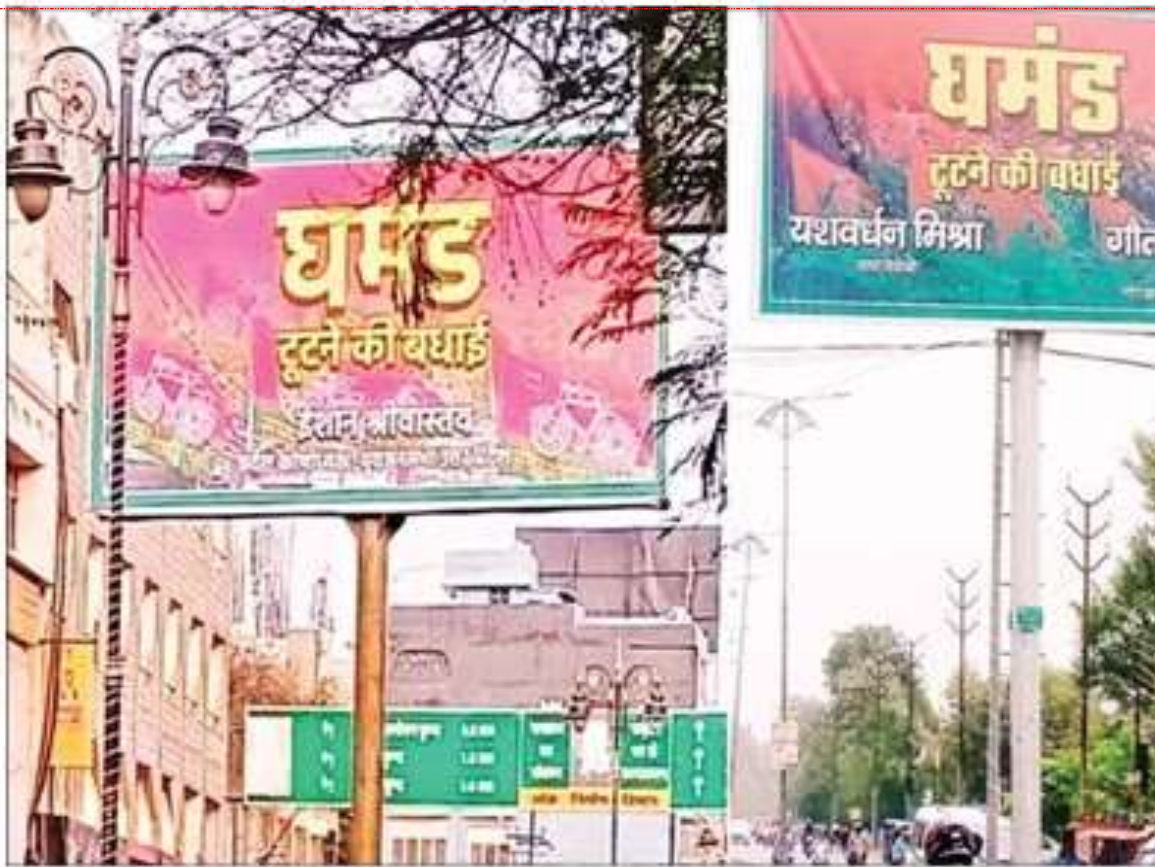
दिनभर घर्षा में रहने वाले शहर में लगे ये होर्डिंग्स... ।