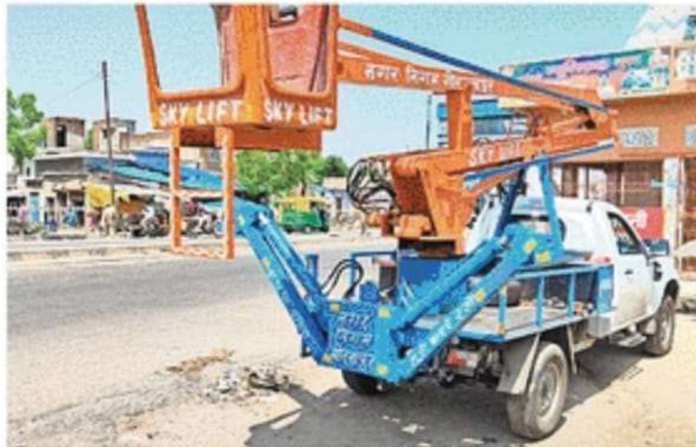
छावनी थाने के बाहर खड़ा गोरखपुर नगर निगम का स्काई लिफ्ट वाहन