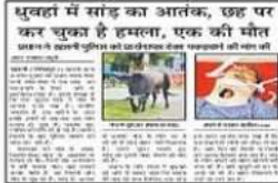
6 जून के अंक में छपी खबर।