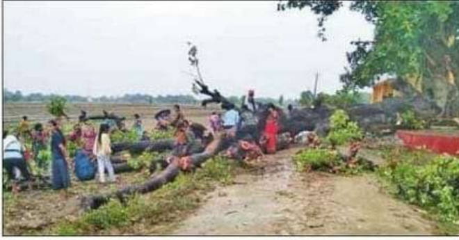
आंधी से सड़क पर गिरा बरगद का पेड़। संवाद

भकान की गिरी छत, दो घायल : नगर के छुछिया गेट पर पड़रौना