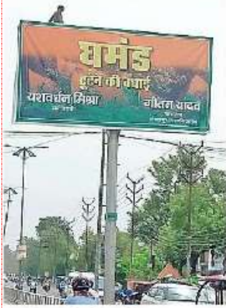
शहर में लगा विवादित होर्डिंग

जागरण संवाददाता, गोरखपुर : शहर के सभी प्रमुख चौराहों पर गुरुवार को भोर में विवादित होर्डिंग लगा दिया गया। एक राजनीतिक दल के झंडे वाले बैकग्राउंड की होर्डिंग पर दो छात्रनेताओं का नाम लिखा है। मामला संज्ञान में आने पर पुलिस ने सभी होर्डिंग उतरवा दिया। कैंट थाना पुलिस ने मुकदमा दर्ज कर एक युवक को हिरासत में लिया है।