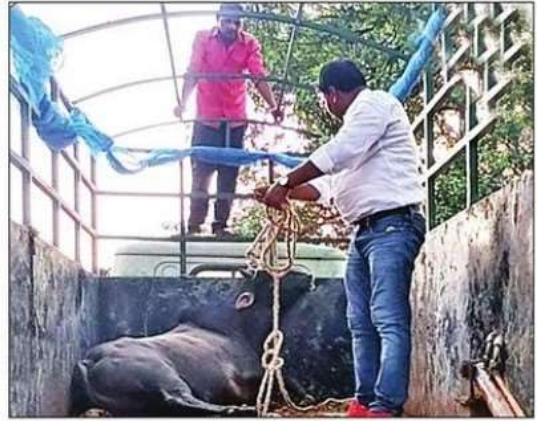
पकड़े गए सांड को वाहन पर लादा गया। संवाद

ने बुधवार को थाने में प्रार्थनापत्र दिया था। बताया था कि एक सांड ने