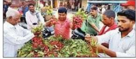
पड़रौना नगर के तिलक चौक पर लीची की खरीदारी करते लोग।