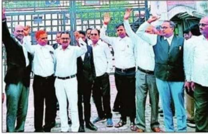
जिला न्यायालय के गेट पर प्रदर्शन करते अधिवक्ता। संवाद