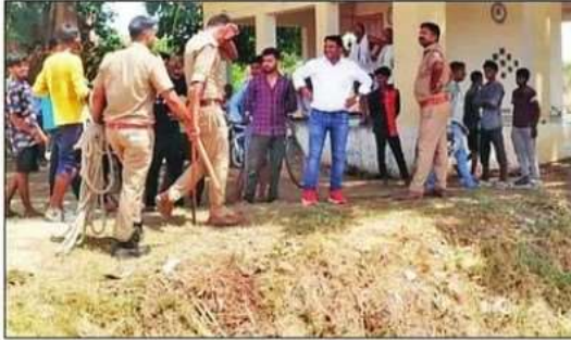
सांड को पकड़ने के लिए निकली तहसील व पुलिस कर्मियों की टीम।