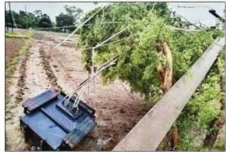
हतया में गिरा 63 केवी का ट्रांसफॉर्मर व पोल।