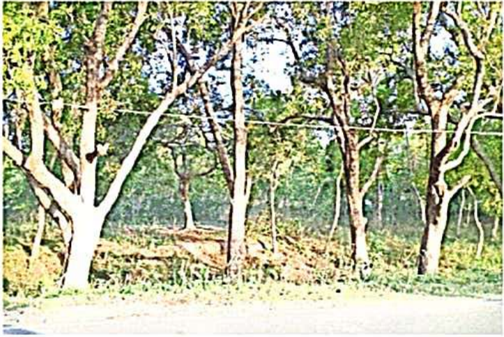
बेलसर के डिंडिसियाकला में अग्निशमन केंद्र निर्माण के लिए प्रस्तावित भूमि