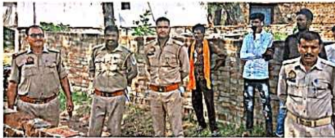
मेहनौन के लखनीपुर घटनास्थल पर मौजूद पुलिसकर्मी