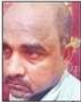
पकड़ा गया आरोपी।

चोर के पकड़े जाने के बाद लोगों की भीड़ इकट्ठा हो गई। इसके बाद