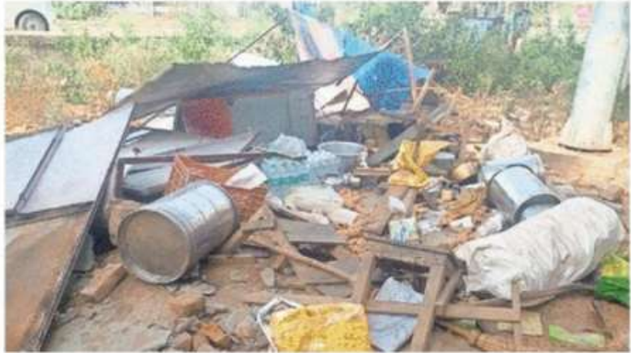
हरैया तहसील गेट के पास की दुकान का बिखरा सामान • जागरण

तहसील गेट के बगल दुकानों पर तहसील प्रशासन मेहरवान: हरैया तहसील गेट के बगल एक दुकान पर अतिक्रमण हटाने की कार्रवाई और अन्य दुकानों को छूट देना लोगों में चर्चा का विषय बना हुआ है। तहसील गेट के पश्चिम