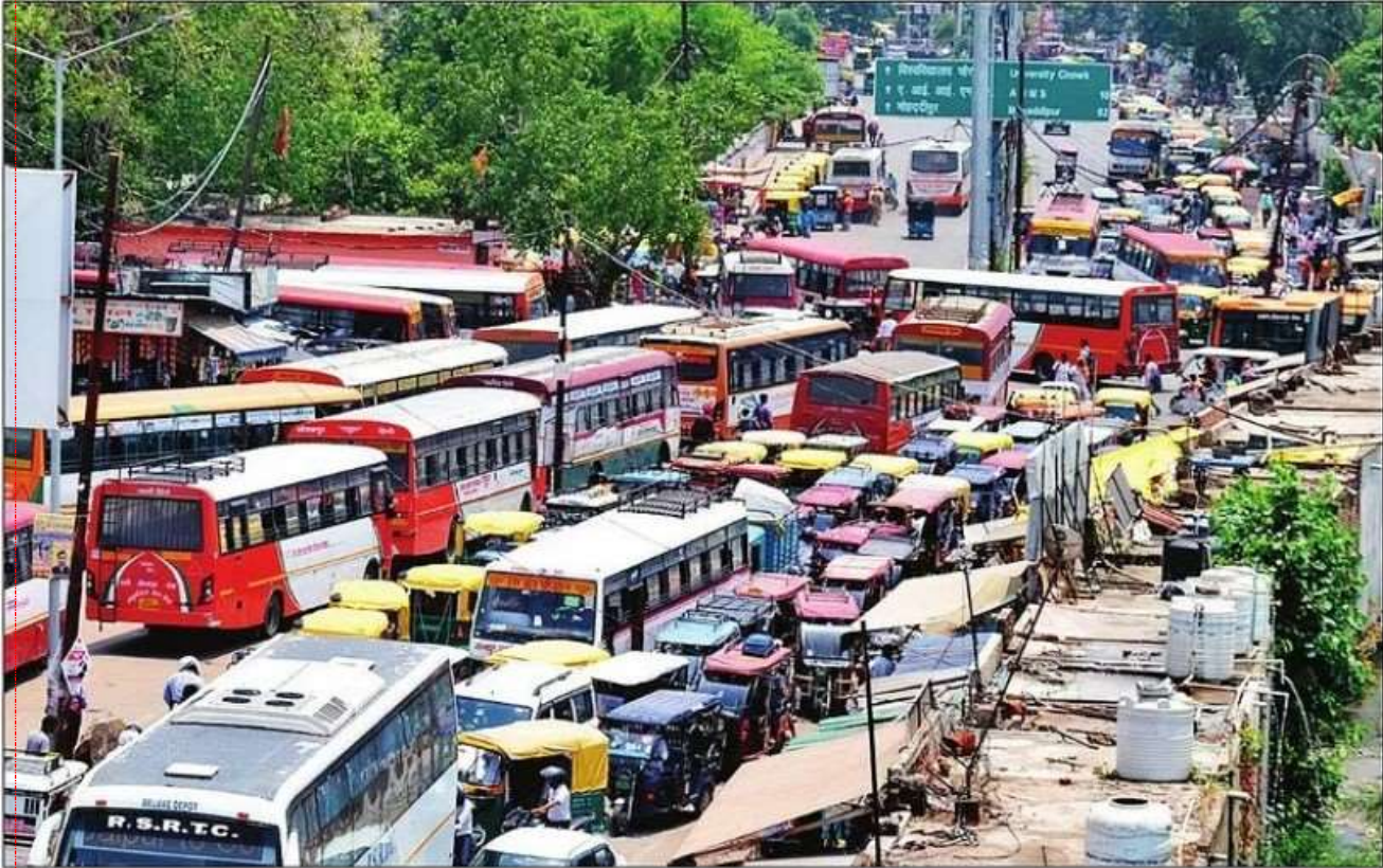
रेलवे बस स्टेशन के सामने सड़क पर खड़ी सरकारी बसों के कारण घंटों लग रहा जाम।