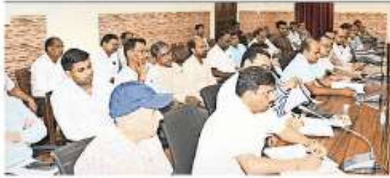
बैठक में उपस्थित अधिकारी • जामरंग

• नौ को दो पालियों में परीक्षा होगी बनाए गए हैं 15 केंद्र