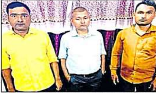
गुरुवार देर शाम खरगपुर में एंटी करप्शन टीम के हथे चढ़े जेई और दो संचिका कर्मी।