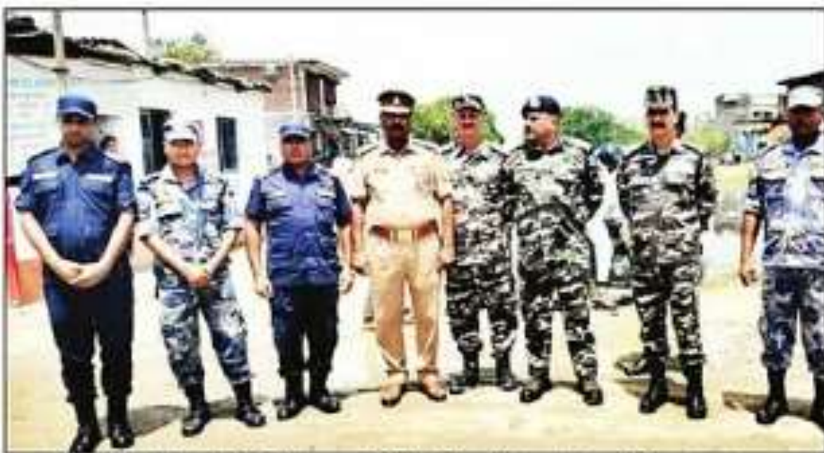
सीमाई गांवों व बॉर्डर में एसएसबी ने पुलिस के साथ मार्च किया। संवाद

के लिए कहा है। इससे युवाओं की उम्मीद और बढ़ गई है।