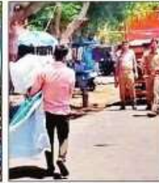
पुलिस ने उतरवाया विवादित पोस्टर। संवाद