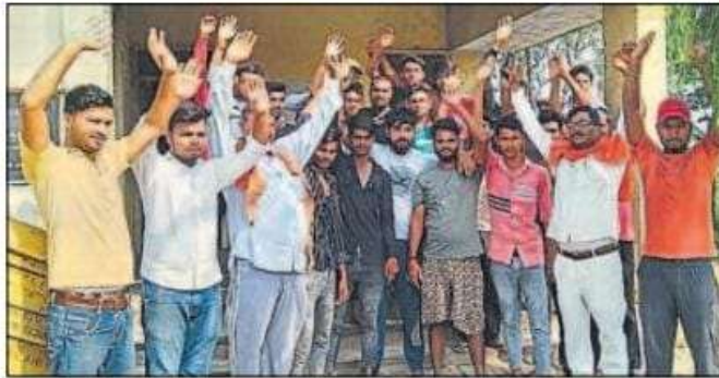
जरार उपकेंद्र पर प्रधान के नेतृत्व में विरोध प्रदर्शन करते ग्रामीण।

विशुनपुरा विकास खंड के गांव माघी कोठिलवा व विशुनपुरा बुजुर्ग गांव को जरार विद्युत सब स्टेशन से बिजली सप्लाई होती है। एक सप्ताह पूर्व भीषण चक्रवात में बिजली के तार