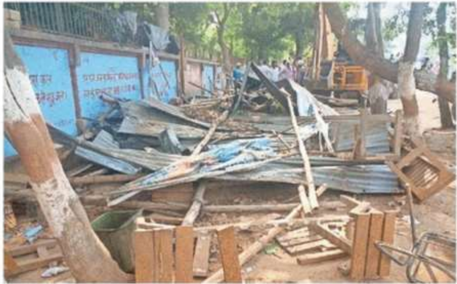
जेसीबी से तोड़ी गई दुकान • जागरण

बगल कई अन्य दुकानें अभी भी तहसील प्रशासन द्वारा इस पर कोई घड़ल्ले से संचालित हो रही हैं। कार्रवाई नहीं की गई है।