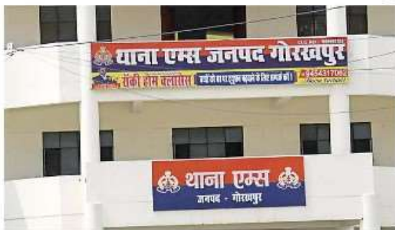
एम्स थाना पर चरपा हुआ कोचिंग संस्थान का नाम • जगरण

गोरखपुर : थाने के बाहर और अंदर लगे बोर्ड को देखकर पता ही नहीं चलता कि यह स्कूल, हास्पिटल, कोचिंग सेंटर का कार्यालय या थाना है। गोरखपुर समेत जोन के अधिकांश जिलों में यही स्थिति है। हर थाने, चौकी के प्रवेश द्वार पर प्रायोजकों के सौजन्य से बोर्ड लगवाया गया है। कहीं-कहीं बोर्ड इतने बड़े हैं कि उसमें प्रायोजक का नाम बड़ा और थाने का नाम छोटा लिखा है। संवेदनशील सरकारी संस्थान के बोर्ड पर लगे इस प्रकार के विज्ञापन निष्पक्षता पर पूरी तरह से सवाल खड़े करते हैं। यदि कोई पीड़ित व्यक्ति न्याय की गुहार लगाने के