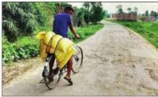
स्टाइकिल से यूरिया खाद लेकर जाता युवक। संवाद

जानकारी के मुताबिक, भारत नेपाल की सरहद पूरी तरह से खुली है। यहाँ बिना रोक-टोक के लोग इस पार से उस पार आते-जाते हैं। इस मुनिधा का दुरुपयोग तस्कर पहले से करते चले आ रहे हैं। ये भारत और नेपाल में डिमांड और बस्तु की कमी के हिसाब से तस्करी करते हैं। मौजूदा समय में सरहद पर यूरिया और कॉस्मेटिक सामानों की तस्करी बढ़ी है। सुबह और