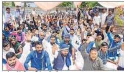
धरने पर बैठे भीम आर्मी के कार्यकर्ता