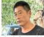
यूफेनाचो की फाइल फोटो

एटीएस को ट्रांसफर कर दी है। एटीएस विवेचना में इसकी जांच कर रही है कि चीन के जासूस यूफेनाचो का भारत आने का उद्देश्य क्या था। वह पहले भी वहां क्यों आता रहा है, टीम