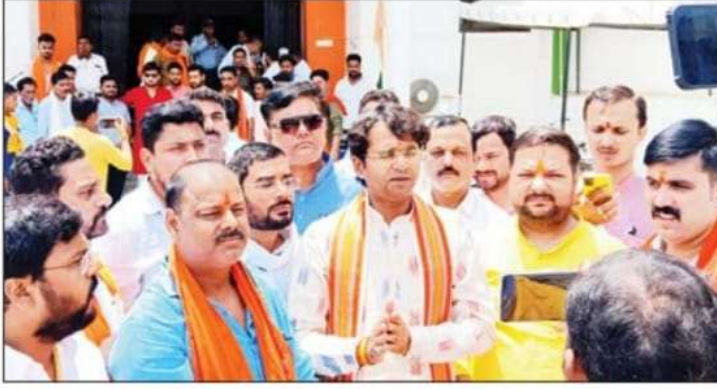
एक दूसरे को मिठाई खिलाते भाजपाई।

आने वाले पांच साल में देश नई ऊंचाइयों को छुएगा और खुशहाली और समृद्धि आएगी। इस बार के चुनाव में एनडीए को 293 सीटों पर जीत मिली है। इससे तय हो गया है कि केंद्र में लगातार तीसरी बार भाजपा के नेतृत्व में सरकार बनने जा रही है। इस जीत से भाजपा कार्यकर्ता बेहद खुश नजर आ रहे हैं। भाजपा कार्यालय में भारत माता की जय के नारे लगे। कार्यकर्ताओं ने कहा कि नरेंद्र मोदी के नेतृत्व में भारत अपने पुराने वैभव