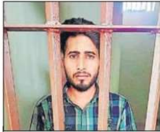
पकड़ा गया दुष्कर्म का आरोपी।