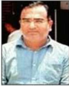
आरोपी बैंक मैनेजर।