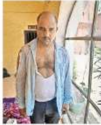
दीवानी कचहरी परिसर से पकड़ा गया चोर = गजराण

दीवानी कचहरी में सुबह नौ बजे असेंडे अपने बैग से चबो निकाल कर बाइक का लॉक खोलने का प्रयास कर रहा था। यह देख गेट पर सुरक्षा