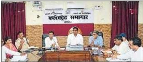
बीएड की प्रवेश परीक्षा की तैयारी को लेकर बैठक करते डीएम व एसपी।