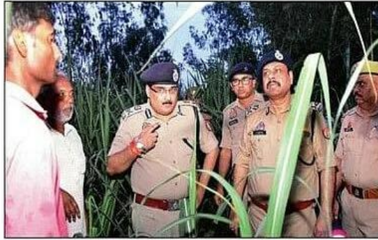
शाही में घटनास्थल पर पहुंचे एडीजी और आईजी।

अफसरों ने ग्रामीणों से छोटी-छोटी सूचनाएं पुलिस को देने के