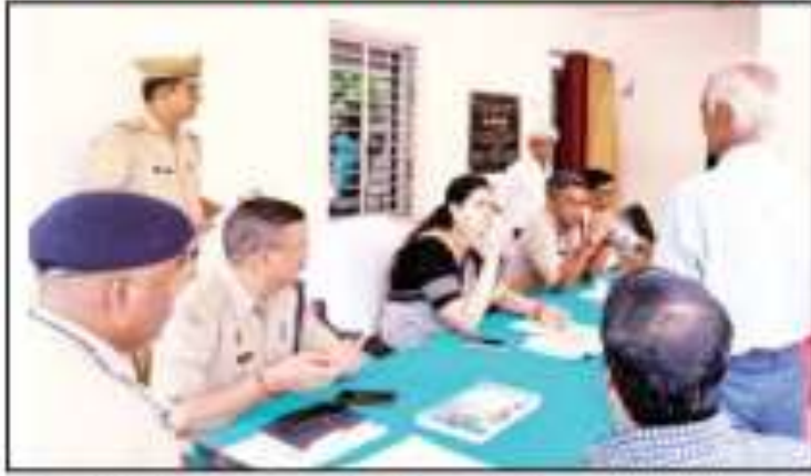
फरियादियों की समस्याओं को सुनती डीएम, साथ में एसपी।

समस्त थानों पर थाना समाधान दिवस का आयोजन किया गया। इस दौरान जनपद के समस्त थानों पर कुल 152 प्रार्थना पत्र प्राप्त हुए जिसमें 41 प्रार्थना पत्रों का निस्तारण किया गया तथा शेष प्रार्थना पत्रों के