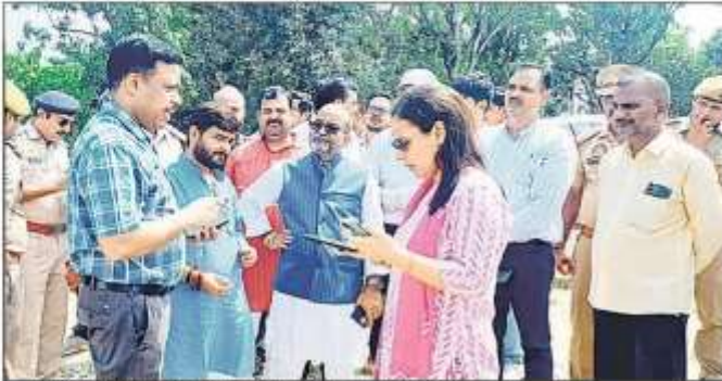
मुख्यमंत्री के आगमन की तैयारियों पर चर्चा करते विभाजक, एसपी व सीपीओ।

सीएम के खुद समीक्षा को लेकर वन विभाग के अधिकारी सकते में हैं। वे सर्च ऑपरेशन को लेकर उठाए गए कदम, तकनीक, सरकोब संग सुरक्षा को लेकर उठाए जा रहे हर कदम की समीक्षा करेंगे। ऐसे में सील सेंटेंटों के नेडल डीएफओ अपने-अपने सेंटेंट की रिपोर्ट मुखा वन संरक्षक के समक्ष शनिवार को प्रस्तुत करने में लगे रहे। तीनों सेंटेंटों की समायोजित रिपोर्ट तैयार की गई है। जिसको मुख्यमंत्री के समक्ष मुख्य वन संरक्षक रखेंगे। इसमें कब से ऑपरेशन शुरू किया गया है। कितने पीड़ितों को मदद दी जा चुकी है। हमले में कुल कितने लोग घायल हुए हैं, जैसे बिंदु शामिल किए गए हैं।