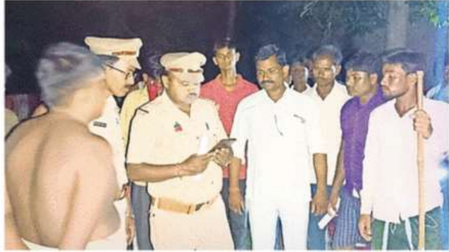
पथार रंगढारपुरवा में जंगली जानवर की सूचना पर जानकारी लेती पुलिस