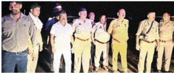
महसी के दीवान पुरवा में रात में निगरानी करते वन कर्मी व बस्ती में ड्रोन से भेड़िए की लोकेशन पता करते कर्मचारी