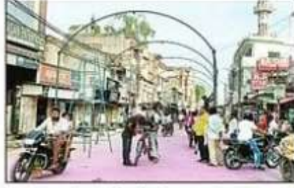
जुलूस-ए-मोहम्मदी को लेकर सजे बाजार। संवाद

मुस्लिम धर्मगुरु सैय्यद अहमद रजा कादरी के आवास पर उलेमाओं और गणमान्य लोगों की आवश्यक बैठक हुई। मुस्लिम धर्मगुरु ने बताया कि जुलूस ए मोहम्मदी के दौरान जुलूस की अगुवाई कर रहे उलेमा इस बार किसी भी अकीदतमंद