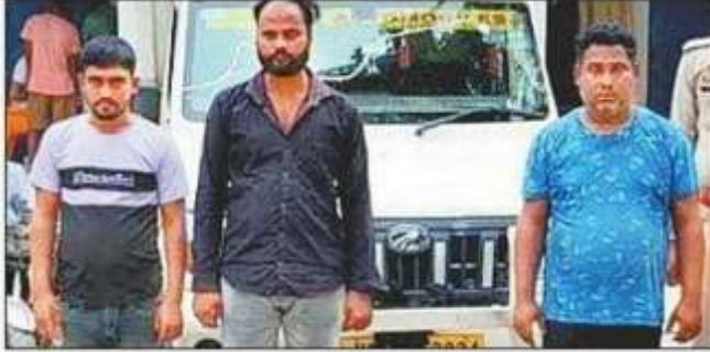
पुलिस के हत्ये चढ़े तीन गो तस्कर व जब्त पिकअप के साथ पुलिस। त्तत पुलिस

उनकी गिरफ्तारी थाना क्षेत्र के सोहनपुर-एकडंगा मार्ग पर काली माता मंदिर के पास से हुई। तीन तस्करों को न्यायालय के आदेश पर जेल भेज दिया जबकि दो बाल आपचारी को बाल सुधार गृह भेज दिया। बनकटा पुलिस को मुखबिर ने सूचना दी कि एक पिकअप पर पशुओं को लाद कर बिहार ले जाया