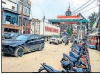
इंडो-नेपाल बॉर्डर की सोनौली सीमा।

नौतनवा कस्बे के एक व्यक्ति से किराए पर लेकर यह गोदाम दिल्ली का रहने वाला कारोबारी बनाया था। बताया जा रहा है कि दक्षिण भारत से रक्त चंदन की लकड़ियां मंगाकर नेपाली ट्रक के जरिए नेपाल की सीमा में पहुंचाया जा रहा था। वहां से रक्त चंदन