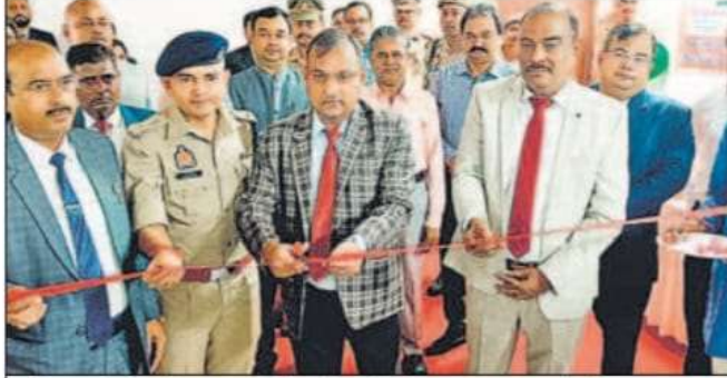
शनिवार को दीवानी न्यायालय में राष्ट्रीय लोक अदालत का शुभारंभ जिला जज नीरज कुमार ने किया। • हिन्दुस्तान

राष्ट्रीय लोक अदालत में जिला जज ने 56 वादों का निस्तारण किया गया। पीठासीन अधिकारी, मोटर दुर्घटना प्रतिकर न्यायाधीकरण द्वारा 48 वादों का निस्तारण कर 3,06,55000 रूपये का क्षतिपूर्ति दिलवाया। प्रधान न्यायाधीश, परिवार कोर्ट द्वारा 26