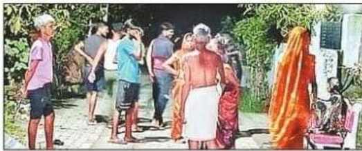
सुकरौली में चोरी के डर से रात में निगरानी करते ग्रामीण। सोल-ग्रामीण

कुबेरस्थान थाना क्षेत्र के एक गांव में देर रात रिश्तेदारी में आए युवक को लोगों ने चोर समझ लिया और उसकी पिटाई कर दी। लोगों का कहना है कि दिन के वकत रेकी करने के बाद रात के समय चोरी की घटनाओं को अंजाम दिया जा रहा है। वहीं, पुलिस