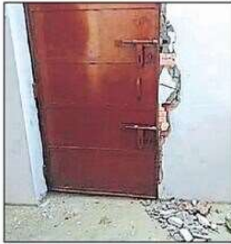
कठेला कोठी चौराहे पर ज्वेलरी की दुकान के पीछे का टूटा दरवाजा (बाएं)। ज्वेलरी की दुकान में टूटी पड़ी आलमारी। • हिन्दुस्तान