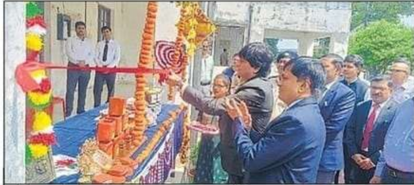
शनिवार को लोक अदालत का उद्घाटन करते जिला जज।