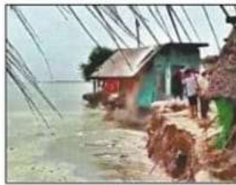
मदरहवा पुरवा में कटान से सरयू में विलीन होता मकान। संवाद