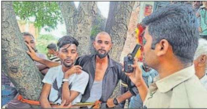
पेड़ में बांधे गए छेड़खानी करने के आरोपी।

शनिवार को दिन में करीब तीन बजे सोहंग स्थित एक इंटर कॉलेज में पढ़ रही दो छात्राएं विद्यालय से पढ़कर गौराखोर गांव के बगीचे के