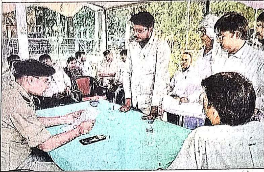
बखिरा थाने में आयोजित समाधान दिवस में फरियादियों की समस्या सुनते एसपी।