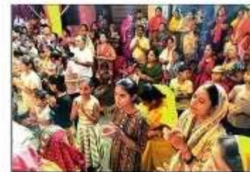
बहिराज मोहल्ला में गणेश आरती में शामिल अट्टाला। संवाद

बहराइच। जिले में गणेश महोत्सव को धूम है। शहर के खसीपुर, भां संधारिणी देवी मंदिर के पास, ब्रह्मणीपुर व लखनऊ रोड समेत अनेक स्थानों पर भगवान गणेश की प्रतिमा स्थापित कर पूजन-अर्चन किया जा रहा है। पंडारलों में गीता- घर में पधारो गजानन जी... व गणपती जयमा मेरख... नूज रहे हैं। लोग परिवार समेत पंडारलों में बच्चा का दर्शन-पूजन करने के लिए पहुंच रहे हैं। (संवाद)