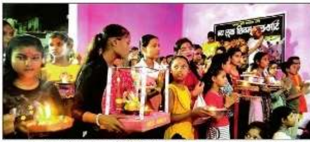
भव्यात भवन में आयोजित आरती धाल प्रतियोगिता में मौजूद श्रद्धिवां अपनी आरती धाल के साथ। संवाद

दिलवाली ने श्री गणेश महिमा का गुणगान किया। इसी क्रम में तुलसीपुर, इकोना, कटुनाडा, शिवरिया रहित अन्य स्थानों पर श्री गणेश पूजा महोत्सव के दौरान विभिन्न कार्यक्रम आयोजित हुए।