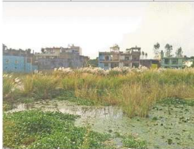
नगर से सटे खमौवा विशुनापुर स्थित सुआंव नाला की भूमि पर बने भवन

नाले उफान मारते हैं, तो सुआंव भी पानी से लबालब हो जाता है। शहर से लेकर गांवों तक जगह-जगह कब्जा होने से नाले का अस्तित्व सिकुड़ गया है। 120 किलोमीटर लंबाई में जिले में चांदे ताल के पास राप्ती नदी से सटकर बहने वाली सुआंव का जिले में आखिरी पड़ाव