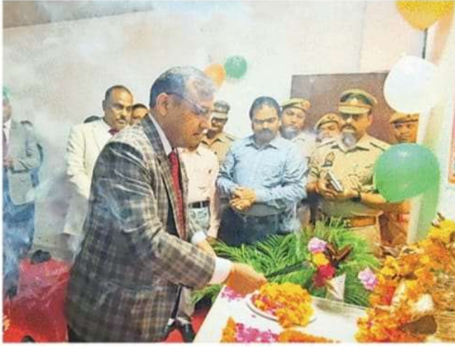
राष्ट्रीय लोक अदालत का शुभारंभ करते जिला जज नीरज कुमार व उपस्थित अन्य न्यायिक अधिकारी ● जागरण

● विभिन्न बैंकों के 13.63 करोड़ रुपये की हुई नकद वसूली, तीन करोड़ का दिलाया गया प्रतिकर