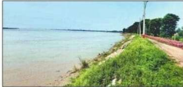
बाढ़ से घिरा सुबिका बाबू गांव। संवाद

पानी से घिर गया सुबिका बाबू गांव : दुबौलिया संवाद के अनुसार, सरयू का जलस्तर बढ़ने से सुबिका बाबू गांव एक बार फिर से बाढ़ के पानी से घिर चुका है। तटबंध और नदी के पास बसे इस गांव के अलावा आंशिक टेढ़वा भी बाढ़ के पानी से घिर गया है। यहां के लोगों में दहशत है। जलस्तर बढ़ने से कटरिया-चांदपुर तटबंध पर