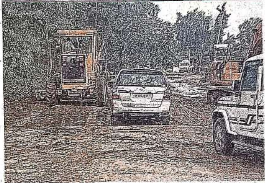
मड़पौना के पास बद्दहाल स्थिति में रामजानकी मार्ग ● जागरण

● चौड़ीकरण कार्य के दौरान भूमि अधिग्रहण की स्थिति साफ न होने से यहां नहीं बन पाई थी सड़क