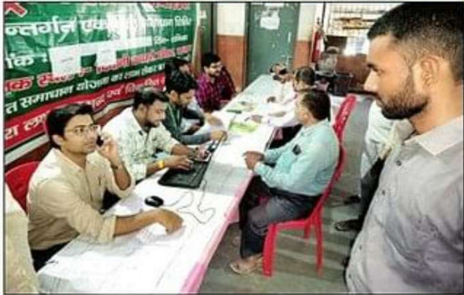
दीवानी कचहरी परिसर में लगी राष्ट्रीय लोक अदालत।