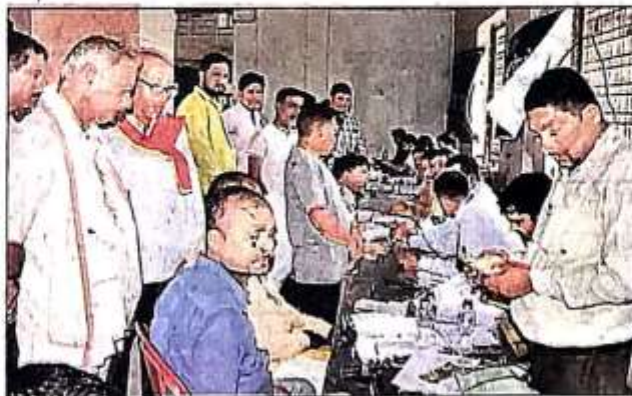
दीवानी न्यायालय परिसर में आयोजित लोक अदालत में वादों का निस्तारण करते बैंककर्मी।