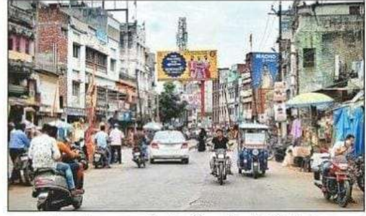
महायोजना के तहत मालवीय रोड की 24 मीटर होनी है चौड़ाई। संवाद