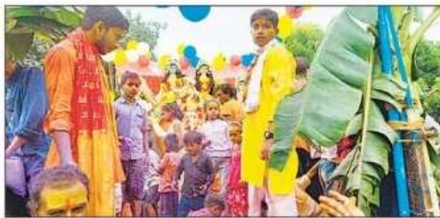
भिठिया चिचड़ी में गणपति विसर्जन को जाते लोग

गिरंट बाजार, रतनापुर, संवाददाता। गणपति बप्पा मोरया, अगले बरस तू जल्दी आ.. के मनमोहक गीतों के बीच मंगलवार को गणपति बप्पा की प्रतिमाओं को धूमधाम विसर्जित किया गया। प्रथम पूज्य भगवान श्रीगणेश के भक्ति भाव में भक्त सराबोर नजर आए। इस मौके पर निकाली गई शोभायात्रा के दौरान बप्पा के जयघोष से सड़कें गुंजायमान होती रही। हरदत्त नगर गिरंट थाना क्षेत्र में टोड़ी समय माता मंदिर, गावट माता मंदिर केवटनपुरवा, गबडू बाबा स्थान बरगदही, समय माता मंदिर जयपत्तपुरवा, गौसपुर व सोनवा के नासिरगंज में पंडालों में स्थापित