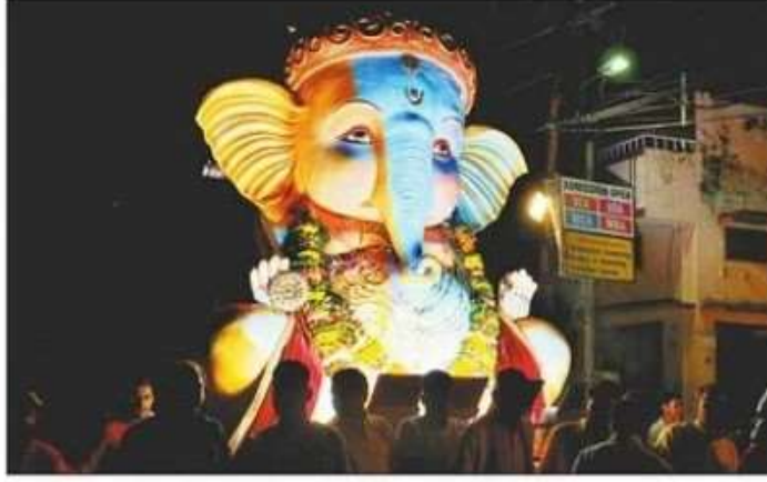
विसर्जन के लिए ले जाई जा रही गणेश प्रतिमा। संवाद

श्रद्धालुओं ने अनंत चतुर्दशी का व्रत रहकर भगवान विष्णु व गणेश की उपासना की। लोगों ने दस दिनों तक चलने वाले गणेशोत्सव के अंतिम दिन पंडालों व घरों में हवन-पूजन कर पूर्णहुति की। शहर के कच्चीबाग, पांडेयहाता, मिर्जापुर, घासीकटरा, बक्शौपुर, धर्मशाला, जलकल भवन आदि जगहों से देर शाम समितियों द्वारा भगवान गणेश की आरती कर भव्य शोभा यात्रा निकाली गई। रास्ते