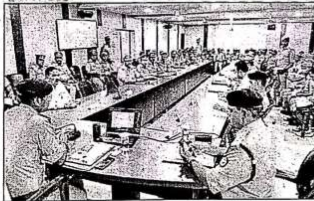
पुलिस लाइन्स स्थित सभागार में क्षेत्राधिकारियों, थाना प्रभारियों व अन्य अधिकारियों/कर्मचारियों को संबोधित करते एसपी