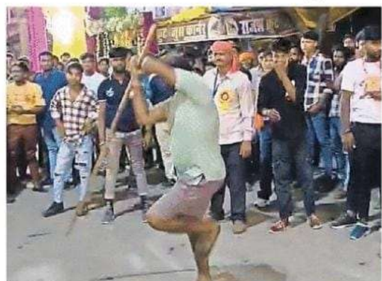
डोल मेला में करतब दिखाता कलाकार • जाळण