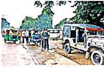
पीएसी लाइन के सामने संगठित टेक्सो स्टैंड • जायगरण

संसू जायगरण • गोंडा : नगर पालिका परिषद गोंडा में टेक्सो स्टैंड के लिए टेकेदार ढूँढे नहीं मिल रहे हैं। वित्तीय वर्ष 2024-25 में साढ़े पांच माह के भीतर नगर पालिका परिषद ने टेक्सो स्टैंड आवंटन के लिए छह बार आन्तःस्थान नियिदा निकाली, लेकिन कोई भी टेकेदार नियिदा डालने नहीं आया। पाँच बार नियिदा आमंत्रित करने के बाद टेपो स्टैंड का ठेका अगस्त में 14.50 लाख रुपये में हुआ था। ऐसे में नगर पालिका परिषद को आर्थिक संकट का सामना करना पड़ रहा है। कोरोना संक्रमण से पूर्व टेपो व टेक्सो स्टैंड का ठेका औसतन एक करोड़ रुपये में होता था। पालिका आर्थिक से जुड़ रही है। कर्मचारी वेतन भुगतान के लिए तरस रहे हैं।