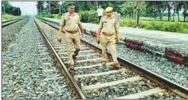
नोनापार में ट्रैक का निरीक्षण करते जीआरपी जवान।

भटनी थाना क्षेत्र के नोनापार रेलवे स्टेशन के पास सोमवार सुबह करीब दस मीटर तक ट्रैक पर पत्थर रखे जाने की घटना के बाद रेलवे प्रशासन और सुरक्षा एजेंसियां सतर्क हो गई हैं। रेलवे सुरक्षा बल और जीआरपी ने मंगलवार