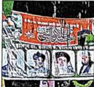
मेंहदावल के हस्दी हट्टा मोहल्ले में लगा पोस्टर।

मेंहदावल (संतकेबीरनगर)। कस्बे के एक मोहल्ले में बारावफात के दिन बैनर पर दो पाकिस्तानी मौलाना की तस्वीर लगाने के मामले में पुलिस ने तीन आरोपियों के खिलाफ केस दर्ज किया है। इनमें एक आरोपी नाबालिग है। पुलिस ने नाबालिग आरोपी को बाल सुधार गृह और दो अन्य आरोपियों को जेल भेज दिया है।