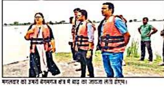
मालवा क्षेत्र में उफान से घाघरा नदी में बाढ़ का जलजल लगी है।

झरिया बंगला, संवाददाता। पीडी बंधे पर बढ़ा दबाव, दर्जनों मजदूरों घिरे। घाघरा और सरयू नदी के उफान से नवलपरास क्षेत्र के प्रभाव से अलग-अलग क्षेत्रों में बाढ़ फैल गई। दुलमपुर गांव के निकट पानी के तल पर नलगा का किला बनने पर डूबने का खतरा संभव है। घाघरा और सरयू नदी के उफान से नवलपरास क्षेत्र के प्रभाव से अलग-अलग क्षेत्रों में बाढ़ फैल गई।