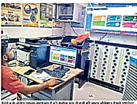
रोडवेज के क्षेत्रीय प्रबंधक कार्यालय में बने कंट्रोल रूम से बसों की लाइव लोकेशन देखते हुए आरेख निरूपण • जयका

नया जमाना • गौड़ा : ट्रेनों की तर्ज पर ही अब यात्री रोडवेज बसों की भी लाइव लोकेशन देख सकेंगे। कौन कौन से बसें होंगी, उनके स्टोपों पर पहुंचने में श्रुतमानित कितना समय लगेगा? इन सब सवालों के जवाब उन्हें अपने मोबाइल और रोडवेज बस स्टैंड पर लगे डिस्प्ले बोर्ड एप्लेटो (लाइव एप्लेटिंग छोड) पर मिल जाएंगे। इस व्यवस्था के लागू होने में यात्रियों को आनन्दान टिकट भी मिल सकेंगे। अब तक रोडवेज बस स्टेशन के हटकर बसों पर बैठे कर्मियों बसों के आने को नहीं समझ पाते थे। शरण, हलके की बस कहां पहुंचे, इसकी जानकारी उन्हें खुद नहीं रहती थी। जरूरी होने पर वह चालक-परिचालक को बोल सकते थे, लेकिन जवाब नहीं मिलता था। इसे देखते हुए अब गौड़ा समेत प्रदेश के 100 बस अड्डों पर एप्लेटो डिस्प्ले इनल लगाया गया है। साथ ही लाइव