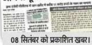
08 सितंबर को प्रकाशित खबर।

धान खरीद में गबन : जांच की आंच से दूर है परिवहन ठेकेदार