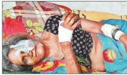
सियार के हमले से घायल महिला।