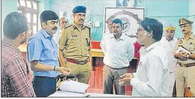
तहसीलदार बांसी न्यायालय में निरीक्षण करते कमिश्नर, आईजी और डीएम।