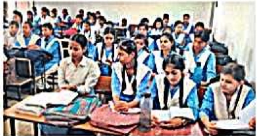
राजकीय बालिका इंटर कॉलेज में पढ़ाई करती छात्राएं

जिले के 2609 परिपक्व विद्यालयों में वर्तमान में तीन लाख 726 विद्यार्थी पंजीकृत हैं। इनमें छात्रों (बालक) की संख्या एक लाख 45 हजार 313 है, जबकि छात्राओं (बालिका) की संख्या एक लाख 55 हजार 413 है। ऐसे में बेटों से 10 हजार से अधिक बेटियां शिक्षा ग्रहण कर रही हैं। इनके अलावा 17 बेटियां कस्तूरबा गांधी आवासीय बालिका विद्यालय में भी शिक्षा ग्रहण कर रही हैं। वहीं, राजकीय बालिका इंटर कॉलेज में छात्राओं की संख्या दो हजार से अधिक है, जबकि राजकीय