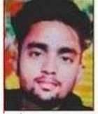
चंदन फाइन फोटो

रुद्रपुर। क्षेत्र के अमौनी खास गांव के रहने वाले एक युवक को सोमवार देर रात सिर कूच कर हत्या कर दी गई। मंगलवार सुबह उसकी लाश मटियारी गांव के प्राथमिक स्कूल के