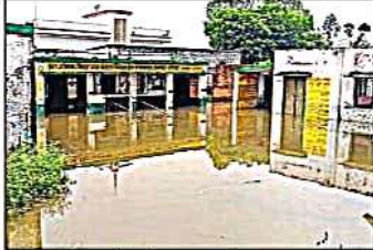
नवलपरास क्षेत्र में सूखे पारिवार में भरा बाढ़ का पानी।

घाघरा, संवाददाता। घाघरा और सरयू में आने वाले बाढ़ के बाद नवलपरास क्षेत्र के अग्रणी माझा गांव के दो युवकों का यह संस्कार की दुहाई मचाने के बाद के निकट बाढ़ के पानी में डूब गए। वहीं, दुलमपुर गांव के निकट पानी के तल पर नलगा का किला बनने पर डूबने का खतरा संभव है। घाघरा और सरयू नदी के उफान से नवलपरास क्षेत्र के प्रभाव से अलग-अलग क्षेत्रों में बाढ़ फैल गई। दुलमपुर गांव के निकट पानी के तल पर नलगा का किला बनने पर डूबने का खतरा संभव है। घाघरा और सरयू नदी के उफान से नवलपरास क्षेत्र के प्रभाव से अलग-अलग क्षेत्रों में बाढ़ फैल गई।