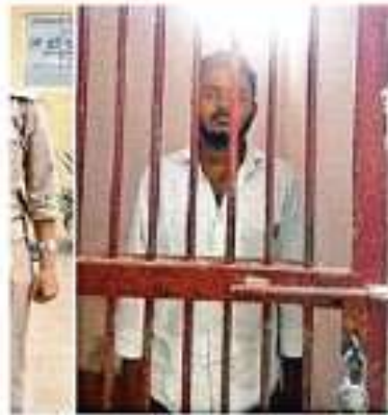
पुलिस की गिरफ्त में हत्यारोपित •