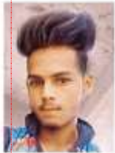
आजाद फाइल फोटो •

बादव सिहाइजपार के एक निजी स्कूल में शिक्षक हैं। सोमवार की शाम साढ़े छह बजे वह स्कूल से लौट रहे थे। गांव से पहले बाइक खड़ी कर खेत की तरफ गए। उसी दौरान दो बाइक सवार चार युवक आए और उनकी बाइक लेकर राउतपार की तरफ बाइक लेकर फरार हो गए।