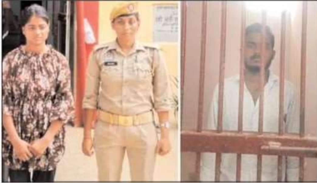
खोराबार में गिरफ्तार आरोपी