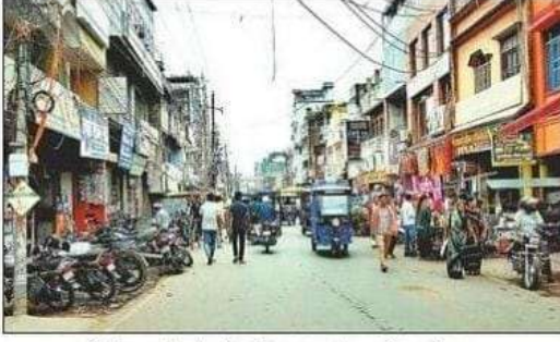
मोतीलाल रोड के लोग विस्थापना के डर से सहमे।