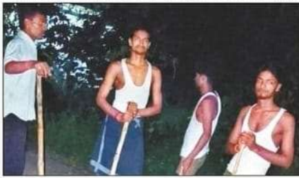
जानवरों के भय से पहरे देते त्रिलोकपुर के लोग। संवाद

बस्ती। बीते 10 दिनों में जिले के अलग-अलग क्षेत्रों में भेड़िया जैसे दिखने वाले जानवर के हमले के कई मामले सामने आ चुके हैं। नगर पंचायत रुघौली के दो वार्डों के कुछ लोगों को सोमवार की रात हिंसक जानवर ने घायल कर दिया। ग्रामीणों ने रात में ही खेतों से दौड़कर एक जानवर को मार डाला, जिसे सियार बताया जा रहा है। खोफजदा लोग गांव में 24 घंटे पहरे दे रहे हैं। बच्चे भी सिवान की तरफ लाठी-डंडा लेकर जा रहे हैं।