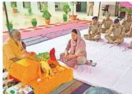
बहराइच पुलिस लाइन में विश्वकर्मा पूजा करती एसबी तुंद शुवाल • जयपुरा