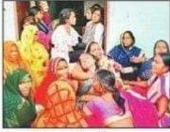
रोते बिलखते परिजन।