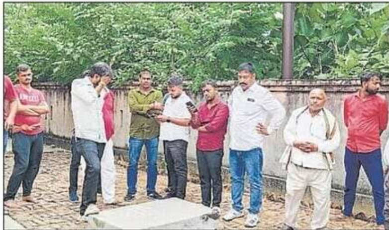
मंगलवार को पोस्टमार्टम हाउस पर जुटे लोग।