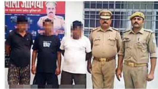
अंग्रेज पुलिस के अभिरक्षा में शराब का रोवारी •