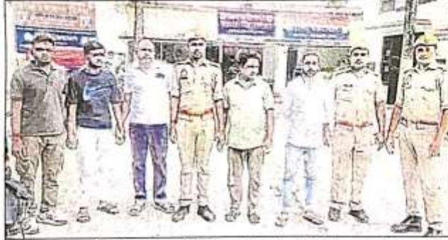
मेंहदावल पुलिस की गिरफ्त में आए ईद मिलादुन्नवी पर देश विरोधी बैनर लगाने के आरोपित।

कस्बे के हरदीहट्टा मोहल्ले में बीते सोमवार को बारावफात त्योहार के दिन एक बैनर लगाया गया था। आरोप है कि बैनर में भारत के खिलाफ भड़काऊ बयान देने वाले दो पाकिस्तानी नागरिकों के फोटो पोस्टर में लगे हुए थे। पोस्टर को मोहल्ले के रहने वाले कुछ युवाओं