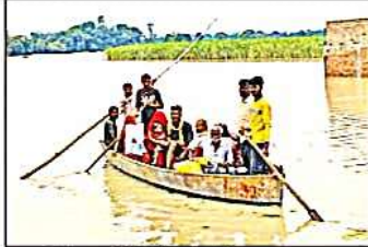
नवलपरास क्षेत्र में बाढ़ में डूबे हुए गांवों में राहत के लिए लोग।

नवलपरास क्षेत्र में सूखे पारिवार में भरा बाढ़ का पानी। घाघरा और सरयू नदी के उफान से नवलपरास क्षेत्र के प्रभाव से अलग-अलग क्षेत्रों में बाढ़ फैल गई। दुलमपुर गांव के निकट पानी के तल पर नलगा का किला बनने पर डूबने का खतरा संभव है। घाघरा और सरयू नदी के उफान से नवलपरास क्षेत्र के प्रभाव से अलग-अलग क्षेत्रों में बाढ़ फैल गई।