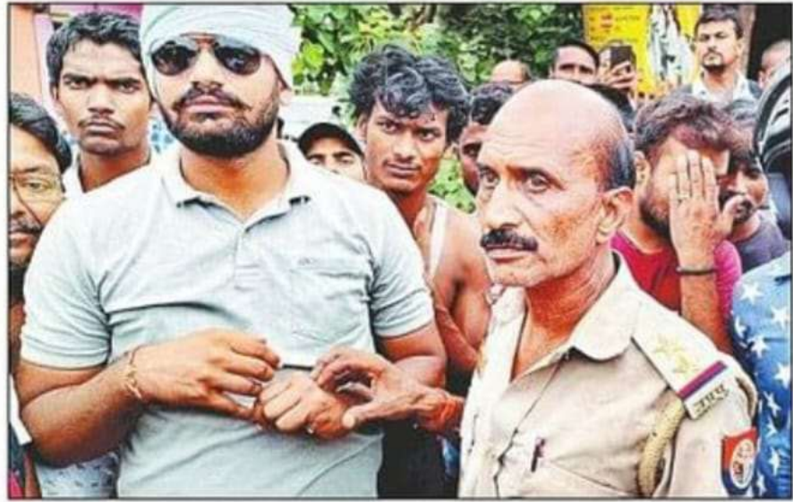
फरेंदा कस्बे में वसूली करते पकड़ा गया फर्जी दरोगा। संवाद

जानकारी के अनुसार, मंगलवार सुबह करीब आठ बजे फरेंदा क्षेत्र के धानी ढाला पर पुलिस की वर्दी में एक व्यक्ति टेंपो और कुछ अन्य लोगों से वसूली कर रहा था। रुपये न देने पर लोगों को धमकी भी दे रहा था। वह पुलिस की वर्दी में हवाई चप्पल पहने हुए था। यह देख स्थानीय लोगों को शक हुआ। इस पर कुछ युवकों ने उससे पूछताछ शुरू की तो वह हिचकिचाने लगा। उसने बताया कि वह फायर विभाग