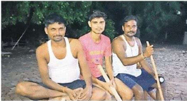
बनवीरा में चोरों के दहशत से घर के बाहर लाठी-डंडा लेकर फहरा देते लोग • जागरण

गांव के बाहर रात में आने-जाने वाले लोगों पर ग्रामीण निगरानी भी रख रहे हैं। चौराखास व तुर्कपट्टी के गांवों में चोरी की घटनाओं का शोर अभी थमा भी नहीं कि अब पटहेरवा के कई गांवों में ग्रामीण चोरों से भयभीत दिख रहे हैं। बनवीरा में रात में एकाएक शोर मचा कि चोरों का एक गिरोह गांव में घुस गया है। पूरी रात चोरों की भय से ग्रामीण फहरा देते रहे। ग्रामीणों का