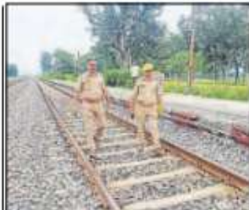
पटरी पर गश्त करती जीआरपी टीम।

भटनी, हिन्दुस्तान संवाद। नोनापार रेलवे स्टेशन के पास सोमवार की सुबह रेल पटरी पर करीब दस मीटर तक ईट और पत्थर बिछाए जाने की घटना ने रेलवे प्रशासन और सुरक्षा विभाग को सतर्क कर दिया। मंगलवार को आरपीएफ और जीआरपी की टीम ने रेल पटरी का निरीक्षण किया।