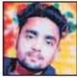
चन्दन (फाइल फोटो)