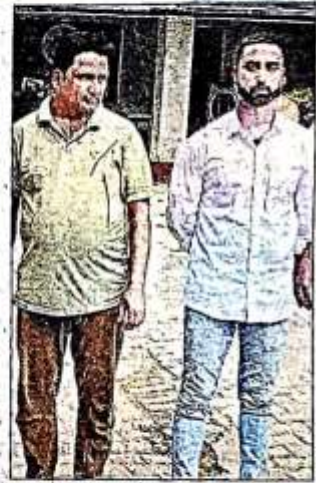
पकड़े गए दो आरोपी।

खतरे में डालने के उद्देश्य से लगाया गया है। पुलिस ने तीनों आरोपियों पर धार्मिक भावनाओं को ठेस पहुंचाने, देश विरोधी कार्य करने सहित अन्य