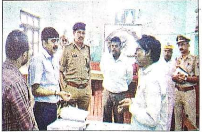
तहसीलदार न्यायालय में निरीक्षण करते कमिश्नर, आईजी व डीएम।

जिलाधिकारी द्वारा रामलीला मैदान का निरीक्षण चंद दिनों पूर्व ही किया गया था। तीनों अधिकारियों के अचानक पहुंचने से तहसील परिसर में हड़कम्प का माहौल था। जिलाधिकारी के दोबारा रामलीला मैदान पहुंचने को लेकर तरह-तरह के कयास लगाए जा रहे हैं।