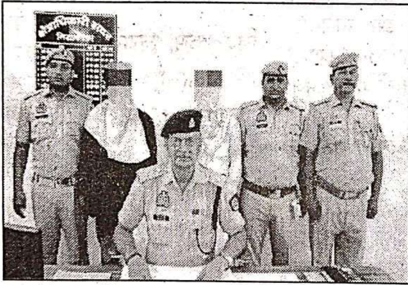
पकड़े गए अभियुक्त।