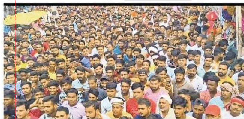
समउर बाजार स्थित डोल मेला में उमड़ी लोगों की भीड़ • जाळण

पुरस्कार वितरण के साथ हुआ मेले का समापन, सुरक्षा व्यवस्था के लिए चप्पे-चप्पे पर तैनात रही पुलिस