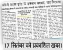
17 सितंबर को प्रकाशित खबर।

मुख्यालय पर चल रही थी फैक्टरी : जनपद मुख्यालय से महानगरी गांव की दूरी कम्युनिकल दो