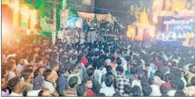
समउर बाजार डोल मेला में उमड़ी भीड़।