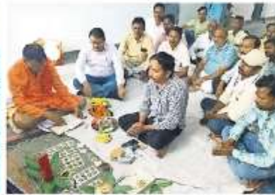
अस्पताल चौराहा स्थित अवीक्षण अभियंता कार्यालय पर विश्वकर्मा पूजन करते अधिकारी व कर्मचारी • जयपुरा