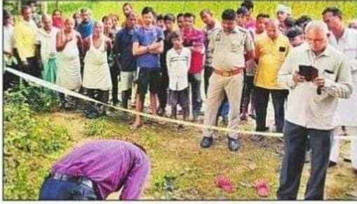
लाश वाली जगह पर जांच पर करती फॉरेंसिक टीम।