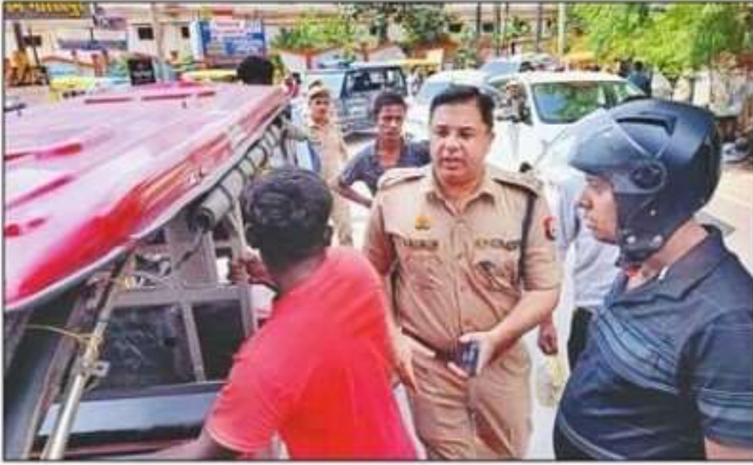
ई-रिक्शा पलटने के बाद मौके पर पहुंचे एसएसपी।