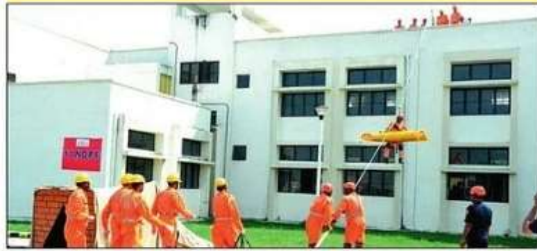
अग्निकांड की घटना से बचाव का अभ्यास करते एनडीआरएफ जवान।