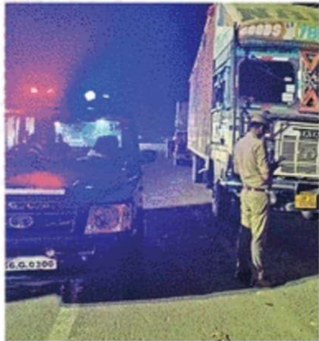
फरेंदा कस्बे में मालवाहक ट्रकों की जांच करती पुलिस ● जागरण

चाहिए। ओवर स्पीडिंग न करने, वाहन चलाते समय मोबाइल व ईयर फोन प्रयोग न करने और नशे में वाहन नहीं चलाना चाहिए।