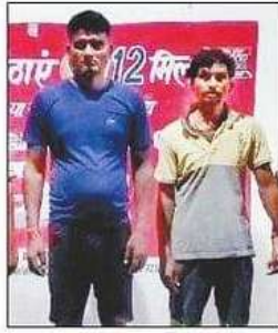
अपहरण के मामले में गिरफ्तार दो आरोपी।