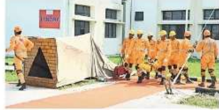
केंद्रीय विद्यालय बिनगा में भूकंप, अग्निशंभु व बहुमंजिला भवन से रस्सयू का पूर्वाभ्यास करते एनडीआरएफ जवान • जाबरा