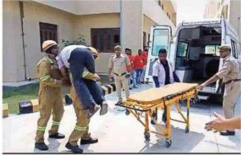
महर्षि देवरहा बाबा मेडिकल कालेज में माकड्रिल करते अग्निशमन विभाग व स्वास्थ्य विभाग के कर्मचारी