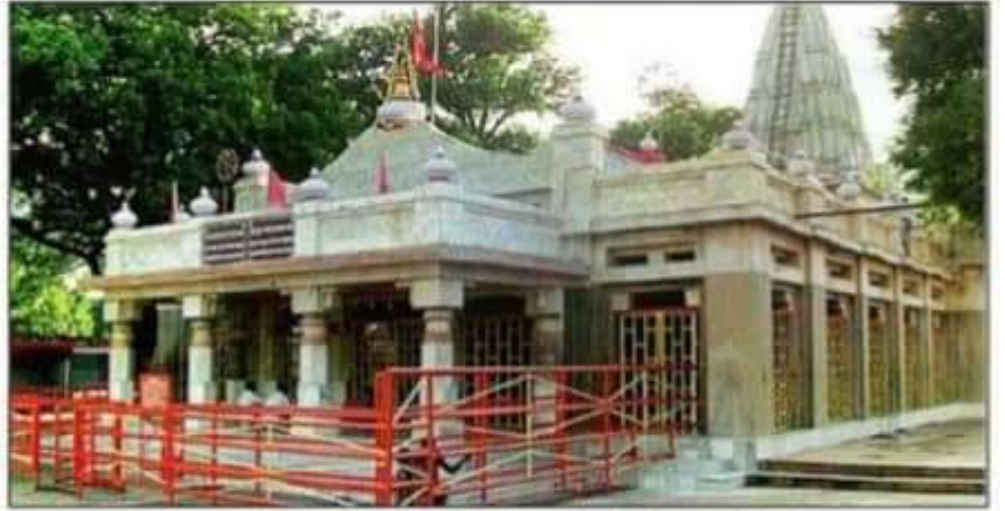
बलरामपुर के तुलसीपुर में स्थित शक्तिपीठ देवीपाटन मंदिर।

बलरामपुर। भारत-नेपाल सीमा के निकट तुलसीपुर में स्थित देवीपाटन मंदिर देवी सती के 51 शक्तिपीठों में से एक है। यह मंदिर शक्तिपीठ होने के साथ-साथ योग साधना का भी प्रमुख स्थल है। शारदीय नवरात्र में मां पाटेश्वरी की पूजा-अर्चना के लिए यहां पर श्रद्धालुओं की भारी भीड़ जुटती है। मेले में श्रद्धालुओं के लिए सुरक्षा के पुख्ता इंतजाम किए गए हैं। सीसीटीवी कैमरे से भी परिसर की नगरानी की जाएगी।