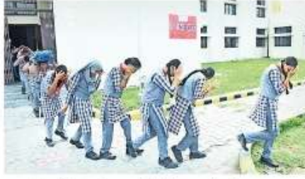
आपदा से निपटने के लिए पूर्वाभ्यास करती केंद्रीय विद्यालय की छात्राएं • जाबरा

जिला अध्यक्ष, डीएम व एसपी ने पूर्वाभ्यास में शामिल सभी प्रतिभागियों से व्यवस्थित मूलांकन कर उनसे परिचय प्राप्त किया और उत्साहवर्धन किया। इसमें विभिन्न विभागों से संबंधित अधिकारी, छात्र-छात्राएं व माकडिल करने वाले प्रतिभागी शामिल थे। एनडीआरएफ की टीम ने बहुमंजिला भवन में फंसे एक बच्चे व एक नागरिक को सफुशल वाहर निचालने की क्षमता का प्रदर्शन किया। दूसरी ओर पूर्वाभ्यास में एसपी