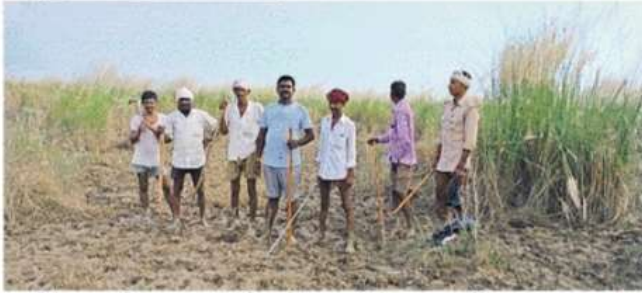
महसी के घाघरा स्थित कच्छर में भेड़िए की तलाश में मौजूद वन कर्मी