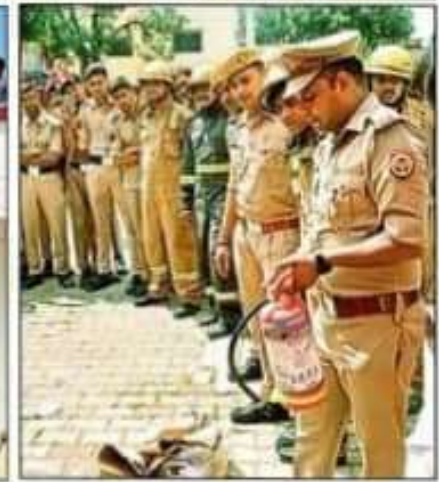
बलरामपुर के संयुक्त जिला चिकित्सालय में बचाव का मॉकड्रिल करते कर्मी व अस्पताल में कर्मचारियों को बचाव के टिप्स देते अग्निशमन विभाग के अधिकारी।