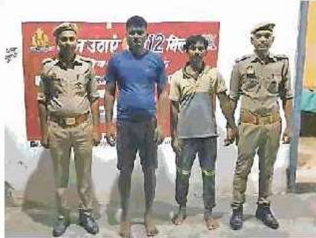
पुलिस की गिरफ्त में आरोपित ● जागरण

● पुलिस ने 10 घंटे में किया बरामद, दो आरोपित गिरफ्तार