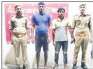
देवरिया-गिरफ्तार मासूम बच्चे के अपहरणकर्ता।