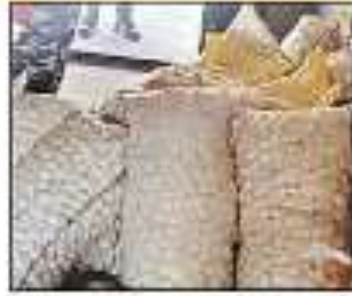
छापे में बरामद लहसुन का लालगी

मंडलीय समीक्षा बैठक में कमिश्नर ने दिया जिम्मेदारों को निर्देश