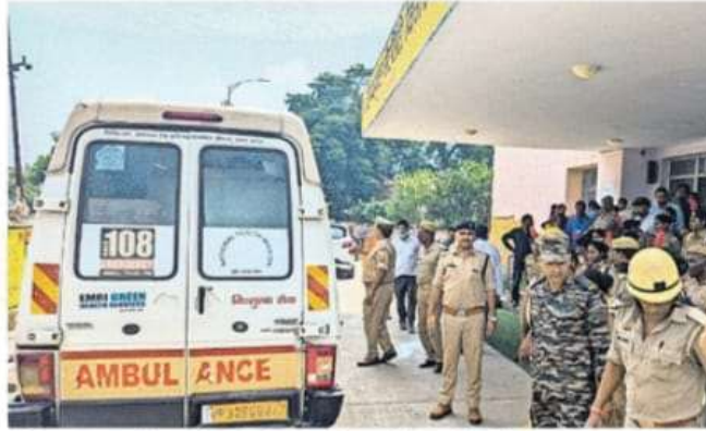
महिला अस्पताल में मॉक ड्रिल के दौरान उपस्थित पुलिस कर्मी व भीड़