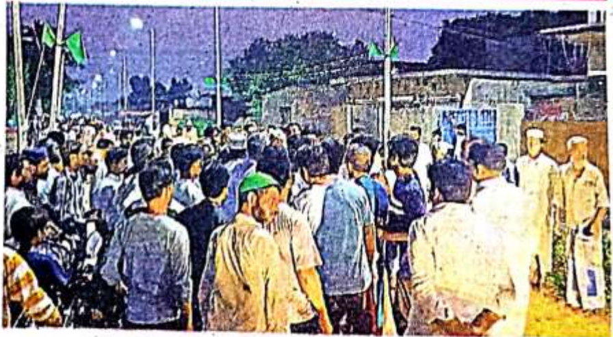
तरकुलवा गांव में आपत्तिजनक टिप्पणी पर विरोध जताते लोग • जागरण

• बखिरा पुलिस ने आक्रोशित लोगों को समझा-बुझाकर किया शांत