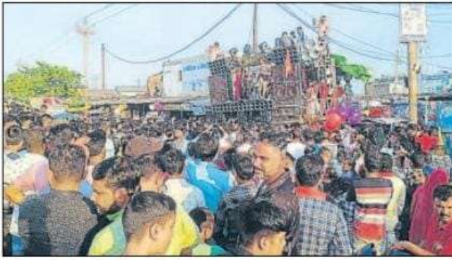
पटहेरवा के डोल मेले में उमड़ी भीड़।

पटहेरवा, हिन्दुस्तान संवाद। पटहेरवा व पटहेरिया का ऐतिहासिक महावीरी डोल अखाड़े का मेला भारी भरकम पुलिस की मौजूदगी में बीता। मेले में पहले दिन बुधवार की रात कुछ उत्पाती युवकों ने अशांति फैलाने की कोशिश की। लेकिन उन्हें पुलिस के कोपभाजन का शिकार बनना पड़ा।