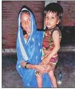
अपहृत बच्चा बरामद होने के बाद अपनी मां की गोद में।