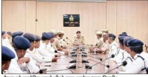
बैठक को सम्बोधित करते सीओ सदर सत्येन्द्र भूषण तिवारी।

त्योहारों को लेकर क्षेत्राधिकारी सदर ने यातायात पुलिस के साथ की चर्चा