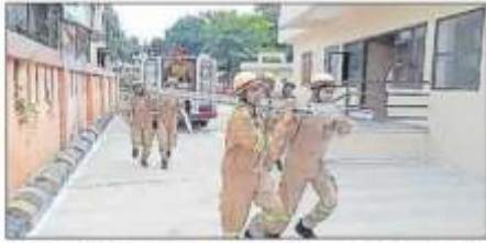
मेडिकल कॉलेज में आग से बचाव व राहत कार्य को लेकर माँक ड्रिल करते कर्मी।