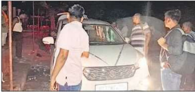
घुसवा स्थित बड़ौदा यूपी ग्रामीण बैंक की शाखा पर पहुंची सीबीआई टीम।