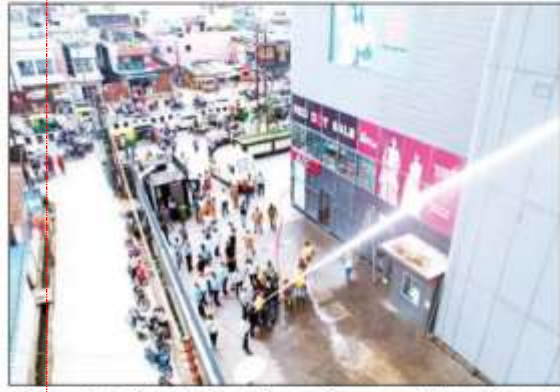
ओरियन मॉल में मोकडिल करते अग्निशमन विभाग, नागरिक सुरक्षा, एनसीसी, आपदा मित्र व सखी।

प्रेमण व कार्टवॉर्ड का दरवाजे-बंदीकरण का कार्य किया गया। मोहरीपुर से एयरपोर्ट जाने वाली मुख्य मार्ग को घंटिन