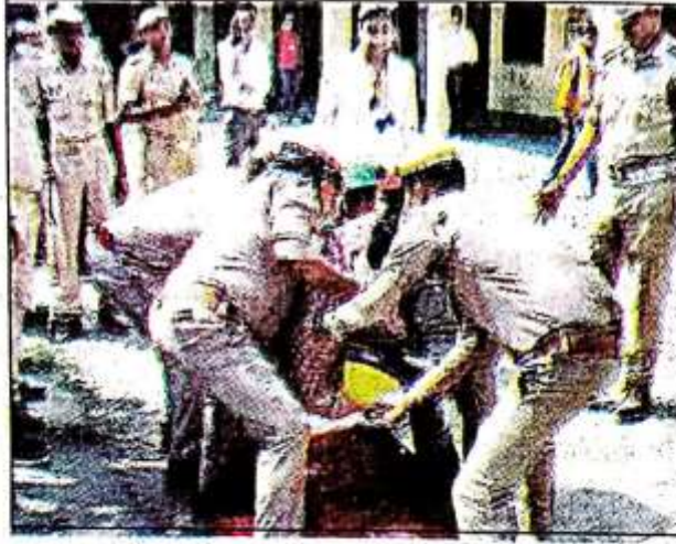
माँकड्रिल के दौरान छात्र को बचाने में लगे कर्मचारी ।

छात्र-छात्राओं द्वारा भूकंप और अग्निशमन से बचाव संबंधित माँकड्रिल किया गया।