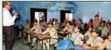
बहराइच के केडीसी में जानकारी देने अधिकारी।

जानकारी दी गई। इस अवसर पर लोगों को आपातकाल में मरीजों का प्राथमिक उपचार करते हुए जल्द से जल्द अस्पताल पहुंचाने के लिए बताया गया। (संवाद)