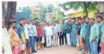
कुमुदा बेलवा गांव में किसान महापंचायत की सफलता के लिए किसानों से संघर्ष करते भारतीय किसान यूनियन के नेता ● जाबहाण

● चार गुणा मुआवजा दिए वगैर जिला प्रखरसन को अमौनी भूमि देने को तैयार नहीं है किसान