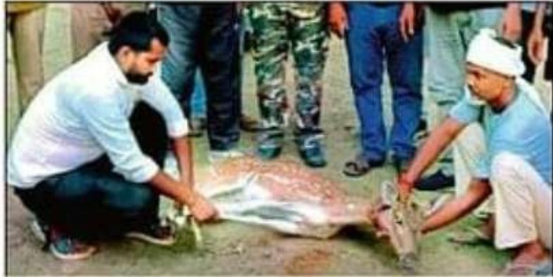
मुंशीपुरवा में एसएसबी जवान को घायल हालत में मिला हिरण।