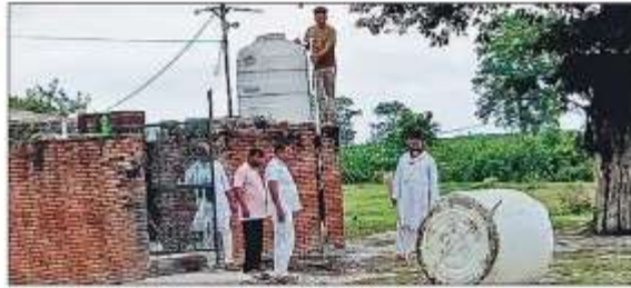
मजार से पानी की टंकी उतारते समुदाय विशेष के लोग

गौतम बुद्ध तपोस्थली में सहेट महेट की भूमि भारतीय पुरातत्व सर्वेक्षण के अधिकृत है। इसके 200 मीटर के दायरे में किसी भी प्रकार का कब्जा या