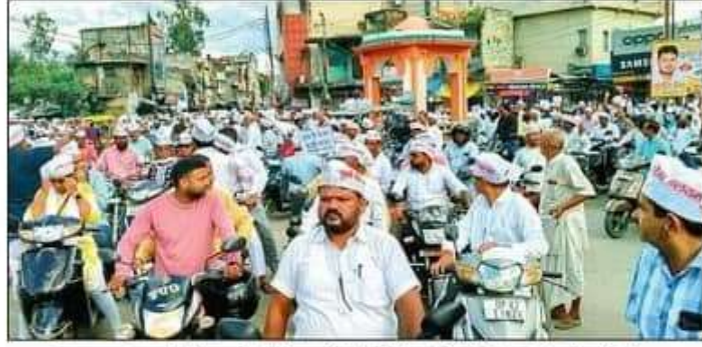
बलरामपुर नगर में निकाली गई जनाक्रोश रैली में शामिल शिक्षक व कर्मचारी।