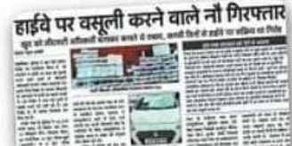
9 जुलाई को प्रकाशित खबर।

इन पुलिसकर्मियों की भी वेचैनी बढ़ गई है।