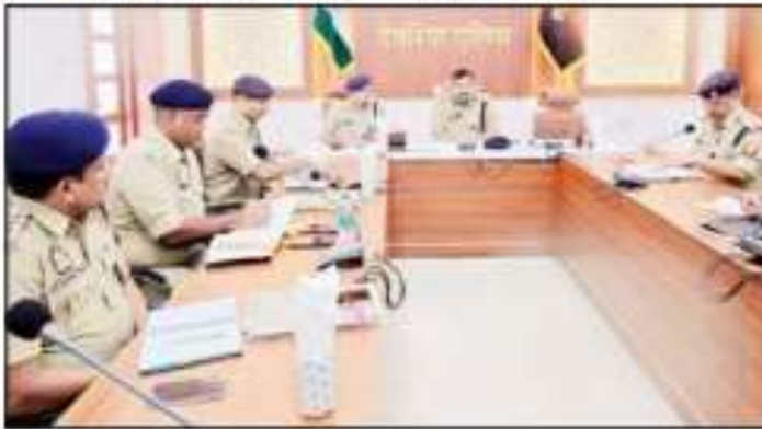
देवरिया-समीक्षा बैठक में मातहतों को निर्देश देते डीआईजी।

कि आगामी त्यौहार के मद्देनजर पूरी सतर्कता बरतें। आपसी सौहार्द बिगाड़ने की कोशिश करने वालों के विरुद्ध कठोर कार्रवाई करें।