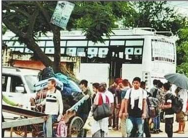
नेपाल से सीमा पर बस में बैठते हुए यात्री। संवाद

संचालन के नाम पर सुरक्षा के साथ खिलवाड़ हो रहा है। नेपाल के कृष्णानगर में 12 से 14 टिकट काउंटर हैं।