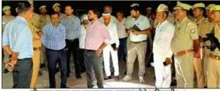
मीरशाह मजार का बुधवार रात जायजा लेते अधिकारी।