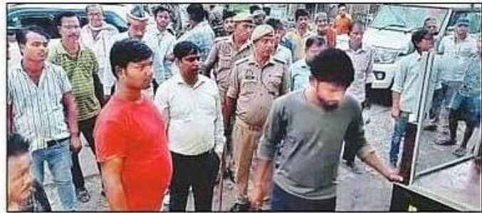
अतिक्रमण हटाता नगर पालिका का दस्ता।

स्टेशन रोड आसपास ही रेलवे स्टेशन और बस स्टेशन है। जब ट्रेन रुकती है, तो एक साथ अधिक संख्या में यात्री उतरने पर जाम लग जाता है। अक्सर रेल यात्रियों के कारण बस स्टेशन की बसें भी जाम की चपेट में आ जाती है।