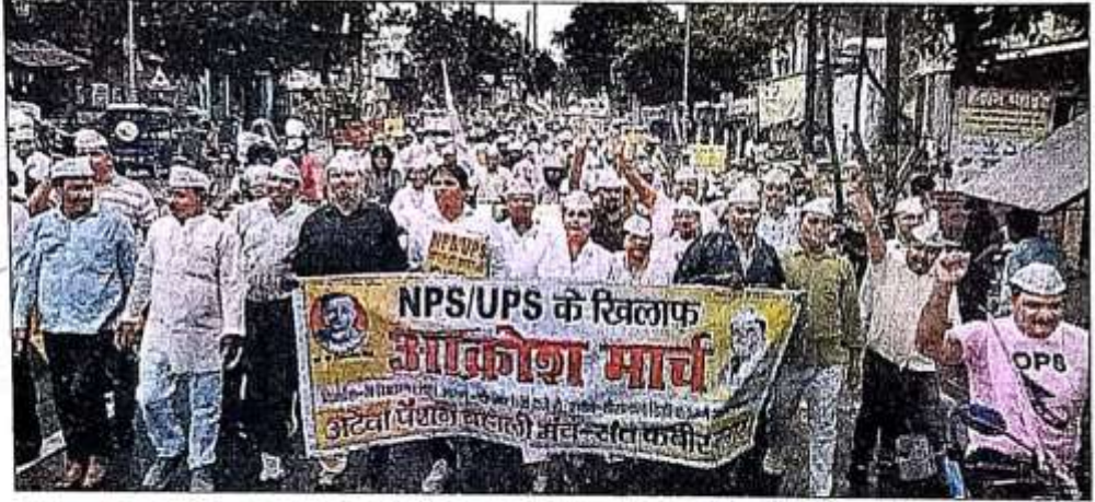
पुरानी पेंशन व्यवस्था की बहाली की मांग को लेकर शहर में आक्रोश रैली निकालते शिक्षक और कर्मचारी। संवाद

संतकबीरनगर। नेशनल मूवमेंट फॉर ओल्ड पेंशन स्कीम (एनएमओपीएस) के राष्ट्रीय नेतृत्व और अटेवा के आह्वान पर पुरानी पेंशन व्यवस्था बहाली के लिए बृहस्पतिवार को शिक्षकों-कर्मचारियों ने आक्रोश रैली निकाली। शहर में पैदल व बाइक मार्च निकाल कर प्रदर्शन करते हुए कलक्ट्रेट पर पहुंचे। वहां प्रधानमंत्री को संबोधित ज्ञापन डीएम को सौंपा।