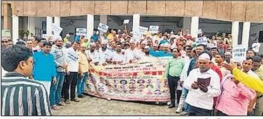
आक्रोश मार्च निकाल कर कलक्ट्रेट पर प्रदर्शन करते शिक्षक-कर्मचारी। • हिन्दुस्तान