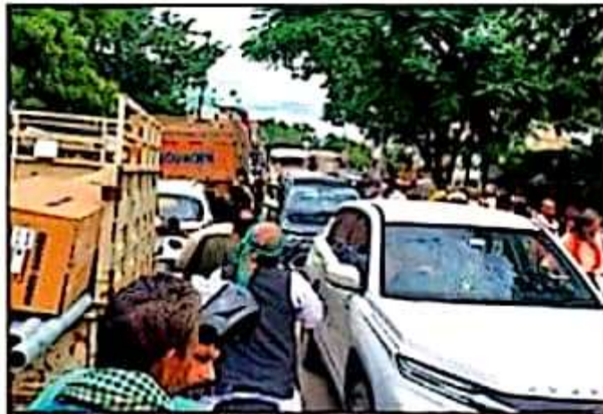
बलरामपुर के गन्ना दफ्तर के पास बृहस्पतिवार को लगे जाम में फंसे वाहन।

यही नहीं, संतोषी माता मंदिर व झारखंडी क्रॉसिंग पर ट्रेनों के आवागमन