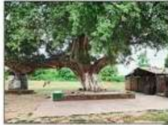
कटरा स्थित मीरशाह मजार।

ज्ञापन के माध्यम से यह भी बताया गया था कि सर्वेक्षण में चिह्नित भूमि पर सुन्नी सेंट्रल वकफ बोर्ड लखनऊ मकान नंबर 02 इंतैजामिया कमेटी दरगाह हजरत सैयद मीरशाह का बोर्ड