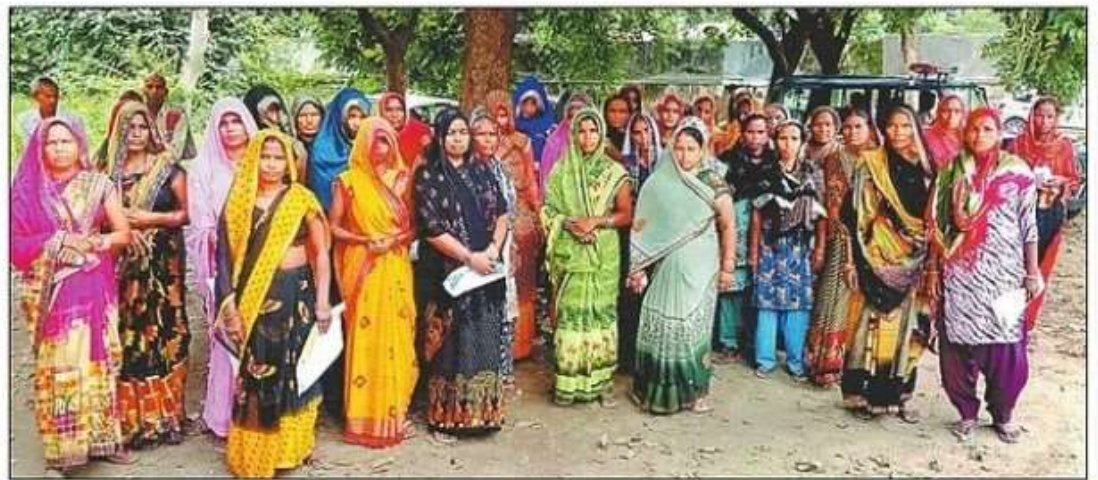
हरपुर बुदहट की महिलाओं ने एसएसपी को दिया पत्र। संवाद

रुपये के लेनदेन सहित अन्य कामों के लिए वह सबके आधार