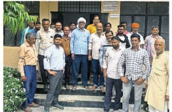
सिंघई विभाग के पास पुरानी पेंशन बहाली की मांग को लेकर जुलूस निकालते कर्मचारी और जिला कृषि अधिकारी के कार्यालय पर बांध में काला फीता बांधकर विरोध जताते कर्मचारी