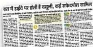
8 जून को प्रकाशित खबर।