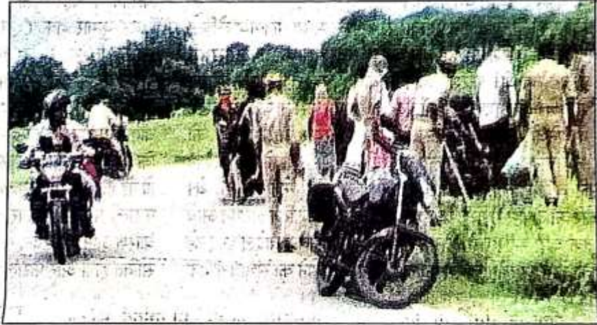
कब्र से नवजात का शव निकलवाते तहसीलदार व टीम।