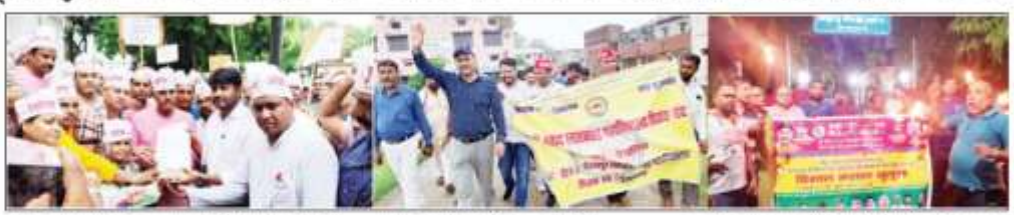
देवरिया-उपनिरीक्षक को हारन सौचते अटेवा के कार्यकारी। कटपुर : प्रदर्शन करते शिक्षक व कर्मचारी। भदनी : बहाल जुलूस में हिस्सा लेते देवरियाई। भदनी : बहाल जुलूस में हिस्सा लेते देवरियाई। भदनी : बहाल जुलूस में हिस्सा लेते देवरियाई।

देवरिया(एसएनबी)। बृहस्पतिवार को अटेवा पेशवा बकाशों में के प्रमुख नेतृत्व के आह्वान पर जिले के सभी शिक्षक, कर्मचारी एवं अधीक्षकों ने एनपीएस/यूपीएस के खिलाफ 'आक्रोश मार्च' निकाला। जिलाधिकारी कार्यालय पर पहुंच कर एनपीएस व यूपीएस को सम्बोधित अपने उप निराशाचारी को रखा।