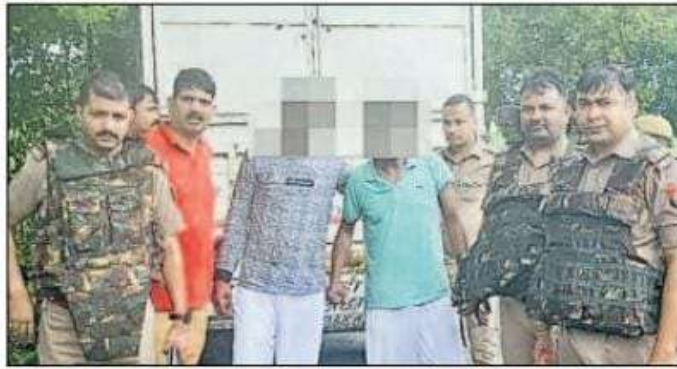
गुरुवार को पटहेरवा थाना क्षेत्र में हुई मुठभेड़ में घायल तस्करों को ले जाती पुलिस।

सेवरही, तमकुहीराज, तरयासुजान एवं साइबर थाने की संयुक्त पुलिस ने पटहेरवा थाना क्षेत्र में फोरलेन पर स्थित महुअवां कांटा के पास पिपरा कनक जाने वाले लिंक रोड पर घेराबंदी कर वाहनों की जांच शुरू कर दी। चेकिंग के दौरान दो पिकअप वाहन एक दूसरे के पीछे आते दिखाई दिये जिसको पुलिस टीम ने रोकने का प्रयास किया। इस पर वाहन में सवार व्यक्ति कुछ दूर