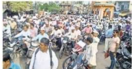
वीर विनय चौक पर आक्रोश मार्च में शामिल शिक्षक व कर्मचारी ● जिलाध्यक्ष