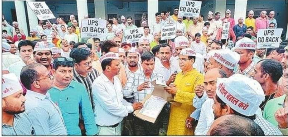
अटेवा के नेतृत्व में शिक्षकों और कर्मचारियों ने डीएम कार्यालय पर किया प्रदर्शन।