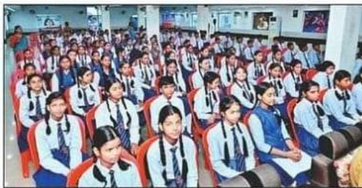
पुलिस की पाठशाला में मौजूद विद्यार्थी। संवाद

अपराध होने पर तत्काल इसकी सूचना 1930 पर देनी चाहिए।