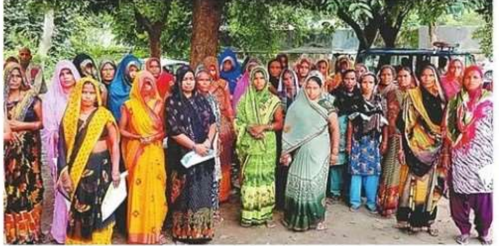
हरपुर बुदहट की महिलाओं ने एसएसपी को दिया पत्र।

कंपनी के कर्मचारी पहुंचे तो हुई लोन की जानकारी : इसकी जानकारी महिलाओं को तब हुई जब फाइनेंस कंपनियों के कर्मचारी कर्ज वसूली के लिए पहुंचने लगे। इसके बाद छह सितंबर को महिलाएं आरोपी के घर पहुंचीं। वहां लोन लेने के बारे में जानकारी