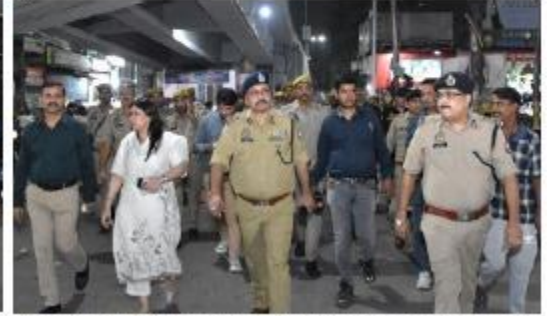
प्रशासन ने शांतिपूर्वक फ्लैग मार्च का आयोजन किया। इस अवसर पर पुलिस अधिकारियों और सिविल अधिकारियों की संतुष्टि व्यक्त की गई। प्रशासन ने शांतिपूर्वक त्योहार मनाने की सलाह दी है।