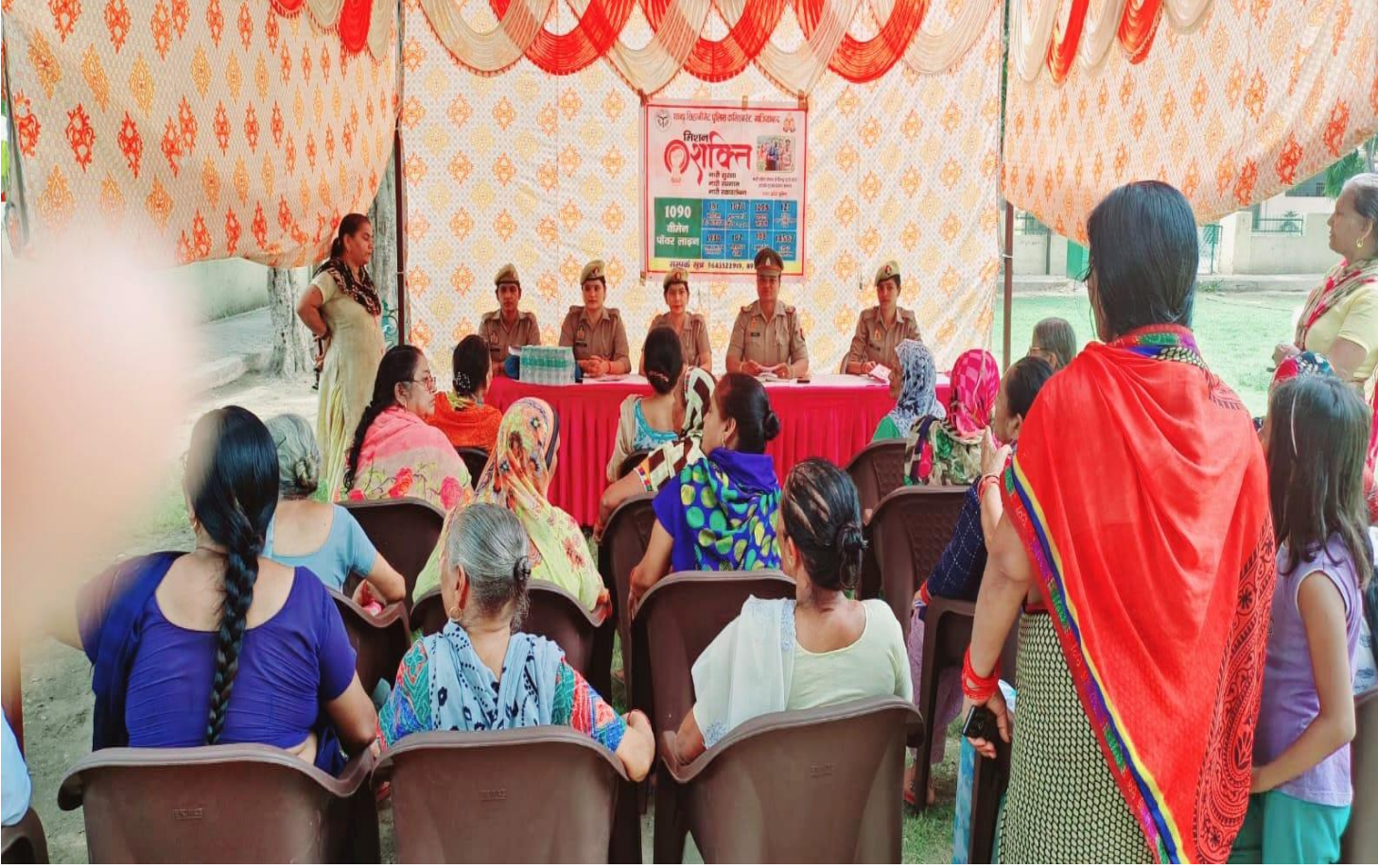
दिनांक 07/10/2024 को अभियान के दौरान प्रभारी ए0एच0टी0 द्वारा जनता इंटर कालेज मोरटा थाना क्षेत्र नन्दग्राम में सैलफ डिफेन्स ट्रेनिंग देते हुये