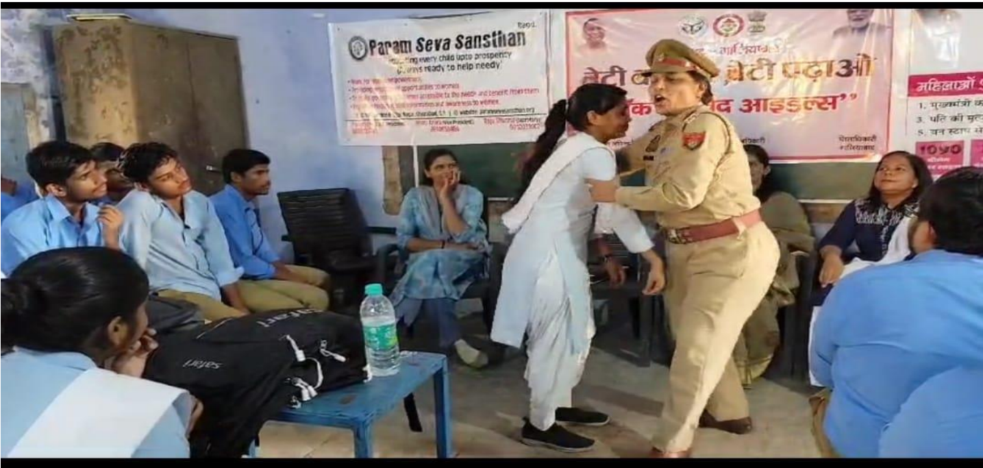
दिनांक 07/10/2024 को अभियान के दौरान प्रभारी ए0एच0टी0 द्वारा रामलीलाल मैदान में पिक बूथ पर सैलफ डिफेन्स ट्रेनिंग देते हुये