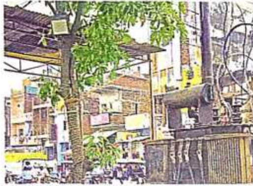
दुर्गा जी के पंडाल के पास खुले में रखा ट्रांसफार्मर

पिछले वर्ष दशहरा और धनतेरस पर भी लोगों को कई प्रकार की दुशवारियों का सामना करना पड़ा था। शहर में जाम की समस्या आए दिन लोगों को अभी से परेशान कर रही है। जबकि यातायात व्यवस्था के लिए पुलिस बल की तैनाती की गई है। लेकिन यातायात को कमान संभालने वाले पुलिसकर्मी भी भीड़ अधिक होने पर असहाय दिखते हैं। नवरात्र में शहर