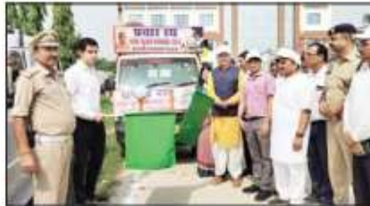
सड़क सुरक्षा प्रचार वाहन को रवाना करते सदर सांसद।

समस्त दोपहिया वाहन चालक हेलमेट लगाएं, स्टंट न करें, नशे की हालत में वाहन न चलाएं ओवरस्पीड न करें, चारपहिया वाहन चालक सीटबेल्ट अवश्य लगायें। प्रचार वाहन सड़क सुरक्षा पखवाड़े में जनपद के विभिन्न चौराहों,