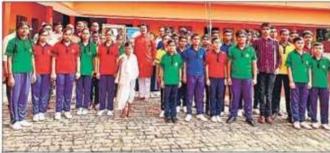
बुधवार को इंडियन पब्लिक स्कूल में महात्मा गांधी व शास्त्री की जयंती।