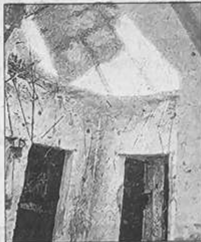
मेहड़ा पुरवा स्थित कांशीराम आवास की गिरी छत।

सदर कोतवाली के मेहड़ा पुरवा बाहर स्थित कांशीराम आवास है।