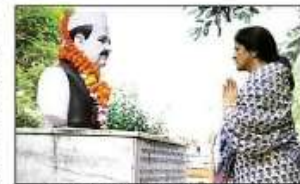
लाल बहादुर शास्त्री की जयंती पर उनके चित्र पर माल्यार्पण करती जिला पंचायत अध्यक्ष।