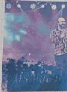
महाराजगंज महोत्सव में कार्यक्रम प्रस्तुत करती प्रसिद्ध गायक बी प्राक

महाराजगंज, हिन्दुस्तान टीव्ही। पंजाबी सिंगर, कंपोजर और म्यूजिक डायरेक्टर बी प्राक ने महाराजगंज महोत्सव की दूसरी सुरंगी रात को खादमार बना दिया। बालीवुड फिल्म केसरी के गाने ठेरी मिट्टी के लिए 67वें राष्ट्रीय फिल्म पुरस्कार में सर्वश्रेष्ठ प्लेबैक सिंगर रहे बी प्राक ने मंच संभालते ही अपने खास अंदाज में लोगों को रिझाना शुरू किया। फिल्महाल 2-मोहब्बत फिल्म के पापुलर गीत एक बात बसो अबे तो फाटों में परतो हो, क्या तुम हमसे अब भी मोहब्बत करते हो... को जैसे ही बी प्राक की अवाज मिली लोग झूमने लगे।