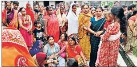
गोरखनाथ इलाके के पार्वतीपुरम कॉलोनी में बच्चियों की हत्या के बाद रोते परिजन।