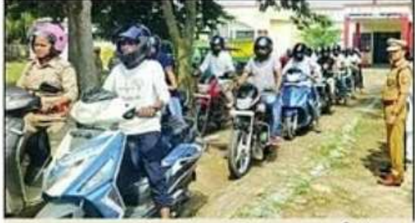
सड़क सुरक्षा पखवाड़ा के हत एआरटीओ कार्यालय से निकली बाइक रैली। -संवाद

श्रावस्ती। मार्ग दुर्घटनाओं को रोकने के लिए पुलिस व परिवहन विभाग की ओर से यातायात पखवाड़ा मनाया जा रहा है। इसके लिए बुधवार को एआरटीओ कार्यालय से बाइक रैली