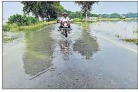
उस्कर-सोहंस मार्ग पर करगुलिया गांव के पास सड़क पर बाढ़ का पानी बढ़ने से लोगों को आवागमन में कठिनी परेशानी उठानी पड़ रही है।