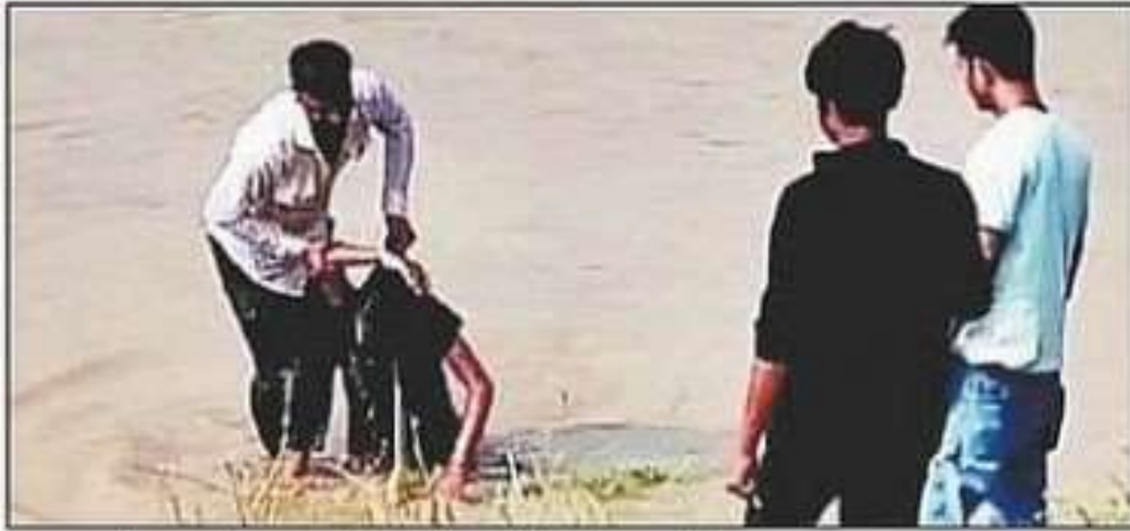
पुल से छलांग लगाने वाली युवती को बाहर निकलता युवक।