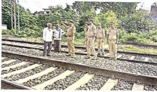
गौर धना क्षेत्र में लोगों को रेल सुरक्षा के प्रति जागरूक करती संयुक्त टीम • जखण

जनता संवाददाता बस्ती: रेल दुर्घटनाओं के प्रति जागरूक करने के लिए धना गौर पुलिस, जोअरपो व रेलवे सुरक्षा बल इला धना गौर क्षेत्र के पगईडी कच्चा मार्ग होते हुए विनिव बाजार की तरफ रेलवे लाइन पर कर जा रहे लोगों को उनको जनमत की सुरक्षा व सतर्कता के लिए बुधवार को जागरूकता अभियान चलाया गया। रेलवे लाइन पर नहीं करने, रेलवे छला खुले होने के दौरान बने हुए मार्ग से ही आवागमन करने का अनुरोध किया गया।