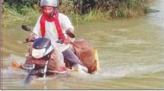
नौगढ़-महदेवा मार्ग पर चढ़ा बाढ़ का पानी। संवाद

मुख्यालय से निकलकर सोहांस जाने वाली सड़क का एक वर्ष पहले ही हुआ था निर्माण