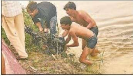
नदी से गिरे मोटर बोट का निकालते युवक।

कसया, हिन्दुस्तान संवाद। हिरण्यवती नदी में बुधवार को मोटरबोट का इंजन अचानक गहरे पानी में गिर गया। बोट में बिना सेपटी जैकेट के बैठकर नौकायन का लुफ उठा लोगों के बीच अफरातफरी मच गई। नाव नदी के तेज जलधारा के बीच असंतुलित होकर डगमगाने लगी। नदी के किनारे बैठे और स्थानीय लोगों ने रस्सी के सहारे असंतुलित नाव को खींचकर किनारे किया। जमीन पर कि नाव डगमगाने के दौरान कोई अनहोनी नहीं हुई। हादसे की सूचना पर नव ने तत्काल प्रभाव में नदी में नाव के संचालन पर रोक लगा दी है। सुरक्षा के पुख्ता इंतजाम होने के बाद ही दोबारा