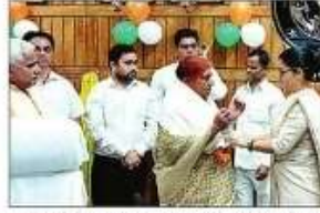
गांधी जयंती पर स्वतंत्रता संग्राम सेनानी के परिजनों को सम्मानित करती डीएम। -संवाद