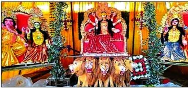
करनैलगांज में शारदीय नवरात्र को लेकर स्थापित की गई मां दुर्गा की प्रतिमा।