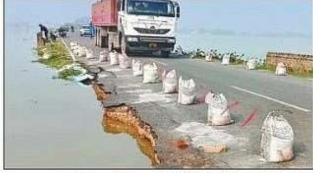
जमुआर नदी का बढ़ने से कटान करती तेतरी-सोहांस मार्ग। संवाद