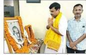
बहराइच में खादी आश्रम में गांधी जयंती पर उनके चित्र पर माल्यार्पण करते संवाद।