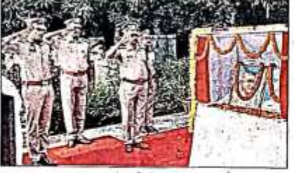
पुलिस लाइंस में ध्वजारोहण के बाद सलाभी लेते एसपी। अंत: सुधीर

मौके पर विद्यालय के बच्चे राष्ट्रीय गीत और सांस्कृतिक कार्यक्रम प्रस्तुत किए। इसी तरह सेर के पंचमी विवेकानंद इंटर कॉलेज धनपट्टा, गायध चौबे युनिक फाउंडेशन स्कूल धनपट्टा, कल विद्यालय प्रसादपुर, तारापद एकमोल महाविद्यालय