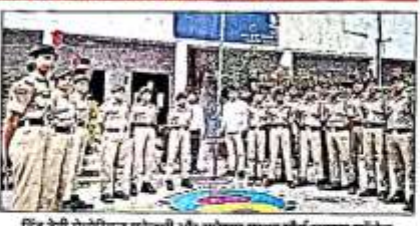
सिद्धे देवी मेमोरियल एकेडमी और रामेश्वर प्रसाद मीरं स्मारक कॉलेज ठाकुलहाडी धनपट्टा में ध्वजारोहण करते एनसीसी कैडेट्स।