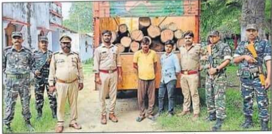
सागौन बोटा लदे ट्रक को सीज करते वन कर्मी व एसएसबी टीम

आज के तीन माह पूर्व वन विभाग ने 400 से अधिक बोटा सागौन की लकड़ी बनकटी गांव के निकट सीज की थी। यह लकड़ियां सोहेलवा वन्यजीव प्रभाग से काटी गई थीं। उस समय लकड़ियों को रेंज कार्यालय नहीं लाया गया था। एसएसबी नवीं वाहिनी खंगरा नाका के सेना नायक को बुधवार