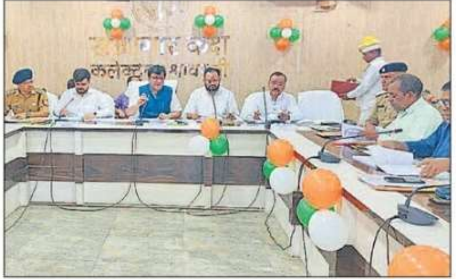
कलेक्ट्रेट में आयोजित कार्यक्रम में मौजूद प्रभारी मंत्री व अन्य

इस मौके पर महात्मा गांधी व शास्त्री जी के चित्र पर फूल माला चढ़ाई। प्रभारी मंत्री ने स्वच्छता ही सेवा महा अभियान एवं ओडीएफ-प्लस में