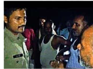
कौड़िया के हरिलाल पुरवा में गांव में लोगों से जानकारी लेती पुलिस