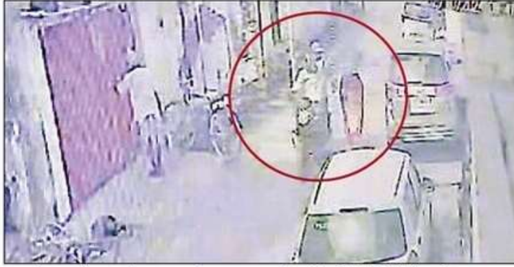
ढपालीपुरवा में लूट की वारदात के बाद भाग रहे लुटेरे सीसीटीवी में कैद हो गए