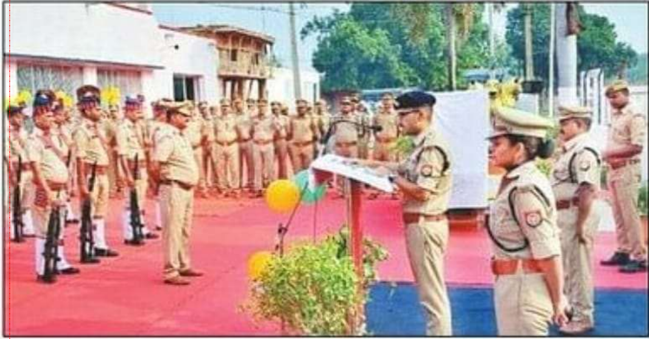
पुलिस लाइंस में कर्मियों को शपथ दिलाते एसपी।