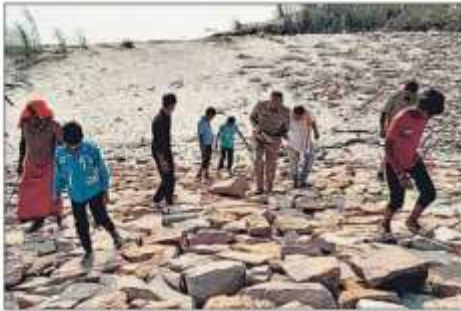
दुर्घटनास्थल घाट क्षेत्र में क्राइम सीन से बुधवार को साक्ष्य संकलन करने पहुंचे सीओ और थानेदार।