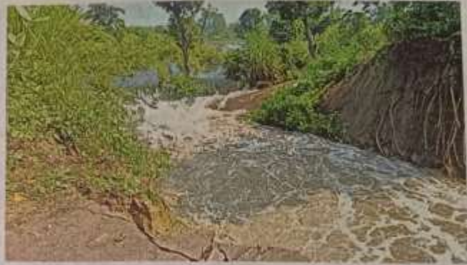
टूटे हुए गंडक नहर के तटबंध के रास्ते जंगल से आ रहा पानी • जगरण

सोहगीबरवा के समीप रोहुआ नाले को नाव से पार करते ग्रामीण • जगरण