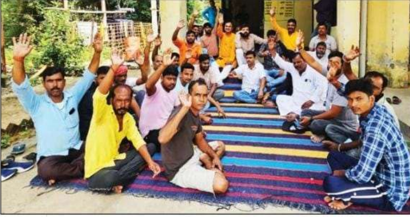
विद्युत उपकेन्द्र पर धरना देते चेयरमैन और उनके समर्थक।