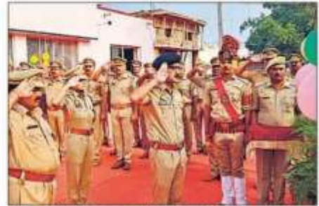
पुलिस लाइन में राष्ट्रपिता महात्मा गांधी व पूर्व प्रधानमंत्री लाल बहादूर शास्त्री के जयंती अवसर पर सलामी देते एसीबी व अन्य।