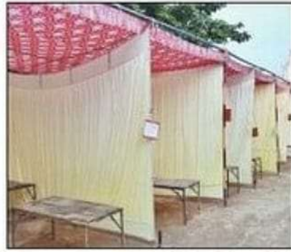
बभनान गन्ना समिति परिसर में बनाया गया मतदान बूथ। संवाद

सहकारी गन्ना समिति बभनान में 89 डेलीगेट पदों के लिए 162