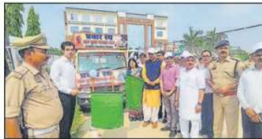
बुधवार को सनबीम स्कूल में सड़क सुरक्षा जागरूकता वाहन को हरी झंडी दिखाते सदर सांसद शशांक मणि त्रिपाठी।