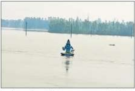
शहर के बुद्धनगर मोहल्ला में सोहंस रोड पर बना एम्पशन घाट व यहां स्थापित शंकर जी की मूर्ति जमुआर की बाढ़ में पानी से घिर गई है।

सिद्धार्थनगर, सिद्धार्थनगर टीम। जिले में बाढ़ के हालात कुछ इलाकों में छोड़ दें तो बाकी स्थानों पर जल के तम बने हुए हैं। राप्ती, बूढ़ी राप्ती सहित चार नदियां लाल निशान के पार बह रही हैं। राप्ती का जलस्तर अब भी बढ़ रहा है। बाकी नदियां स्थिर हैं लेकिन कोई खास सुधार नहीं है। कई सड़कें व गांव जलमग्न हैं। शहर के कुष्मानगर मोहल्ले में जमुआर का पानी भरा हुआ है। सोहंस रोड पर बना एम्पशन और यहां स्थापित शंकर भगवान की मूर्ति बाढ़ के पानी में डूब चुकी है। सोहंस, भनवापुर, जोरिया क्षेत्र में बाढ़ ने मुश्किल पैदा कर रखी है।