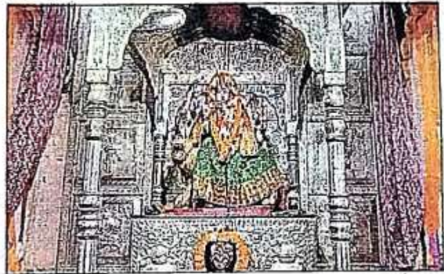
समय माता मंदिर।