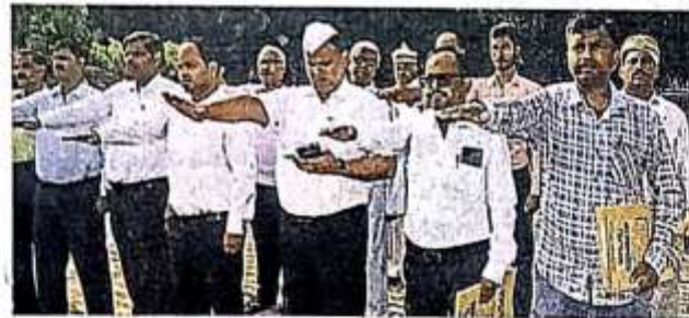
कलेक्ट्रेट परिसर में देश की एकता व अखंडता को बनाए रखने का संकल्प लेते अधिकारी, कर्मचारी