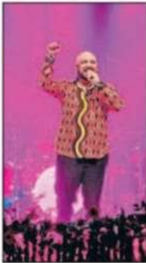
महाराजगंज महोत्सव में अपनी प्रस्तुति देते गायक बी प्राक, महोत्सव की दूसरी रात भी पूरा पंडाल खचाखच भर रहा।

महाराजगंज, हिन्दुस्तान टीव्ही। पंजाबी सिंगर, कंपोजर और म्यूजिक डायरेक्टर बी प्राक ने महाराजगंज महोत्सव की दूसरी सुरंगी रात को खादमार बना दिया। बालीवुड फिल्म केसरी के गाने ठेरी मिट्टी के लिए 67वें राष्ट्रीय फिल्म पुरस्कार में सर्वश्रेष्ठ प्लेबैक सिंगर रहे बी प्राक ने मंच संभालते ही अपने खास अंदाज में लोगों को रिझाना शुरू किया। फिल्महाल 2-मोहब्बत फिल्म के पापुलर गीत एक बात बसो अबे तो फाटों में परतो हो, क्या तुम हमसे अब भी मोहब्बत करते हो... को जैसे ही बी प्राक की अवाज मिली लोग झूमने लगे।