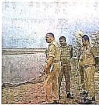
दुबौलिया थाना क्षेत्र का सरयू के तटबंध पर जांच करते पुलिस कर्मी।