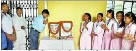
महामाया राजकीय महाविद्यालय में राष्ट्रपिता महात्मा गांधी व लालबहादुर शास्त्री के चित्र पर पूजा अर्पित करते प्राध्यापक।