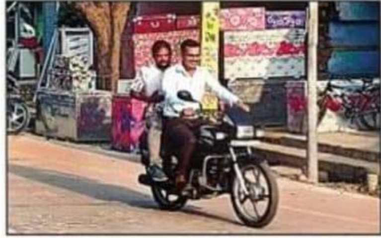
गोंडा रोड पर बिना हेलमेट जाते बाइक सवार।

बलरामपुर। सड़क सुरक्षा पखवाड़ा की बुधवार से शुरुआत हो गई। पहले दिन कलेक्ट्रेट से जागरूकता वाहन को रवाना करते हुए अफसरों व कर्मियों को संकल्प दिलाया गया, जबकि शहर