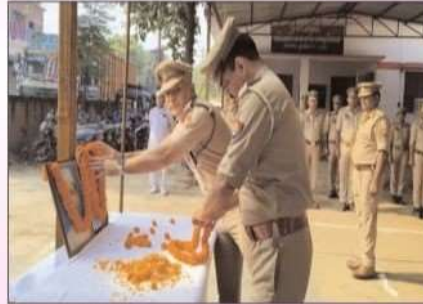
द्वारा पुलिसकर्मियों को सत्यनिष्ठा के साथ राष्ट्र की एकता व