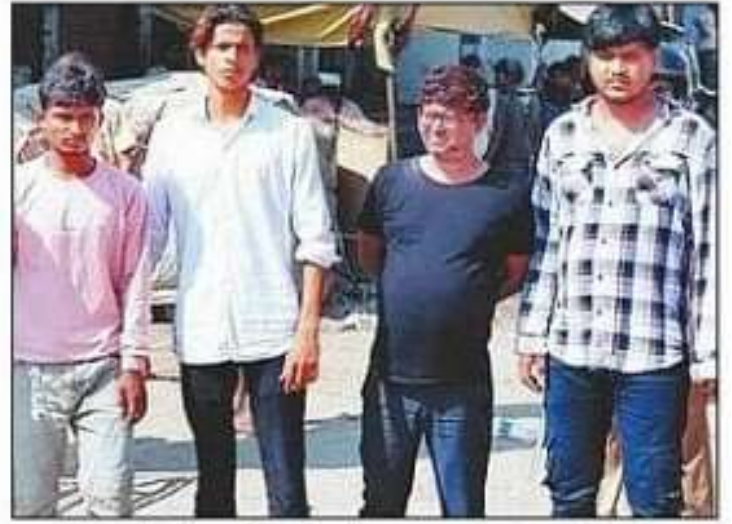
बढ़नी कस्बे में आरोपियों को पकड़ कर ले जाती पुलिस।