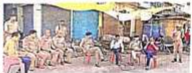
कस्तूरबा गाँधी बालिका विद्यालय परिसर में शनिवार को मिशन शक्ति फेज 5 के तहत जागरूकता कार्यक्रम किया गया।

जमान सड़कदार, बढ़ती। देकरआ धान क्षेत्र के चढ़ती कस्बे में तीन दिन पूर्व ही बंदी कस्बे के साथ दुकानें समुदाय के 60 करोड़ रुपये का दुकानें बंद करने पर विचार को लोगों का मुख्य फूट पड़ा। दुष्कर्म के विरोध में विभिन्न संगठनों के लोगों ने जोरदार विरोध प्रदर्शन किया। प्रदर्शनकारियों ने आंदोलन के पार पर कुलकर्णी पत्थर तब चढ़ते दिन जाने की मांग करने हुए जमान दिख। घटने के विरोध में पंचायत पूर्ण सड़क बंद करा। दूसरे समुदाय के लोगों द्वारा छतों में पत्थरबाजी करने व तलवार निकालने करने से जमान की स्थिति बंद