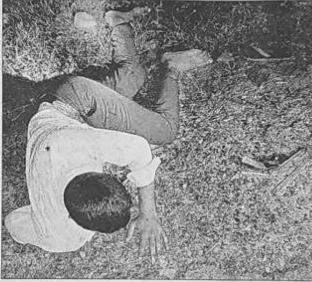
मुठभेड़ स्थल पर घायल बटमारा, पास पड़ा तमंचा।