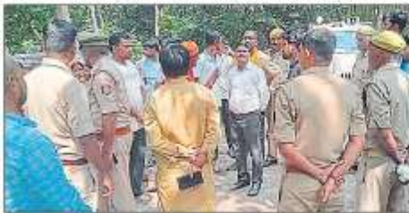
मौके पर निरीक्षण करते नायब तहसीलदार व पुलिस।

हंगामे के बीच मौके का फायदा उठाकर धर्मगुरु वहां से भाग खड़े हुए। फोर्स के साथ मौके पर पहुंचे नायब तहसीलदार ने मामला शांत कराया। एक स्कूल में स्थित धार्मिक