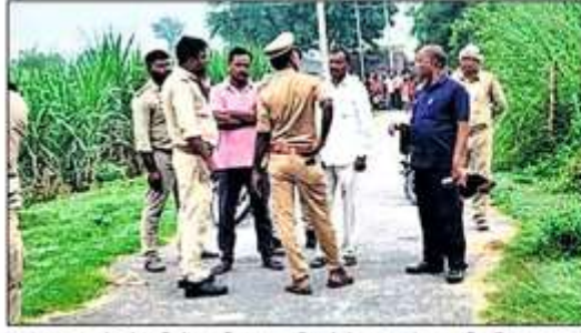
कटरा बाजार के सेल्हरी में युवती का शव मिलने के बाद जांच करती पुलिस।

पुलिस ने खेतों व झाड़ियों में भी सुराग तलाशने की कोशिश की लेकिन उसके हाथ कुछ नहीं लगा। प्रभारी