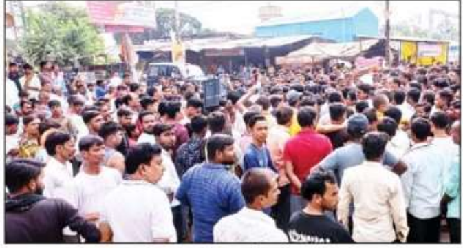
जनसभा करते व प्रशासन को ज्ञापन सौंपते प्रदर्शनकारी।

एसओ कडेल, एसओ शोहरतगढ़, एसओ चिल्हिया आदि लगाए गए हैं। पीएसी की एक टुकड़ी के अलावे भारी संख्या