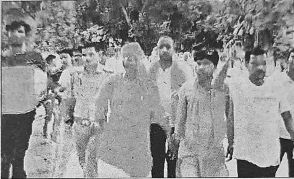
प्रदर्शन करते हिंदूवादी संगठनों के कार्यकर्ता। संवाद