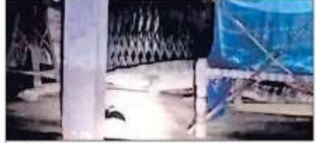
सुजीली रेंज के जिलेकी मौड़ी गांव में घर में घुसा विनालकाय मगरमच्छ।

बहराइच, संवाददाता। सुजीली रेंज के जिलेकी मौड़ी गांव में शनिवार की रात मगरमच्छ के घुसने से हड़कंप मच गया। ग्रामीणों को सूचना के बाद भी वन विभाग की टीम मौके पर नहीं पहुंची। पुलिस टीम ग्रामीणों को सुरक्षा को लेकर मौके पर जुटी रही।