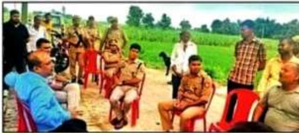
छोटी उज्जैनी में ग्रामीणों से बातचीत करते अधिकारी। संवाद

देहात कोतवाली क्षेत्र के जमदरा के मजरे छोटी उज्जैनी का मामला, पुलिस व पीएसी तैनात