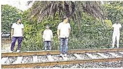
खलीलाबाद में रेल पटरी के आसपास जांच करते अधिकारी • जवाहर

कोतवाली खलीलाबाद के गावत्री मंदिर के पास रेल की पटरी पर साइकिल रखी हुई थी। शनिवार की सुबह के समय गोरखपुर से साबरमती-गुजरात जाने वाली अहमदाबाद एक्सप्रेस के इंजन में साइकिल फंस गई थी। इसके बाद ट्रेन