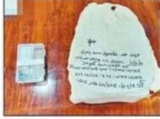
शातिर अभियुक्त के पास बरामद सामान।