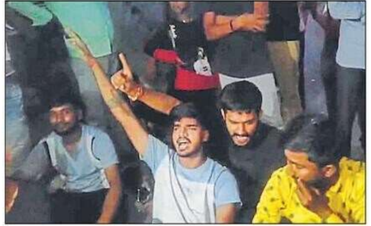
जोगिया चौराहे पर रविवार की शाम पूजा पंडाल के पास खड़े वाहनों का चालान करने से नाराज चौराहे के लोगों ने सिद्धार्थनगर-बांसी मार्ग जाम कर प्रदर्शन किया।