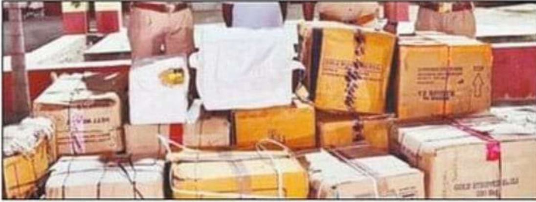
बरोहिया में बरामद अवैध पटाखा।