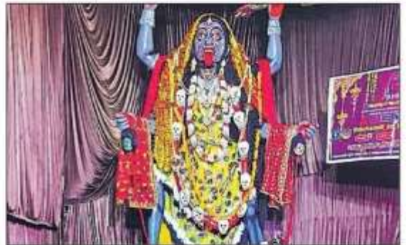
शोहरतगढ़ के गड़ाकुल में स्थापित मां काली की प्रतिमा।

मां आदि शक्ति की पूजा अत्यंत फलदायी है। शारदीय नवरात्र में माता की पूजा सभी को करनी चाहिए। मां सिद्धिदात्री के दर्शन पूजन के लिए भक्तों की कतार लग रही है। जिले के प्रमुख दुर्गा मंदिरों में सुरक्षा की तगड़ी व्यवस्था रही। मंदिर के मुख्य गेट से लेकर मंदिर परिसर में पुलिस के जवान