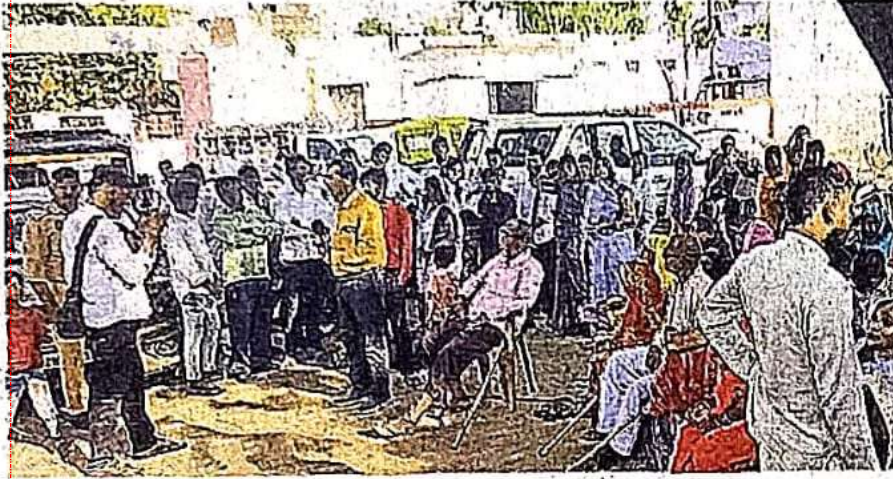
मतांतरण की सूचना के बाद कोतवाली में पहुंचे लोग • जागरण

इसके लिए सबसे पहले गांवों में चिह्नित किए जाते हैं गरीब