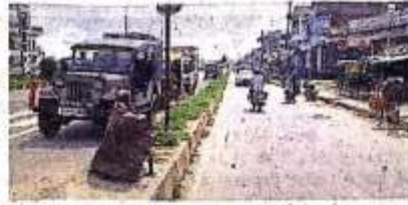
फाजिलनगर के कॉम्प्लेक्स में फोर्सेन पर लगे दण्ड