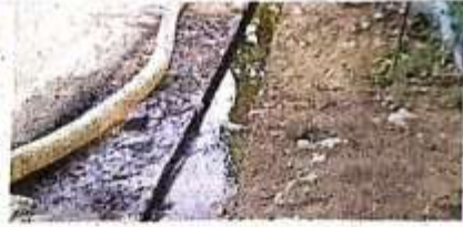
फाजिलनगर निवासी फोर्सेन के दंडीयों पर की जाने वाली धमकी