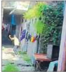
सरकारी शिशु मंदिर गली में दुकानें बंद करा रहे लोगों पर ईट-पत्थर फेंकते बुधक।

बढ़नी (सिद्धार्थनगर), हिन्दुस्तान संवाद। बढ़नी कस्बे में तीन अक्टूबर की शाम नौ वर्षीय मासूम के साथ रेप की घटना को लेकर रविवार को आक्रोशित लोग सड़क पर उतर आए। उनके इस विरोध प्रदर्शन को कस्बे के माल मंडल रोड, राम जानकी मंदिर रोड, बंस स्टॉप व चट्टी बाजार के दुकानदारों ने दुकानें बंद कर विरोध का समर्थन दिया। गोला बाजार में एक दुकान खुली देख उसे बंद कराने को लेकर दुकानदार से बहस होने लगी। दुकानदार के समर्थन में दूसरे पक्ष से भी कई लोग आ गए। इससे माहौल तनावपूर्ण हो गया। इसी दौरान कस्बे के सरकारी शिशु मंदिर गली में दुकानें बंद करा रहे लोगों पर दूसरे पक्ष के कुछ बुधक ईट-पत्थर फेंकने लगे। एक बुधक के हाथ में तलवार भी दिखाई। मामले की जानकारी होते ही एएसपी