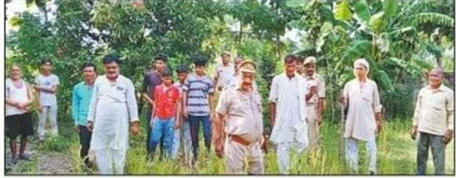
जंगल कुरमौल में लकड़बग्घा की तलाश करती वन विभाग की टीम। संवाद