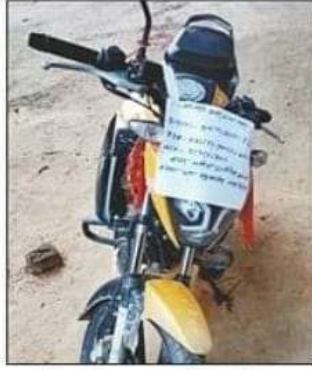
ठगी करने वाला शातिर अभियुक्त की चोरी की बाइक।

एसपी ने बताया कि आरोपी सरकारी शिक्षक के अलावा सरकार की ओर से संचालित योजना का लाभ दिलाने के नाम पर जिले की महिलाओं से ठगी करता था। अब तक की जांच में डेढ़ लाख रुपये से अधिक की ठगी कर चुका है। इसके