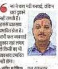
सुंदर स्वच्छ बाजार, जाम निकासी