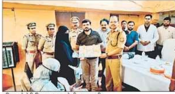
महिला को बेबी किट प्रदान करते डीएम व एसपी।