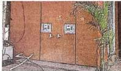
फाजिलनगर निवासी नगर विभाग में खरब पक्ष बंदर घुंटीयन