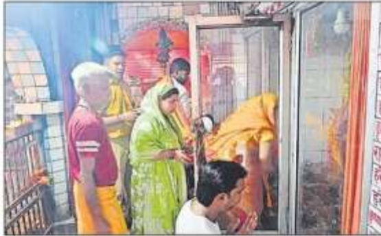
नगर स्थित श्री सिंहेश्वरी देवी मंदिर में पूजन-अर्चना करते भक्त।

नगर के श्री सिंहेश्वरी देवी मंदिर, बेलौहिवा स्थित दुर्गा मंदिर समेत पल्टा देवी मंदिर, योगमाया देवी मंदिर, कठेला में समय माता, गालापुर स्थित खटवासिनी देवी मंदिर, बांसी के सियसपार देवी मंदिर समेत अन्य दुर्गा मंदिरों पर सूर्योदय के पहले से ही भक्त पहुंच गए। भक्तों ने पहुंच कर माता कूष्मांडा की पूजा अर्चना की। घरों में