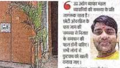
सुंदर स्वच्छ बाजार, जाम निकासी