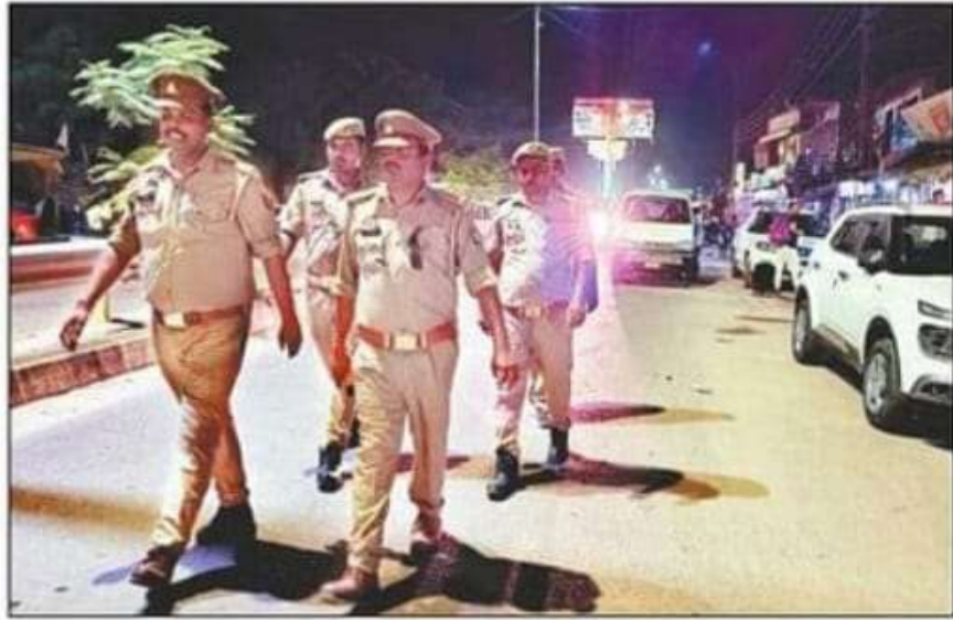
सोनौली बॉर्डर पर गश्त करती पुलिस।

सीमावर्ती नेपाल से सटे गांव में गश्त की जा रही है। सीमा पर संवेदनशील इलाकों में पेट्रोलिंग, सीसीटीवी व ड्रोन कैमरों से निगरानी के निर्देश जारी किए गए हैं। सरहद के 84 किमी नेपाल सीमा से सटे संवेदनशील गांव में पुलिस और एसएसबी के जवानों ने संयुक्त रूप