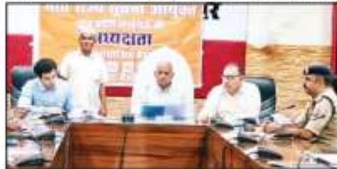
देवरिया-समीक्षा बैठक में होलते राज्य सूचना आयुक्त।