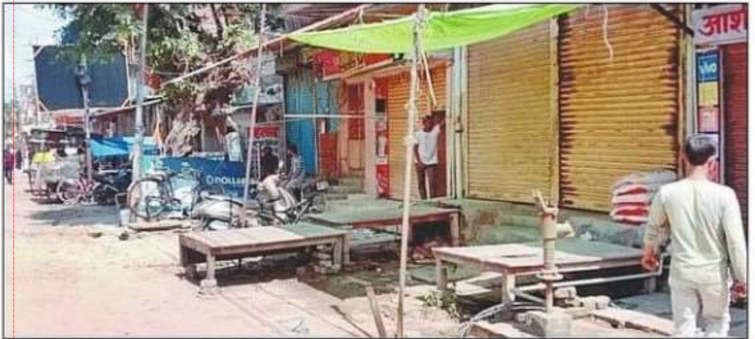
बढ़नी कस्बे में हंगामे के बाद बंद पड़ी दुकानें। संवाद