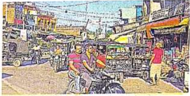
बर्डपुर मुख्य चौराहे पर अवैध तरह से खड़े वाहन।

व्यावसायिक वाहनों का अवैध अतिक्रमण व पार्किंग व्यवस्था न होने के कारण अक्सर जाम में फंसना पड़ता है। नगर पंचायत में जाम की समस्या आए दिन लोगों को अभी से परेशान कर रही है। बर्डपुर बाजार में