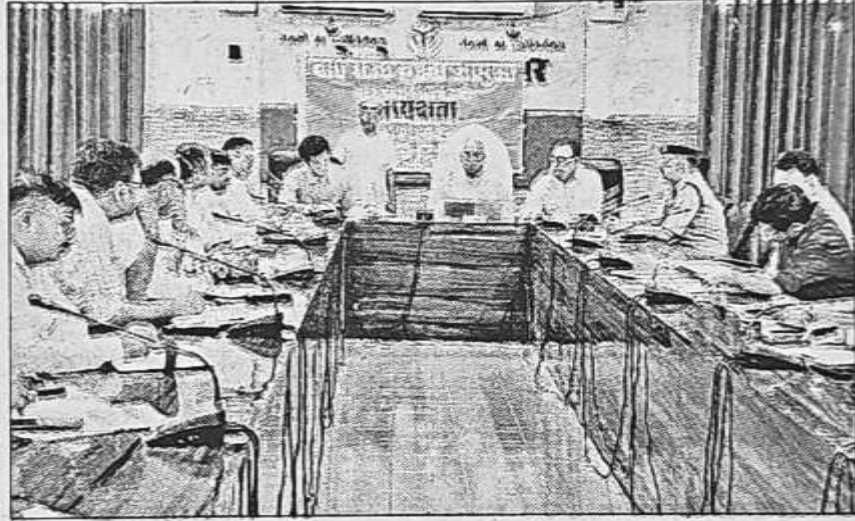
राज्य सूचना आयुक्त ने कलेक्ट्रेट सभागार में बैठक की।

जन सूचना अधिकारियों को ऐसे लोगों की परेशानी समझते हुए उनको यथाशीघ्र सूचना देकर उनकी