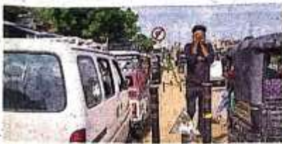
फाजिलनगर में फोर्सेन पर लगाने का दृश्य