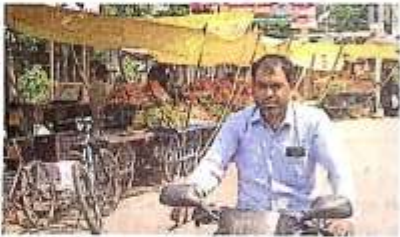
फोर्सेन के रॉडिज रोड के फुटपाथ पर लगी मोटो फल की दुकानें

सार्वजनिक स्थलों पर बने संरक्षण केंद्र पर खरब-खरब का जुआ चल रहा है। बरगी के चलते लोगों को खरब-उधर घटकन पड़ता है। खरब स्थलों पर बंदर घुंटीयन लगे हैं लेकिन तेल खाल है। निरिक्त करण पंचायत को यही धम पर खरबलार होते हैं। नगर का मुख्य मार्ग बंद बहाल व कलेज रोड है। बसू बहाल में सड़की व कल मंडी, सड़की सड़की व बंद घुंटीयन हैं। यह फाजिलनगर का सबसे अधिक भीड़भाड़ वाला क्षेत्र है, जो जाम से सबसे ज्यादा प्रभावित होता है। जामरोडिज की उत्तरी पट्टी के फुटपाथ पर खरबे खरबे डेलें, व