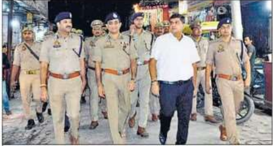
त्योहारों के मद्देनजर गुरुवार की रात एडीजी, कमिश्नर और डीआईजी ने पैदल गश्त कर लोगों को सुरक्षा का एहसास कराया।