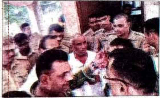
पुनर्मतगणना में नोक-झोंक करते समर्थक व सुरक्षा को लेकर मुस्कंद पुलिस बल।