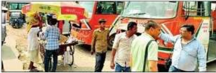
बहराइच स्थित रोडवेज बस अड्डा।