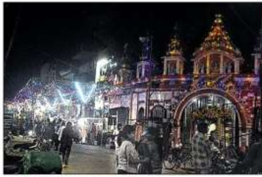
नवरात्र में झालरो से सजा शहर का चौक बाजार।