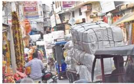
पंडेयसत में लग्न जाम • जागरण

सामने तो, वहां आने वाले सड़क के बीच में गाड़ी खड़ी कर देते हैं। लोगों के पीने के लिए पानी की व्यवस्था नहीं है। एक किमी में फैले इस बाजार में एक यूरिनल है। वह भी गंदगी से