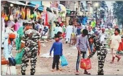
बढ़नी के नो मेंस लैंड के पास जांच करते एसएसबी के जवान। संवाद

तस्करी गठजोड़ से नेपाल ने आए लोग बवाल में शामिल हुए, और मौका देखते हुए फरार हो गए, मामला उजागर होने के बाद सुरक्षा एजेंसियां बढ़नी, कोटिया और खुनुवा बार्डर पर अलर्ट हो गई है। चेकिंग गहनता से बढ़ा दी है। भारत नेपाल बार्डर पर