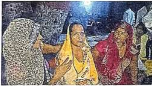
विवाद के बाद कोतवाली पहुंची महिलाएं