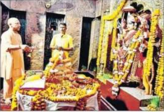
देवीपाटन मंदिर में गुरुवार को माता की आराधना करते मुख्यमंत्री योगी आदित्यनाथ। इस दौरान मुख्यमंत्री ने मंदिर परिसर में बच्चों को चाकलेट भी दी।

मुख्यमंत्री योगी आदित्यनाथ अपने दो दिवसीय दौरे के दौरान बुधवार को बलरामपुर पहुंचे थे। सीएम ने शक्तिपीठ देवीपाटन में रात्रि विश्राम किया। रात्रि विश्राम के बाद गुरुवार सुबह सीएम ने अष्टमी के दिन मां पाटेश्वरी देवी का विधिवत पूजन अर्चना किया। परम्परागत तरीके से मंदिर के गर्भगृह में जाकर सीएम ने करीब एक घंटे तक शक्ति की आराधना की। इस दौरान मंदिर में ब्रह्मालुओं का प्रवेश रोक दिया गया था। मंदिर के पुजारी ने सीएम को पूजा कराई। पूजन के पश्चात सीएम हर बार की तरह इस बार भी