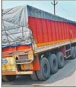
कस्टम कार्यालय पास पकड़ा गया ओवरलोड ट्रक। संवाद

बता दें कि एसडीएम बांसी ने आठ अक्टूबर को एक ट्रक को पकड़ा था। ट्रक की तलाशी ली गई, तो उसमें स्पंज आयरन लोड