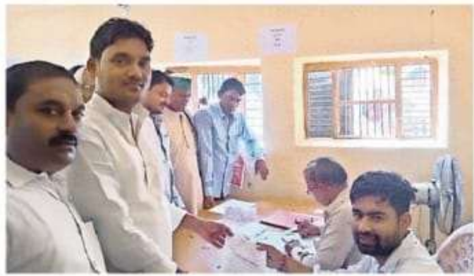
सहकारी गन्ना विकास समिति मुंडेरवा पर पर्चा खरीदते सदस्य