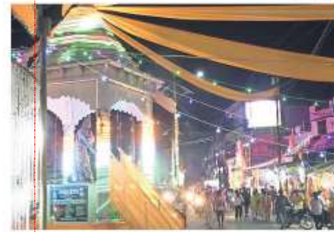
नवरात्र पर भगवा कपड़े से सजाया गया सिद्धार्थ तिराछ व कपड़े वाली गस्ती में दुर्गा प्रतिमा की पूजा करते श्रद्धालु • जगन्नाथ

प्यारा सजा है तेरा...देवी गीतों पर खूब झूमे श्रद्धालु, झालर व लाइट से की गई है पंडालों की विशेष सजावट