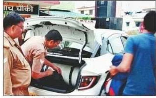
बढ़नी में वाहन की तलाशी लेती पुलिस। संवाद