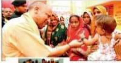
रात्रि प्रवास के बाद बृहस्पतिवार सुबह मां पाटेश्वरी का पूजन करने सीएम श्री अर्धरात्रि प्रवास के बाद