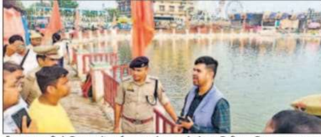
डीएम व एसपी ने सिसवा में दुर्गा पूजा महोत्सव को लेकर निरीक्षण किया।