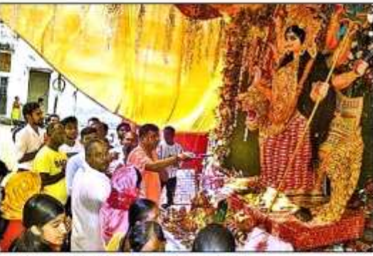
पटेलनगर में गुरुवार को मां की आरती करते श्रद्धालु।

गुरुवार को महासप्तमी पर दुर्गा पूजा पण्डालों में विधि विधान के साथ पूजन अर्चन कर स्थापित माता की प्रतिमाओं की आंखों से पट्टिका हटाई गई। वैदिक मंत्रोच्चारणों के साथ प्रतिमाओं में प्राण-प्रतिष्ठा की गई। पण्डालों में माता की आंखों से पट्टिका हटाने के विशेष पूजन में माता के दिव्य स्वरूप के दर्शन के लिए भारी संख्या में श्रद्धालु जमा हुए। दिन में पूजन अर्चन के बाद शाम को महाआरती के साथ ही पण्डालों को माता के दर्शन के लिए खोल दिया गया। शाम ढलने के साथ