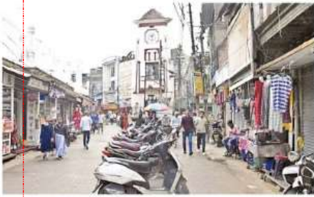
घंटाघर में बीच सड़क में पार्क गड़ियां