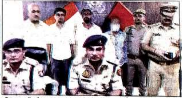
पुलिस लाइन में अवैध पटाखा का अनावरण करते एसपी।

■ बरामद किए गए 216 गत्ता विभिन्न ब्रांड के पटाखे का बाजार मूल्य करीब एक करोड़ बताया जा रहा : एसपी