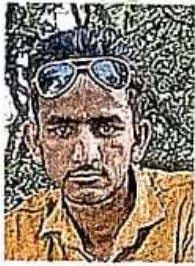
अजमल • फाइल फोटो

जासं, महुली: महुली थाना के अलीनगर गांव स्थित कठिनइयां नदी के पुल से बुधवार को कूदे कारोबारी के बेटे का शव पुलिस ने गोताखोरों की मदद से गुरुवार को बरामद कर लिया। जहां पर वह कूदा था, यहां से करीब 300 मीटर दूर