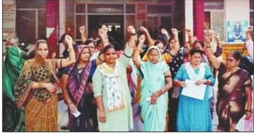
हरैया सीएचसी पर प्रदर्शन करतीं एएनएम।

मुख्यमंत्री सहित उच्चाधिकारियों को संबोधित ज्ञापन देकर मांग की कि एएनएम के गृह जनपद में स्थानांतरण पर लगाई गई रोक को