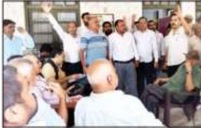
एसडीएम कोर्ट के बाहर प्रदर्शन करते अधिवक्ता गण

न्यायालय में मजिस्ट्रेट ने बिना अधिवक्ताओं के पत्रवातियों को मुक्किलों के साथ देखा।