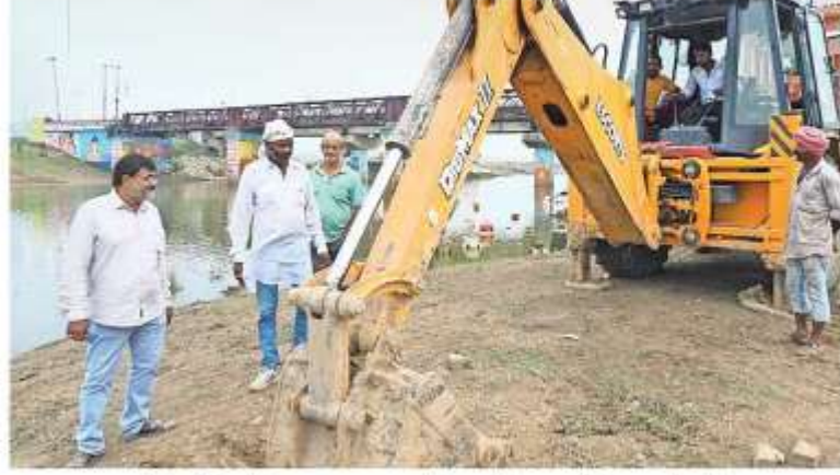
जुमारआर घाट स्थित विसर्जन स्थल पर सफाई करवाते नगरपालिक कर्मचारी

संवेदनशील स्थल चिन्हित, लगेगी पुलिस फोर्स: पुलिस ने संवेदनशील स्थलों को चिन्हित किया है। विसर्जन के दिन नगर की सभी प्रतिमाएं रात्रि आठ बजे के करीब