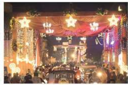
आयोजन समिति ने पंडाल व लाइटों से सजाई गई सदा नया दृश्य भव्य दृश्य • फोटोज

जगन्नाथ संवाददाता, सिद्धार्थनगर : प्यारा सजा है तेरा द्वार भवानी, भक्तों की लगी है कतार, या देवी सर्वभूतेषु शक्तिरूपेण संस्थिता, जैसे मधुर गीतों के बीच शक्ति स्वरूपा मां दुर्गा की श्रद्धालु आराधना कर रहे हैं। शहरदेख नवरात्र को लेकर शहर की रीतक देखते ही बन रही है। शाम छह बजे से ही पंडालों में श्रद्धालुओं की भीड़ बढनी शुरू हो जा रही है। पंडालों में बचने वाले देवी भजनों पर श्रद्धालु झूमते रहे। श्रद्धालुओं ने गुरुवार को मां कालरात्रि की आराधना कर जग कल्याण की कामना की। जगह-जगह स्थापित दुर्गा पंडालों की जगमग लाइटों से शहर की रोभा देखते ही बन रही है। पंडालों में भक्तों द्वारा किया गया मां का श्रृंगार देखते ही बन रहा है। दुर्गा पंडालों की अलौकिक छटा देखने के लिए शाम से ही शहर में श्रद्धालुओं की भीड़ बढ जा रही है। भवानीराज श्रद्धा क्षेत्र के चौरा बनगवा में बुधवार रात जगन्नाथ कार्यक्रम का आयोजन किया गया।