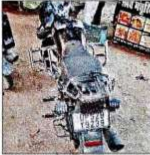
घटना में प्रयोग की गई बाइक। संवाद

भलुअनी कस्बा के एक गांव की कक्षा छह की छात्रा के दादा की तहरीर पर पुलिस केस दर्ज कर आरोपियों की तलाश में जुटी हुई है। अपहरण की कोशिश की घटना को लेकर दूसरे दिन कस्बे में भय का