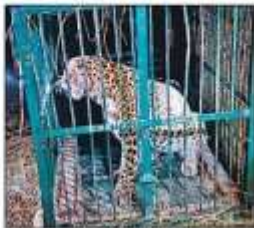
बेड़ा गांव में पिंजरे में कैद मादा तेंदुआ।

बहराइच, संवाददाता। कर्तवियाघाट वन्यजीव प्रभाग के ककरहा रेंज से सटे बेड़ा गांव में मौबाइल टावर के उत्तर दिशा की ओर लगाए गए पिंजरे में बुधवार की रात एक और मादा तेंदुआ कैद हो गई। रेंज कार्यालय पर लाकर पशु चिकित्सकों ने उसका चिकित्सकीय परीक्षण किया। स्वस्थ पाए जाने पर उसे भी गुरुवार को ट्रांस गेरुआ में छोड़ दिया गया। तेंदुए के मूवमेंट को देखते हुए ग्रामीणों को सतर्क किया गया है, ताकि हमले से बचाया जा सके।