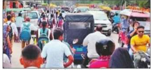
दुर्गा मंदिर के पास लगा जाम। संवाद

निचलौल रोड पर नवरात्र के चलते दुर्गा मंदिर में श्रद्धालुओं का आवागमन बढ़ा है, लेकिन पटरियों पर किया गया अतिक्रमण भीड़ के कारण लोग जाम की समस्या से