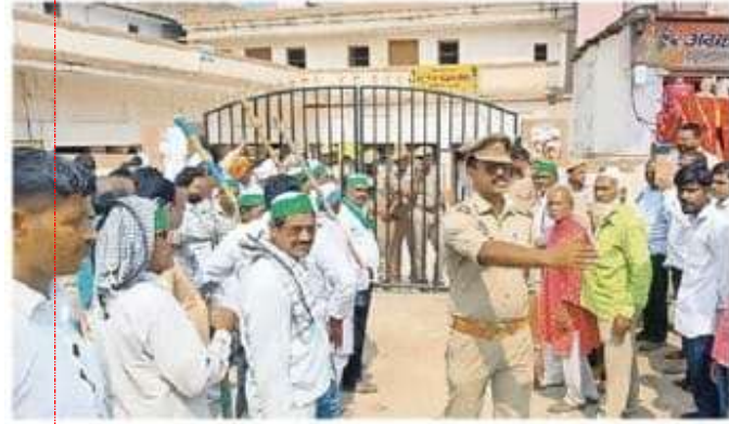
मतदान केंद्र के बाहर भाकियू कार्यकर्ता व पुलिस