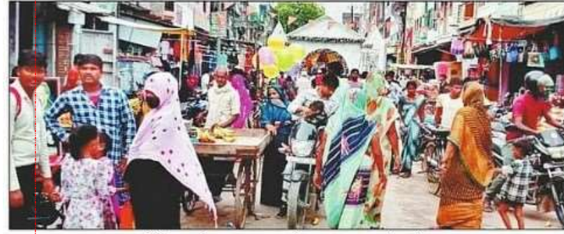
बढ़नी में बवाल के बाद अब बाजार में हालात सामान्य हो गए हैं। संवाद

बढ़नी कस्बे में उपद्रव के बाद खुफिया और सुरक्षा एजेंसियां चौकन्नी, चिह्नित आरोपियों की धरपकड़ के लिए छापे मार रही पुलिस