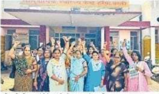
सीएचसी हरैया पर मांगों के सम्बंध में आवाज कुलंद करती एएनएम

जगरण टीम, वस्ती: उत्तर प्रदेश राज्य एनएनएम एएनएम कर्मचारी युनिन के वैनर तले गुरुवार को आनलाइन हार्जिरी व लंबित मांगों के विरोध में एएनएम ने आवाज कुलंद किया। कत कि मांगो पूरी की जाए, अन्यथा संगर्ष की धार तेज की जाएगी। दुर्बलिषा प्रतिनिधि के अनुसार सामुदायिक स्वास्थ्य केंद्र से जुड़े संबिध व स्थायी एएनएम ने सामुदायिक स्वास्थ्य केंद्र पर प्रदर्शन किया। उत्तर प्रदेश के स्वास्थ्य केंद्र पोर्टल पर केंद्र तख उपकेंद्र पर पहुंचकर प्रतिदिन दो फोटो अपलोड करने के आदेश को एक तरह से उल्टीइन बताया। स्वास्थ्य मंत्री को संबोधित ज्ञान केंद्र प्रभारी डा सुशील कुमार को सौंपा। बताया कि