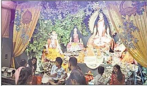
शहर के अनूप नगर में बने पूजा पंडाल में गुरुवार को विराजमान मां दुर्गा की प्रतिमा व मौजूद श्रद्धालु (बाएं)। शहर के सिद्धार्थ तिराहे पर मां के पूजन-अर्चन को उमड़े श्रद्धालु।

वहीं, उसका बाजार क्षेत्र के श्रद्धालुओं ने गुरुवार को अष्टमी का व्रत रखा। इस व्रत की मान्यता है कि महागौरी पूजन, अर्चन व दर्शन मात्र से ही पूर्व के पाप नष्ट हो जाते हैं। मान्यता है कि माता रानी ने आठ साल की उम्र से ही भगवान शिव की पति रूप में पाने के लिए कठोर तप शुरू किया था। कठोर तप करने के कारण देवी कृष्ण वर्ण की हो गई थीं। उनकी तपस्या से देव महादेव ने गंगाजल से देवी की कांति को वापस लौटा दिया। इस प्रकार देवी को महागौरी का नाम मिला। देवी भागवत पुराण के अनुसार भगवान शिव के साथ उनकी पत्नी के रूप में महागौरी सदैव विराजमान रहती