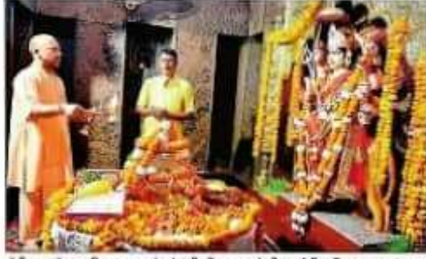
रात्रि प्रवास के बाद बृहस्पतिवार सुबह मां पाटेश्वरी का पूजन करने सीएम श्री अर्धरात्रि प्रवास के बाद

रात्रि प्रवास के बाद बृहस्पतिवार सुबह मां पाटेश्वरी का पूजन करने के साथ ही जनप्रतिनिधियों एवं सामाजिक संगठनों के प्रतिनिधियों से भी मुलाकात की।