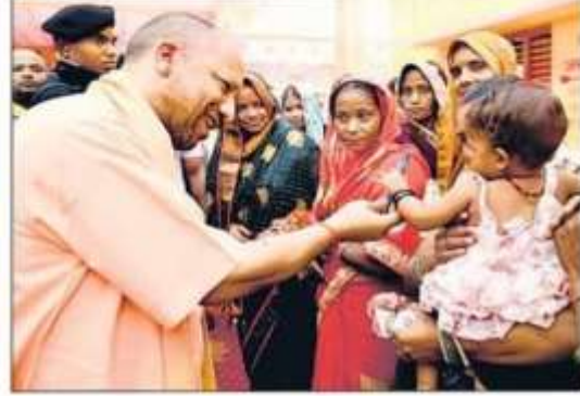
मुख्यमंत्री योगी आदित्यनाथ ने मंदिर परिसर में बच्चों को चाकलेट भी दी।

मुख्यमंत्री योगी आदित्यनाथ के शक्ति पीठ देवी पाटन पर रात्रि विश्राम के दौरान भारत नेपाल सीमा पर विशेष चौकसी बरती गई। पुलिस और एएसबी की संयुक्त टीम सीमा कड़ी क्षेत्र में पैट्रोलिंग करती रही। सीमा पार आने जाने वाले लोगों की गहन तलाशी ली गई। कड़ी फूटकाठ के बाद लोगों को आने जाने दिया गया। मुख्य मंत्री के जाने के बाद सुरक्षा एजेंसियों ने राहत की सांस ली। वहीं मंदिर परिसर में भी कड़ी तमड़ी सुरक्षा व्यवस्था रही।