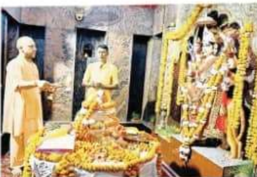
शक्तिपीठ देवीपाटन मंदिर के गर्भगृह में देवी मां की आराधना करते और मंदिर परिसर में बच्चों को चाकलेट देकर दुलारते मुख्यमंत्री योगी आदित्यनाथ

रात्रि के उपासक मुख्यमंत्री योगी आदित्यनाथ भोर में सबसे पहले रात्रि की आराधना की। इसके बाद गौराला पहुंचकर गायों को सेवा की व चरगों को दुलारा। अलग-अलग कमरे से उनको पुकारकर अपने पास बुलाया। इसके बाद देवीपाटन मंदिर