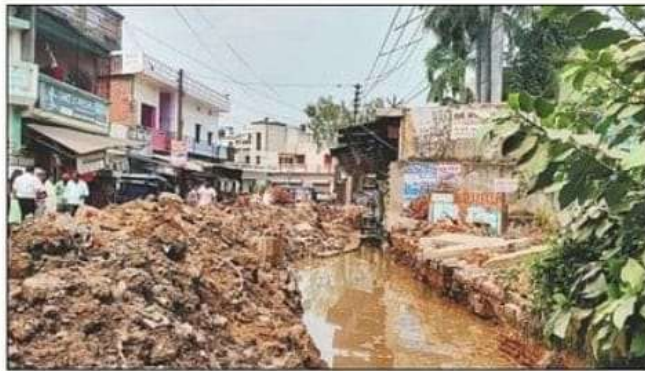
आवास विकास कॉलोनी में नाला निर्माण के लिए शुरु हुई खोदाई। संवाद

अतिक्रमण के चलते 10 मीटर चौड़ाई ही मिल पा रही थी। स्थानीय लोग इससे अधिक चौड़ाई बढ़ाने पर