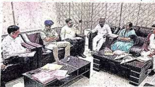
पीडब्ल्यूडी के डाक बंगले में जन प्रतिनिधियों, अधिकारियों संग वार्ता करती जिले की प्रभारी मंत्री विजयलक्ष्मी गौतम (दाएं से दूसरी) • जाबराज

● वाईपास योजना के दो कार्य, जिला मार्ग का चौड़ीकरण में 14 कार्य व अन्य कार्यों की दी जानकारी