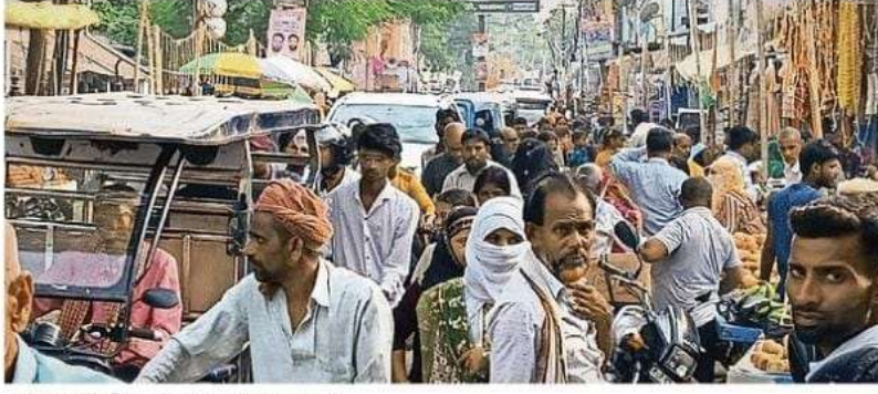
पडरौना नगर के तिलक चौक पर लगा जम-जमकर जागरण

यहाँ बड़े व्यावसायिक वाहनों का खिरकिया से अंदर शहर की ओर प्रवेश प्रतिबंधित रहेगा। जबकि कसया