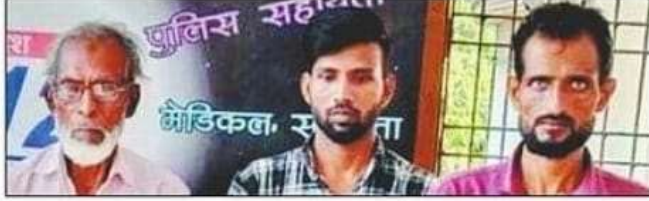
अवैध पटाखा व अन्य सामान के साथ पकड़े गए आरोपी।

बरामद सामान की कीमत करीब तीन लाख रुपये आंकी गई