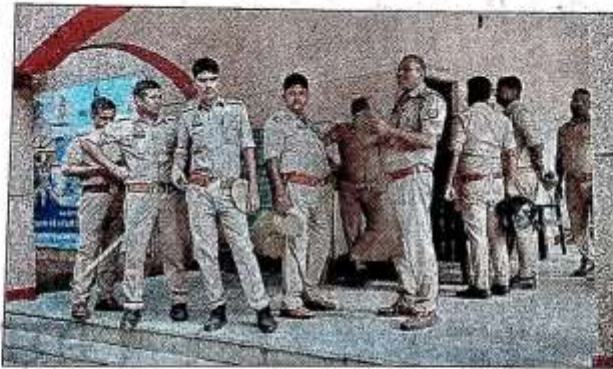
मेंहदावल तहसील में पुनर्मतगणना के दौरान सुरक्षा में लगे पुलिसकर्मी।