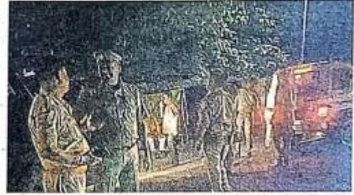
घटना की जानकारी मिलने के बाद मौके पर पहुंची पुलिस