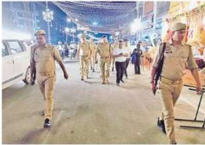
गोरखनाथ मंदिर से निकलने वाली शोभायात्रा के मार्ग पर भ्रमण कर जायजा लेते डीएम व एसएसपी • सी. पुलिस मीडिया सेल

503 सिपाहियों की इयूटी लगी है शोभायात्रा की सुरक्षा में