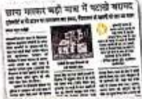
10 अक्टूबर को प्रकाशित खबर

संतकबीरनगर। छत्तीसगढ़ राज्य के नेशनल हाईवे ट्यूबवेल कोलोनी के भंगल में बुधवार को देर रात को 60 लाख रुपये से ज्यादा की कीमत का पटाखा पकड़ा गया। पुलिस ने इस मामले में एस आरओपी के खिलाफ केस दर्ज कर एक आरोपी को गिरफ्तार किया है।