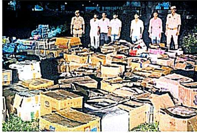
मौहरिया में वरामद पटाखा व बारूद • सो. पुलिस मीडिया सेल

पटाखा निर्माण की सामग्री वरामद-कौड़िया : ग्राम मौहरिया रामापुर व लैबुड़वा में छापेमारी के दौरान भारी