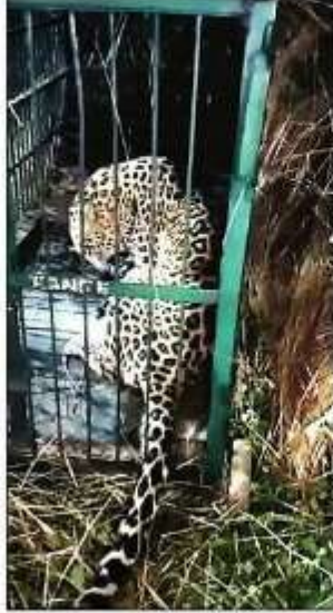
पिंजरे में कैद तेंदुआ।

कतर्नियाघाट घाट वन्यजीव प्रभाग के ककरहा वन रेंज के ग्राम पंचायत बेझा व उसके आसपास तेंदुआ लगातार देखा जा रहा था। जिससे ग्रामीणों में भय का माहौल था। तेंदुए ने एक कुत्ते को निवाला बना लिया था और एक गोवंश की आंख फोड़ दी थी। ग्रामीणों के डर व पिंजरे की मांग को खबर को अमर उजाता में प्रमुखता के साथ प्रकाशित करने पर वन विभाग की ओर से देवनपुरवा में विचपरी चौराहे के पास मंलवार को पिंजरा लगाया गया था। जिसमें