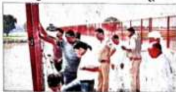
जिला विसर्जन के लिए प्रवेश द्वारों की तैयारी का जल्दी करीब ड्रायवर्जन प्रारम्भ।

दिन तक पुलिस पूरी तरह से चौकिस रहेगी। सुरक्षा और ट्रैफिक व्यवस्था को नियंत्रित कर 1000 पुलिसकर्मी संभालेंगे। इसके अतिरिक्त राष्ट्रीय धारी की पुलिस को विसर्जन के लिए अलर्ट कर दिया गया है। एसपी संकल्प शर्मा ने बताया कि पूरे जिले में सशस्त्र तौर से विसर्जन के लिए पुलिस