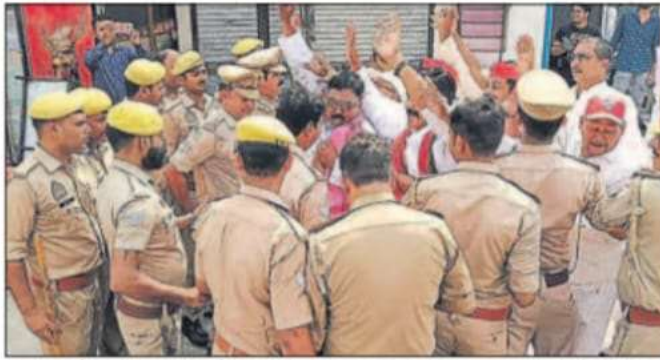
सपा कार्यालय के बाहर प्रदर्शन कर रहे सपाइयों को पुलिस ने आगे बढ़ने से रोक दिया।

महराजगंज, वरिष्ठ संवाददाता। सपा कार्यालय के बाहर सरकार के विरोध में प्रदर्शन करने सड़क पर उतरे कार्यकर्ताओं को पुलिस ने आगे बढ़ने से रोक दिया। लखनऊ के जेपी सेंटर में सपा अध्यक्ष को जाने से रोकने के विरोध में सपाइयों ने सरकार के खिलाफ जोरदार नारेबाजी की। पुलिस ने जब विरोध प्रदर्शन कर रहे सपाइयों को आगे बढ़ने से रोक दिया तो नाराज सपाइयों ने पुलिस के खिलाफ भी जोरदार नारे लगाए। कुछ देर बाद सपाइयों को पुलिस ने वापस कर दिया और तब गहमा-गहमी शांत हुई।