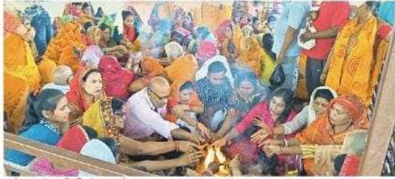
पडरौना नगर के गावडी मंदिर में हवन करते श्रद्धालु • जगदपा

सुबह से ही पूजन की तैयारी में जुटे रहे श्रद्धालु, महिलाओं ने भरी मां की गोद विभिन्न जगहों पर कलाकारों ने सजाई शक्तिवा, देवी मंदिरों में श्रद्धालुओं ने किया पूजन-अर्चना