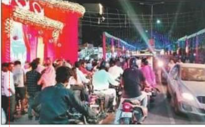
दशहरा की पूर्व संध्या पर गांधीनगर में रही गहमागहमी। संवाद

विसर्जन की ईको फ्रेंडली व्यवस्था, इस बार नदी की जगह गड्डे में होगा प्रतिमाओं का विसर्जन