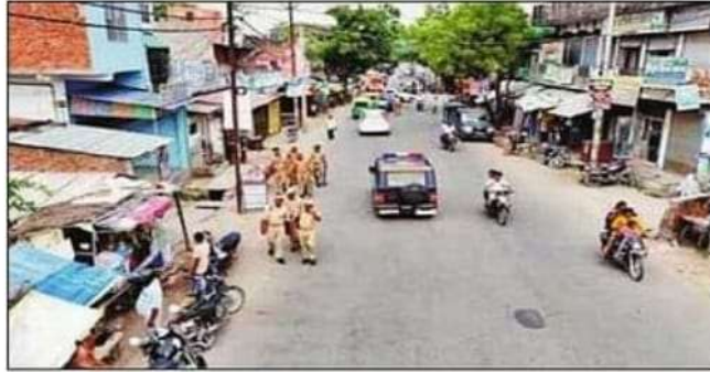
ड्रोन कैमरे से छावनी मोहल्ले में पुलिस ने की निगरानी।

सोमवार को पडरौना के छावनी में हुए दुर्गा प्रतिमा पर पथराव के बाद पुलिस फूंक-फूंक कर कदम रख रही है। छोटी-छोटी सूचनाओं को भी