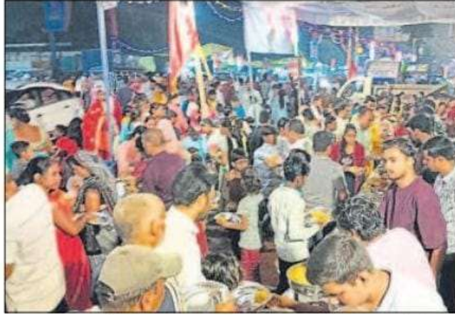
शहर में शुक्रवार की रात प्रतिमाओं के दर्शन-पूजन को उमड़ी श्रद्धालुओं की भीड़।

शहर के प्रतिमा पंडालों में प्रतिमाओं के नेत्रपट पिछले बुधवार को खुले। इसके बाद से पंडालों में सजी मां भगवती के दर्शन को श्रद्धालुओं का सैलाब उमड़ रहा है। शाम होते ही पूरी रात चौराहे दूधिया रोशनी से जगमग हो रहे हैं। इस दौरान जय माता दी समेत देवी गीतों गूंज शहर से लगायत गांव में सुनाई दे रही है। इससे माहौल पूरी तरह भक्तिमय बना हुआ है। नवरात्र के पहले दिन से दुर्गा पूजा समितियों के पदाधिकारी व सदस्य युद्ध स्तर पर पंडालों को सजाने में जुटे हुये थे। इस लेकर शहर से लगायत गांव तक पूरा माहौल भक्तिमय बना हुआ है।