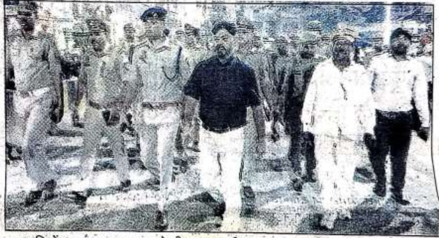
नवरात्रि में शहर का भ्रमण करते डीएम व एसपी।

शहर कोतवाली खलीलाबाद का डीएम व एसपी ने किया पैदल भ्रमण