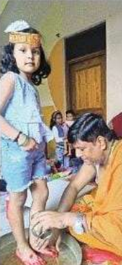
कन्या पूजन करते व्यापार भद्रत अश्याम संधिन खरमिथा • सोहवा

भारत का संवैधानिक अधिकार: सरदेश नवरात्र के नौवें दिन शुक्रवार को सुक से ही कन्या पूजन और हवन का क्रम चलता रहा। कन्याओं को भोजन व हवन कर लोगों ने व्रत की पूर्णाहुति की। प्रसाद वितरित किया गया। देर शाम तक मंदिरों और शहर में लेकर गांव तक दुर्गा पंडालों में पूजन का क्रम चलता रहा। महिलाओं ने नारियल, चुनरी और श्रृंगार के सामान से मां दुर्गा को गोद परो। पडरौना नगर के दुर्गा मंदिर और विभिन्न पंडालों में भी श्रद्धालुओं की भीड़ लगी रही। देवी मंदिरों में पूजन के लिए श्रद्धालुओं की भीड़ लगी रही। महानयनों से मां के सिद्धिविग्रहों को पूजा कर श्रद्धालुओं ने हत्याकांड की बरतना को। ब्रह्मा मुहूर्त में शुरू पूजन-अर्चना का क्रम रात तक चलता रहा। मंदिरों में बजते टा-घड़ियाल तथा श्रद्धालुओं के लक्ष्मी से वातावरण देखभल बना रहा। नगर स्थित बुद्धिमा माई मंदिर, खरकिया स्थित प्रसिद्ध खरकिया माई मंदिर का कण्ठ सहे तीन बजे रात में ही खुल गया। इसी तरह राखवा देवी मंदिर, रामकोला के धर्मसमवा देवी मंदिर, कुम्हार माई स्थान, हनुकूल स्थान, मैनापुर देवी मंदिर, सेठ माई स्थान, जंगली कोट माई मंदिर, खरौलीगा दुर्गा मंदिर रामकोला डेड सुरजमगर, जगदी माई सरपाती बुंद, बेलवा, पटवा, अकवपुर आदि जगहों पर पूजन-अर्चना के लिए श्रद्धालुओं का तांता लगा रहा। मंदिरों में पहुंचे श्रद्धालुओं ने नारियल, चुनरी, फूल आदि चढ़ा कर मनन किया। प्राचीन शक्तिशाली खरवा देवी