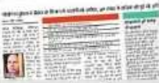
7 अक्टूबर को प्रकाशित खबर।