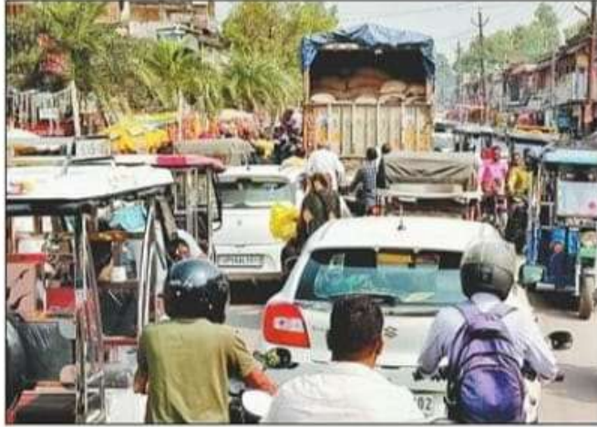
नगर के दुर्गा मंदिर के पास लगा जाम। संवाद

फरेंदा की ओर से आने वाले सभी भारी वाहन जिनको निचलौल, चौक, सिंदुरिया, शिकारपुर जाना हो वह वाहन नो-इंट्री के समय कैम्पियरगंज, पनियरा, परतावल, शिकारपुर, सिंदुरिया होकर जाएंगे। गोरखपुर, परतावल बाजार की तरफ आने वाले सभी भारी वाहन वाहन नो-इंट्री के समय शिकारपुर से ही डायवर्जन, रोका जाएगा। पनियरा