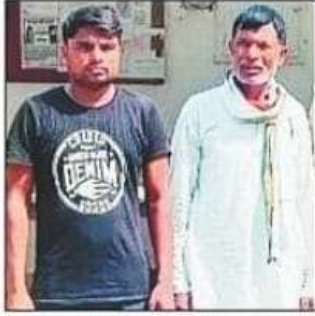
नेबुआ नौरंगिया थाने में पकड़े गए अवैध पटाखा कारोबारी।