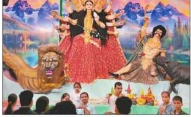
शहर के गांधीनगर में स्थापित मां दुर्गा की प्रतिमा।