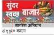
सुंदर स्वच्छ बाजार जागरण अभियान की शुरुआत

अतिक्रमण के चलते घंटों बनी रहती है जाम की स्थिति, पेयजल व सफाई का अभाव, कभी मशहूर था हलवाई द्वारिका का बर्फी व गट्टा