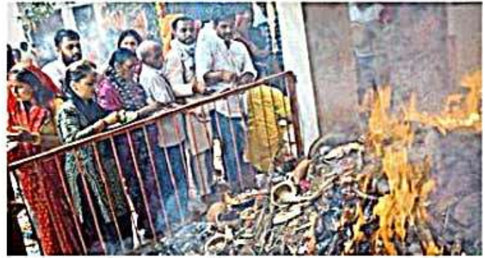
काली भवानी मंदिर में हवन - पूजन करते श्रद्धालु • जाजरण

भवानी, काली भवानी, उत्तरी भवानी, मंश देवी, मां वेल्सही माता, मेहनौन देवी मंदिर, मुंगरोल देवी समेत अन्य देवी मंदिरों में श्रद्धालुओं का तांता लगा रहा। श्रद्धालुओं ने हवन पूजन कर सुख व समृद्धि का आशीर्वाद मांगा। दोपहर बाद नवमी तिथि होने के कारण शाम को मंदिरों व पूजन पांडालों में नवम सिद्धिदत्री का भी