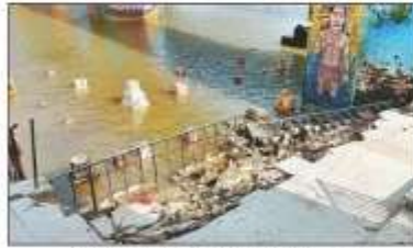
शहर के जमुआर घाट पर पुल के पास टूटी रेलिंग।

सिद्धार्थनगर। शहर के जमुआर घाट पर शनिवार को प्रतिमाओं का विसर्जन किया जाएगा। दशहरा के दिन दोपहर बाद प्रतिमाओं का विसर्जन शुरू होगा। इसी घाट पर सम्कलीकरण का कार्य किया गया, जाकी मय भवगत की व्यवस्था भी होगी। जमुआर घाट पर रात में प्रतिमाओं का विसर्जन होगा, बंदपूर क्षेत्र की प्रतिमाएं भी जमुआर घाट में विसर्जित होंगी। इसके लिए शुभकर को शुद्धी में शुद्धकरा का सावधानीकरण का कार्य किया। इस बार अतिव्यय से ही दूध की बरतिका व चारू के कलश घाट पर नवी अलवा है। सम्कलीकरण के व्यवस्था भी घाट पर अगुवी तैयारी का नका आ रही है, इसीलिए, अधिकारियों के अनुसार तैयारी पूरी कर ली जाएगी। इसी प्रकार विद्वाने घाट पर तैयारी अगुवी नजर आ रही है, जाकी घाट पुल के नीचे जलकुंभों को भी जाम नहीं करे गां है। इस मामले में नगर पालिका परिषद के ईसे विचारण ने बतला कि, प्रशासन के निर्देश के अनुसार तैयारी का का रही है। रोकना मुक तक तैयारी पूरी हो जायेगी। रात