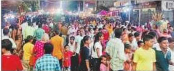
शहर के विद्वान विराटे से बाकी मार्ग तक मां दुर्गा की प्रतिमा के दर्शन करने उमड़ी श्रद्धालुओं की भीड़।

असह्य से पकड़ें की ओर मुड़ चलेंगे रावण : पुलिस के रुट डायवर्जन के अनुसार शनिवार से दो दिन रुट डायवर्ट रहेंगे। शहर में बड़े खतरों का प्रवेश रोकित होगा, जाकी बंदपूर से अपने खले खतरों को अंतराहित से दौरे अपने जेज दिया गया। (संवाद, विसर्जन और मेला के दौरान हो कर डायवर्जन होगा।)