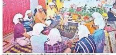
पडरौना नगर के सहदवान उत्तरी स्थित दुर्गा पंडाल में हवन करते आश्विनक • जगदपा