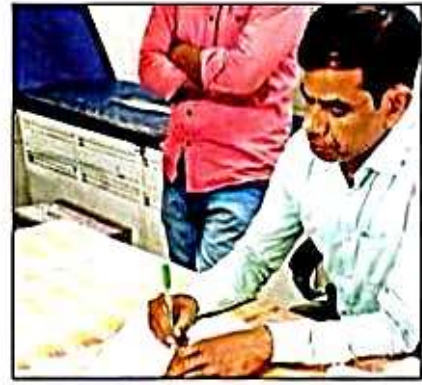
मेडिकल कॉलेज में फोटोकॉपी वाली बीएचटी व इमरजेंसी में फोटोकॉपी पर मरीज की भर्ती प्रक्रिया पूरी करते चिकित्सक।