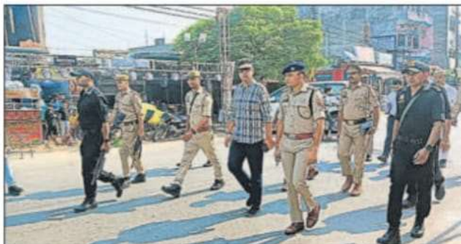
डीएम व एसपी ने परतावल में पैदल मार्च का सुरक्षा का अहसास कराया।

डीएम व एसपी ने सबसे पहले श्यामदेउरवा और परतावल स्थित पंडालों का निरीक्षण किया। परतावल में दोनों अधिकारियों ने पैदल मार्च कर आम लोगों को सुरक्षा का भरोसा दिया। इसके बाद जिलाधिकारी और पुलिस अधीक्षक ने इंदरपुर, घुघली और शिकारपुर में विभिन्न दुर्गा पंडालों सहित