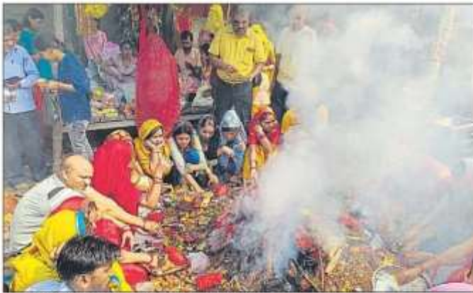
शुक्रवार को काली मंदिर आवास विद्यालय में हवन-पूजन करते ब्रह्मानु। ● हनुमान

अधिकतर लोगों ने दुर्गा अष्टमी का व्रत 10 अक्टूबर को रखा था। ऐसे देवी भक्तों ने सुबह मंदिरों में पहुंचे और हवन-पूजन कराया। दान-दक्षिणा के बाद प्रसन्न का वितरण किया। वहीं घरों में देवी मां के स्वरूप कन्या पूजन कर आशीर्वाद लिया। ब्रह्मानुओं ने अष्टमी को देवी मां महाशैवी और नवमी को देवी मां विद्विधात्री की पूजा-अर्चना कर सुरक्षाती मानी। पंचंग के अनुसार, अतिथि शुक्ल अष्टमी को दुर्गा अष्टमी और नवमी तिथि को महात्म्यी के नाम से जानते हैं। दुर्गा अष्टमी के दिन मां