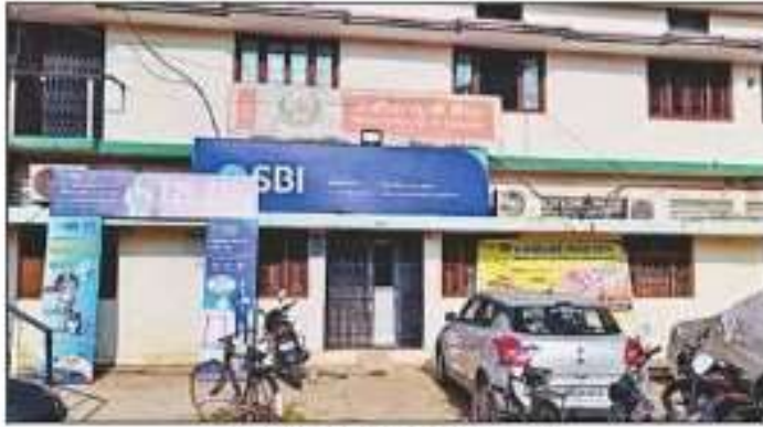
एसबीआई जंगल कौड़िया। संवाद