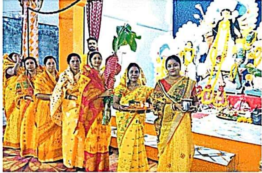
मालवीयनगर स्थित चुंगी गोदाम के निकट सजी देवी प्रतिमा रूपी बेटों के श्रृंगार के लिए हल्दी व तेल समेत अन्य सामग्री लेकर आई सुहागिनें • जगदण

• सिंदूर खेला व कनक अंजली समेत अन्य रस्मों के बीच देंगे विदाई