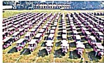
शहीदे आजम सरदार भगत सिंह इंटर कालेज में शक्ति सारथी के लिए तैयार किए गए इं-रिक्शा