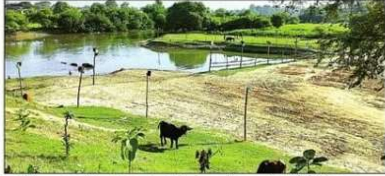
झिंगहाघाट पर विसर्जन स्थल पर की गई सफाई व लगाई गई बैरिकेडिंग।

सीसीटीवी कैमरों के साथ ही पुलिस व खुफिया विभाग टीम रख रही अराजक तत्वों पर नजर