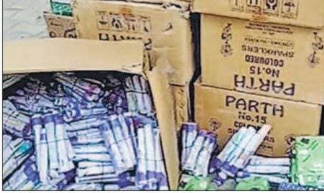
जंगल विशुनपुरा में बरामद किए गए अवैध पटाखे।

पुलिस को सूचना मिली कि पडरौना कोतवाली क्षेत्र के जंगल विशुनपुरा में एक व्यक्ति ने भारी मात्रा में अवैध रूप से पटाखों का भंडारण किया है। पुलिस मौके पर पहुंची और पृष्ठताछ के बाद उस व्यक्ति को पकड़ लिया। उसके कब्जे से सात बोरी, 15 कार्टून