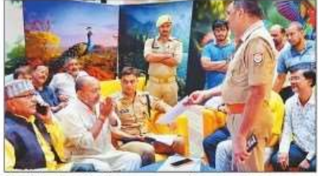
बर्डघाट रामलीला समिति के पदाधिकारियों के धरने पर बैठने की सूचना पर पहुंचे सीओ कोतवाली एवं थानाध्यक्ष राजघाट ने मामले को संभाला। संवाद