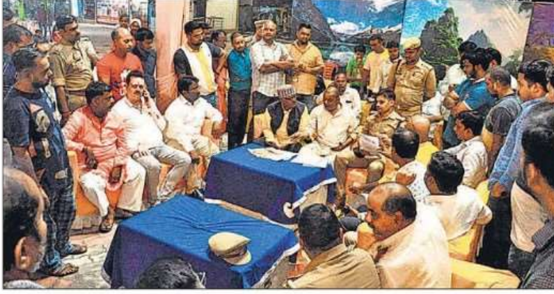
शुक्रवार को कनेक्शन कटने के विरोध में आक्रोशित बर्डघाट रामलीला कमेटी के पदाधिकारियों से बात करते पुलिस अधिकारी।

इसकी जानकारी होने के बाद से ही प्रशासनिक अफसरों ने रामलीला कमेटी से संपर्क कर समझाने की कोशिश की लेकिन शाम 7:30 बजे मंचन स्थल के पास ही कमेटी के लोग