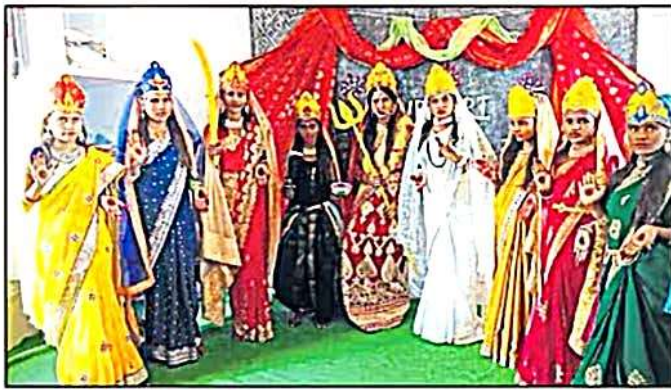
भगहर बुलंद कंपोजिट स्कूल में नव दुर्गा की झांकी प्रस्तुत करती बच्चियां।