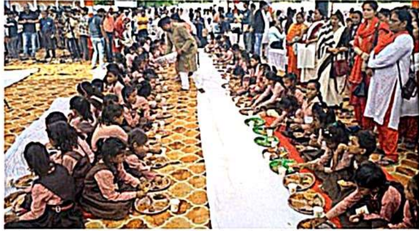
शहीदे आजम सरदार भगत सिंह इंटर कालेज मैदान में आयोजित शक्ति वन्दन कार्यक्रम में कन्याओं को भोज कराते अधिकारी व कर्मचारी

कन्याओं को हड़जिन किट व पोपण पोटली वितरित भी वितरित की गई। डीएम ने अलग-अलग क्षेत्र में उत्कृष्ट कार्य करने वाली महिलाओं को नव देवी सम्मान से सम्मानित किया। नव अंशिका