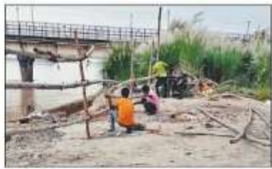
रातों रात पर सुरां प्रतिमा विसर्जन को लेकर बैकिटिंग करने करंगी।

सिद्धार्थनगर। दशहरा, पथ संचलन व दौरे प्रतिमाओं के विसर्जन को लेकर एमटीएच ने रुट का अव्यवजन का दिव है। उन्होंने कहा, मेलाखण्ड कार्मे की सुरां घाट नदी में विसर्जन होंगे। घाट नदी पर बरखों के बरम घाट सावधानी व्यवस्था और घाट में विसर्जन के घाट पर मेलाखण की व्यवस्था कराई जाएगी। एमटीएच पथ धन गिराहे में कहा कि कार्मे में बंदपूर की ओर की दुकानें हुए बंदे खतरों को कार्मे में प्रवेश रोकित कर दिया जाए है। सैक्टर में खतरों को रावण के चरने खले खतर पीछे गिराहा में छुआरल खले हुए मयुध पीछा का रोकत जाएगी। मुक व मेला खले खतरें लोटे व बड़े खतर खतरें कार्मे में रोकत जाएगी। एमटीएच ने कहा कि, प्रतिमाओं का विसर्जन खले नदी में होय है। जम पंचायत को निर्दिष्ट किया गया है कि विसर्जन करे की पीछे इस करे की सुरां का विसर्जन केन के कारण से कराई। रात