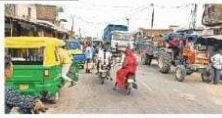
कुदरहा बाजार में शोरमजानकी मार्ग पर अतिक्रमण

7 किमी दूर से आते हैं गावक, सबके नक सबके व पेयजल की सुविधा नहीं