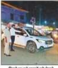
दशहरे पर बड़े खतरों को रोकने पुलिसवर्गी।