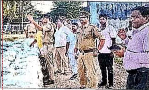
मगहर में दुर्गा प्रतिमा विसर्जन स्थल का निरीक्षण करते एसपी। श्रेष्ठ पुलिस

एसपी व एएसपी ने विसर्जन स्थलों का जायजा लेकर कमियों को दूर करने का दिया निर्देश