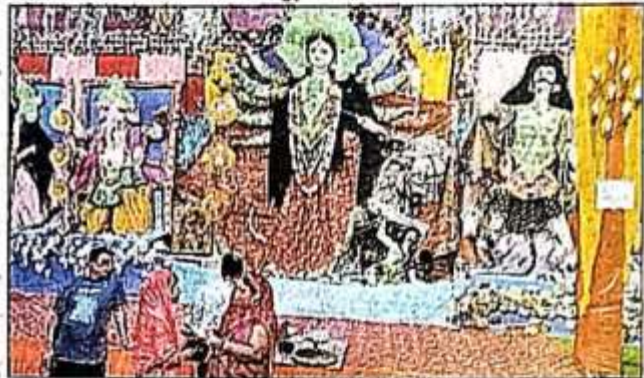
बखिरा के मंगल बाजार में स्थापित पंडाल में उमड़ी श्रद्धालुओं की भीड़। संवाद