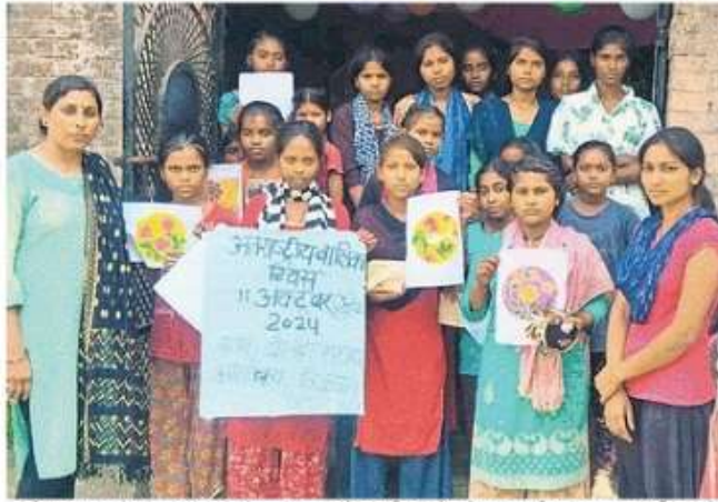
इकौना ब्लॉक के ग्राम पंचायत बेलहा राघव में कार्यक्रम के दौरान चार्ट पर बनाए गए चित्र को दिखाती बालिकाएं