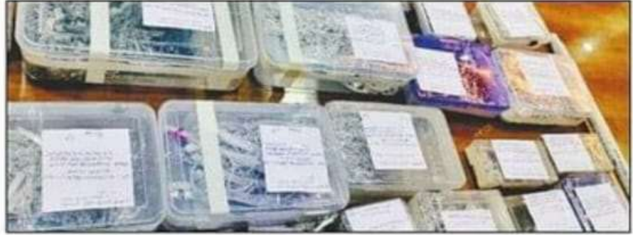
बरामद चांदी और सोने के सामान।