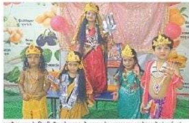
पडरौना नगर के डिंगी तौड पले स्कूल में नवरात्र के अवसर पर आयोजन में पंड दुर्गा, मां सरस्वती, मां लक्ष्मी, भद्रकाली गणेश, भगवान कार्तिकेय वने वरुण • जगदपा

वैष्णव संप्रदाय से जुड़ा है स्थान कुलकुल माता के स्थान पर दो पिंडी है। एक पिंडी का संबंध वैष्णव संप्रदाय से बताया जाता है। विष्णुदेवी के अनुसार अज्ञातवास के दौरान पंडारों को भीष्म ने इस देवी स्थान के बारे में बताया था। वह कुछ दिन यहां थिरा भी थे। यहां पूजा आराधना को तो माता ने उन्हें शक्ति प्रदान किया था। कहते हैं कि पंडारों ने ही एक पिंडी स्थापित की थी।