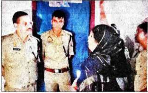
घटना के बारे में पूछताछ करते पुलिस अधिकारी।