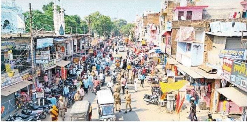
कसया में ड्रोन कैमरा से निगरानी

सुरक्षा को लेकर अलर्ट रहा पुलिस-प्रशासन-शाम को संबंधित अधिकारियों ने दुर्गा पंडाल में श्रद्धालुओं की भीड़ उमड़ी। सुरक्षा व्यवस्था को लेकर