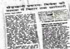
10 अक्टूबर को प्रकाशित खबर।

पुलिस ने चारों आरोपियों की पहचान कर कार्रवाई में जुट गई। छह अक्टूबर की देर रात सिरसिया गोटा रोड पर पुलिस से मुठभेड़ में