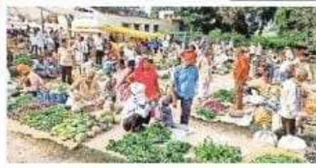
शुद्ध बाजार में सामान्य दृश्य