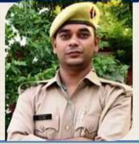
पैरोकार का0 बबलू