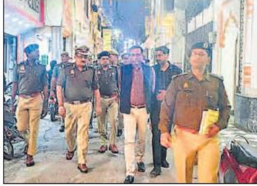
एडीजी ने रविवार को अधीनस्थों के साथ जुलूस मार्गों का निरीक्षण किया।