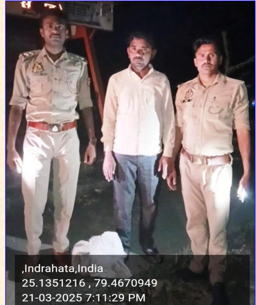
,Indrahata,India 25.1351216 , 79.4670949 21-03-2025 7:11:29 PM