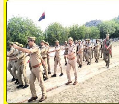
मंगलवार परेड निरीक्षण/पुलिस लाइन भ्रमण